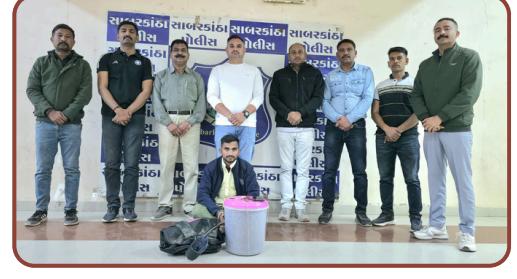
હિંમતનગરના ધ્રણિધા નાકેથી સાબરકાંઠા SOGએ ગાંજાના જથ્થા સાથે પોશીનાના શપ્સને ઝડપ્યો. અમદાવાદ અને રાજસ્થાનના કનેક્શનની તપાસ તેજ.

ટીમો રવાના કરી છે. પોલીસની આ આક્રમક કાર્યવાહીથી ડ્રગ્સ પેડલરોમાં ફફડાટ વ્યાપી ગયો છે. સામાન્ય જનતાના સ્વાસ્થ્ય સાથે ચેડા કરતા આવા તત્વો સામે હજુ પણ વધુ કડક પગલાં લેવાશે તેવું પોલીસ સૂત્રોએ જણાવ્યું છે. રિપોર્ટ : વિશાલ ચૌહાણ