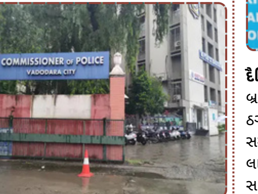
કારેલીબાગ પોલીસની શરમજનક કામગીરી. ન્યાય માંગવા ગયેલા ફરિયાદી સામે જ ગુનો નોંધ્યો. પીડિત પક્ષે CP ને પાઠવ્યું આવેદન પત્ર.

કરવા માટે બેઠા છે? કારેલીબાગ પોલીસની આ 'કાઈમ કુંડળી' હવે કમિશનરના ટેબલ પર પહોંચી છે. પત્રકારત્વના માધ્યમથી અમે પૂછી રહ્યા છીએ કે, ફરિયાદીને જ ગુનેગાર બનાવવાનું લાયસન્સ પોલીસને કોણે આપ્યું? જવાબદાર સ્ટાફ સામે કડક પગલાં ક્યારે લેવાશે?