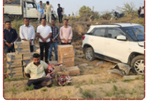
થરાદ પોલીસે ભાયર-મહાદેવપુરા રોડ પરથી બ્રેજા ગાડીમાં છુપાવેલો 3.43 લાખનો દારૂ ઝડપ્યો. કુલ 7.13 લાખનો મુદ્દામાલ જપ્ત કરી કાર્યવાહી કરી.

આ જથ્થાનું પાચલોટિંગ કરવામાં આવી રહ્યું હતું. આથી પોલીસે પકડાયેલ ઈસમ સહિત કુલ ચાર શપ્સો વિરુદ્ધ થરાદ પોલીસ મથકે ગુનો નોંધી આગળની કાયદેસરની કાર્યવાહી હાથ ધરી છે. રિપોર્ટ : વશાભાઈ વાલડીયા