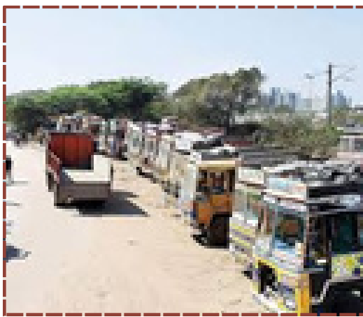
વડોદરા ટ્રાફિક પોલીસ દ્વારા માર્ગ સુરક્ષા માટે સ્પેશિયલ ડ્રાઈવ. 24 કલાકમાં 32 અને એક મહિનામાં 138 વાહનો ડિટેઈન કરાયા.

વેગ આપી રહી છે, તેનાથી માર્ગ અકસ્માતના દરમાં નોંધપાત્ર ઘટાડો થવાની અપેક્ષા છે. આગામી દિવસોમાં પણ આ ઝુંબેશ વધુ તેજ બનાવવામાં આવશે, જે વડોદરાને ટ્રાફિકની સમસ્યામાંથી મુક્તિ અપાવવામાં મહત્વનો ફાળો આપશે.