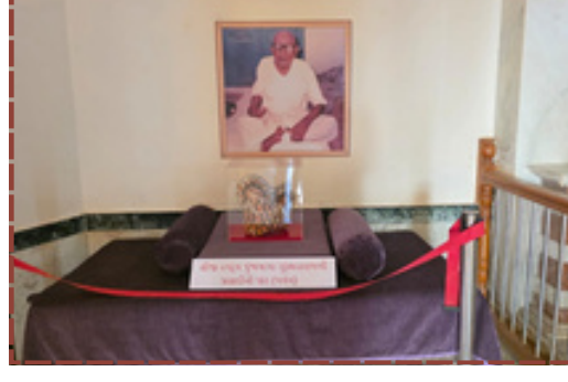
વડસરમાં શિક્ષાપત્રી દ્વિશતાબ્દી અને પૂંજાબાપા ગુરુમહારાજની 140મી જન્મજયંતિની ભક્તિસભર ઉજવણી અને નગરયાત્રા યોજાઈ રહી છે.

રહ્યા છે. સામાજિક અગ્રણીઓ પણ આ મહોત્સવમાં હાજરી આપી ગુરુમહારાજની શિક્ષા અને શિક્ષાપત્રીના આદર્શોને બિરદાવી રહ્યા છે. આ મહોત્સવ દ્વારા વડસરના હરિભક્તોમાં એકતા અને સેવાભાવનાના અનેરા દર્શન થાય છે, જે નવી પેઢી માટે સંસ્કારનું સિંચન કરી રહ્યા છે. રિપોર્ટ : ભાવિન પટેલ