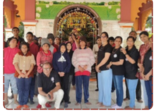
શ્રી માનવ સેવા ચેરીટેબલ ટ્રસ્ટ ગોંડલ દ્વારા જેતપુરના મનોદિવ્યાંગ બાળકોને ગોંડલના તીર્થસ્થાનોની યાત્રા અને ભોજન કરાવાયું.

બિરદાવતા જણાવ્યું હતું કે, દિવંગતોની પુણ્યતિથિ ઉજવવાની આ રીત ખરેખર અનુકરણીય છે. શ્રી માનવ સેવા ચેરીટેબલ ટ્રસ્ટની આવી માનવતાવાદી પ્રવૃત્તિઓ સમાજમાં કરુણા અને સેવાભાવનાને મજબૂત બનાવે છે. આજના આ આયોજનથી મનોદિવ્યાંગ બાળકોને એક નવી ઓળખ અને હૂંફ મળી છે.