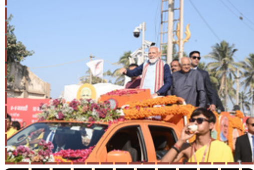
સોમનાથ સ્વાભિમાન પર્વમાં વડાપ્રધાન નરેન્દ્ર મોદી સહભાગી થયા. શંખ સર્કલ પર હજારો લોકોએ પુષ્પવર્ષા સાથે કર્યું ભવ્ય સ્વાગત.