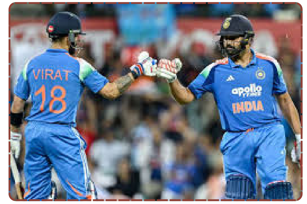
વડોદરાના આંગણે ભારતનો ભવ્ય વિજય થયો છે. ન્યૂઝીલેન્ડ સામેની પ્રથમ વનડેમાં ૪ વિકેટે વિજય મેળવી ભારતે ૨૦૨૬માં વિજયી શ્રીગણેશ કર્યા છે. વિરાટ કોહલીના ૯૩ અને કેપ્ટન શુભમન ગિલની અડધી સદીએ દેશનું ગૌરવ વધાર્યું

નેતૃત્વમાં ભારતીય ટીમે દક્ષિણ આફ્રિકા સામેની હારને પાછળ છોડીને જે રીતે કમબેક કર્યું છે, તે યુવા પેઢી માટે પ્રેરણાસ્ત્રોત છે. વડોદરાના કોર્ટેબી સ્ટેડિયમમાં ગુંજતા 'ઇન્ડિયા-ઇન્ડિયા' ના નાદ સાથે આ જીતે દેશની એકતા અને ખેલદિલીના દર્શન કરાવ્યા છે. ભારતની આ વિજયી કૂચ હવે વધુ તેજ બનશે અને વૈશ્વિક ફલક પર તિરંગો વધુ ગર્વથી લહેરાશે. આ જીત દર્શાવે છે કે જ્યારે નેતૃત્વ મજબૂત હોય અને ખેલાડીઓ પ્રતિબદ્ધ હોય, ત્યારે કોઈ પણ લક્ષ્ય અશક્ય નથી. વડોદરાવાસીઓએ જે રીતે સ્ટેડિયમમાં હાજર રહીને ઉત્સાહ વધાર્યો, તે ખરેખર પ્રશંસનીય છે. આ જીત સાથે ભારતે સાબિત કર્યું છે કે આગામી વર્લ્ડ કપ માટે પણ ટીમ ઇન્ડિયા પૂરી રીતે સજ્જ છે.