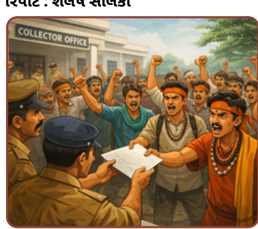
દયાદરામાં આદિવાસીઓ પર હુમલા અને પોલીસની પક્ષપાતી કામગીરી વિરુદ્ધ સનાતની હિન્દુ આદિવાસી સમાજનું કલેક્ટરને આવેદન.

કરવાની ચીમકી ઉચ્ચારી છે. આ લડાઈ હવે ન્યાય મળે ત્યાં સુધી અટકશે નહીં.