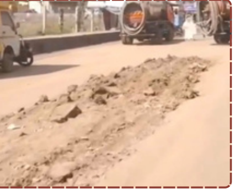
રિપોર્ટ : શૈલેષ સોલંકી

સવાલ પૂછી રહી છે કે શું અમે આ જર્જરિત રસ્તાઓ માટે ટેક્સ ભરીએ છીએ? પ્રાથમિક સુવિધા આપવામાં નિષ્ફળ ગયેલા સત્તાધીશો સામે કાર્યવાહી કોણ કરશે? વહીવટી તંત્રની આ નિષ્ફરતા જનતાના ધૈર્યની કસોટી કરી રહી છે. જો સત્વરે નવો રસ્તો બનાવવામાં નહીં આવે, તો ભરૂચની જનતા આ અન્યાયી તંત્રને જગાડવા રસ્તા પર ઉતરશે તે નક્કી છે.