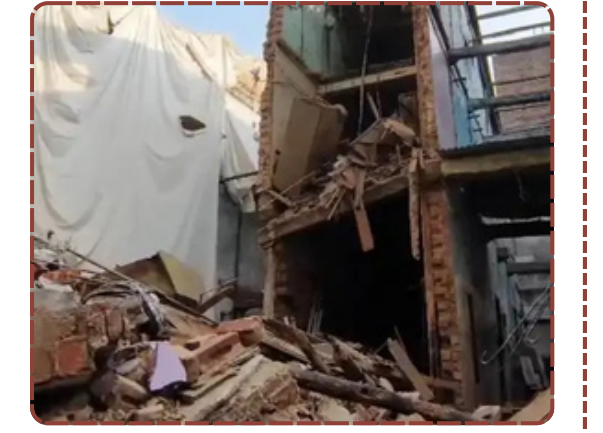
વડોદરાના ન્યાય મંદિરમાં જર્જરિત મકાન ધરાશાયી થતા અફરાતફરી. તંત્રની આજસ અને આંતરિક વિવાદે નિર્દોષોના જીવ જોખમમાં મૂક્યા.

જો પાલિકા આજસ ખંખેરીને તમામ જોખમી મકાનો તાત્કાલિક નહીં ઉતારે તો આગામી દિવસોમાં થનારી કોઈ પણ મોટી જાનહાનિ માટે શાસકોએ સીધી જવાબદારી સ્વીકારવી પડશે. જનતાના ટેક્સના પૈસે મોજ કરતા અધિકારીઓ હવે જવાબ આપે.