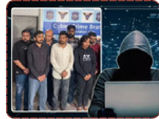
અમદાવાદમાં પ્રોફેસરને 20 દિવસ ડિજિટલ એરેસ્ટ કરી 7.12 કરોડ પડાવ્યા. કંબોડિયા-ચાઇનીઝ ગેંગનો આતંક, ક્યાં છે સરકારની સાયબર સુરક્ષા?

આર્થિક લૂંટ નથી, પરંતુ રાજ્યના વહીવટી તંત્રની નિષ્ફળતા છે. સાયબર ક્રાઇમના વધતા ગ્રાફ વચ્ચે નાગરિકો હવે ભગવાન ભરોસે છે. જો પ્રોફેસર જેવા શિક્ષિત લોકો પણ ૨૦ દિવસ સુધી સિસ્ટમની મદદ ન મેળવી શકતા હોય, તો સામાન્ય પ્રજાની હાલત શું હશે?