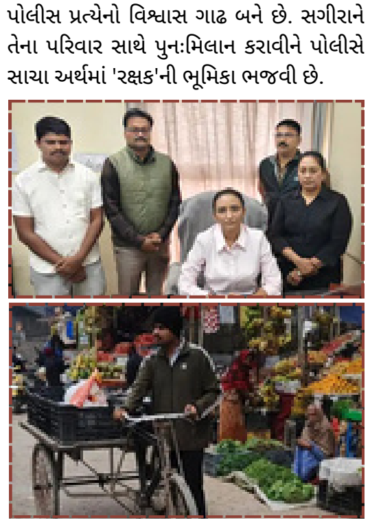
બિહારમાં વડોદરા પોલીસનું 'મેગા રેસ્ક્યુ ઓપરેશન': શાકભાજીની લારી ચલાવી ૮ મહિનાથી અપહત સગીરાને મુક્ત કરાવી