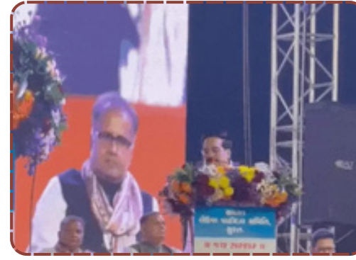
સુરત: પાટીદાર સમાજના રાજસ્વી સન્માનમાં ઉમટ્યું નેતાઓનું ઘોડાપૂર; CM ભૂપેન્દ્ર પટેલે બિરદાવી સમાજની ગરિમા

આ સમારોહ પાટીદાર સમાજની સેવાભાવના, વિકાસ પ્રત્યેની પ્રતિબદ્ધતા અને ભાજપના સબળ નેતૃત્વ વચ્ચેના અતૂટ વિશ્વાસનું પ્રતિબિંબ પૂરું પાડતો હતો.