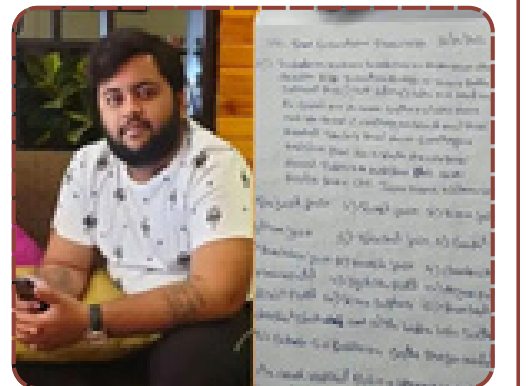
ભાજપ નેતાના પુત્રના ગુમ થવાના કેસમાં 'છેતરપિંડી'નો મોટો ઘડાકો: NEET કાંડના આરોપીએ ભાજપ ઉપાધ્યક્ષની પોલ ખોલી

જોરે ગુજરાતમાં કરોડોના ખતરનાક ખેલ ખેલાઈ રહ્યા છે. આ આક્ષેપોએ અમરેલીથી વડોદરા સુધી ચકચાર મચાવી છે અને ભાજપના વિજય રથ પર કલંક લગાડ્યું છે.