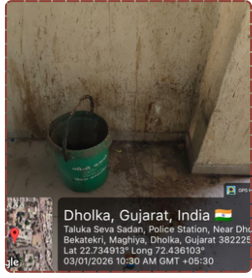
અને આજસુ તંત્ર સામે આરપારની લડાઈ લડવા તૈયાર થઈ રહી છે. તંત્રએ સત્વરે જાગીને કચેરીને નર્ક જેવી સ્થિતિમાંથી બહાર કાઢવી જોઈએ, અન્યથા ઉગ્ર આંદોલન માટે તૈયાર રહેવું પડશે. રિપોર્ટ : ભાવેશ રાહોડ

અધિકારીઓને આ ગંદકી દેખાતી નથી? કે પછી સત્તાના આસન પર બેસીને તેઓ જનતાની હાલાકી પ્રત્યે નિર્દય બની ગયા છે? સરકારી કચેરી જ્યાંથી નાગરિકોને સેવા મળવી જોઈએ, ત્યાં અત્યારે અસુવિધા અને ગંદકીનું સામ્રાજ્ય છે. આ ગંભીર બેદરકારી માત્ર અસ્વચ્છતા પૂરતી મર્યાદિત નથી, પણ જાહેર આરોગ્ય માટે મોટો ખતરો છે. લોકો સવાલ કરી રહ્યા છે કે સફાઈ પાછળ ફાળવવામાં આવતું બજેટ ક્યાં જાય છે? શું વહીવટી તંત્ર માત્ર કાગળ પર જ સફાઈના બાણગાં ફૂંકે છે? કચેરીમાં આવતા અરજદારોમાં માંદગી ફેલાવવાની પૂરેપૂરી શક્યતા છે. જો ઉચ્ચ અધિકારીઓ આ બાબતે તાત્કાલિક દખલગીરી કરીને સફાઈના કડક પગલાં નહીં ભરે, તો આ સેવા સદન ટૂંક સમયમાં રોગચાળાનું કેન્દ્ર બની જશે. ઘોળકાની જાગૃત જનતા હવે આવા નિષ્ફર