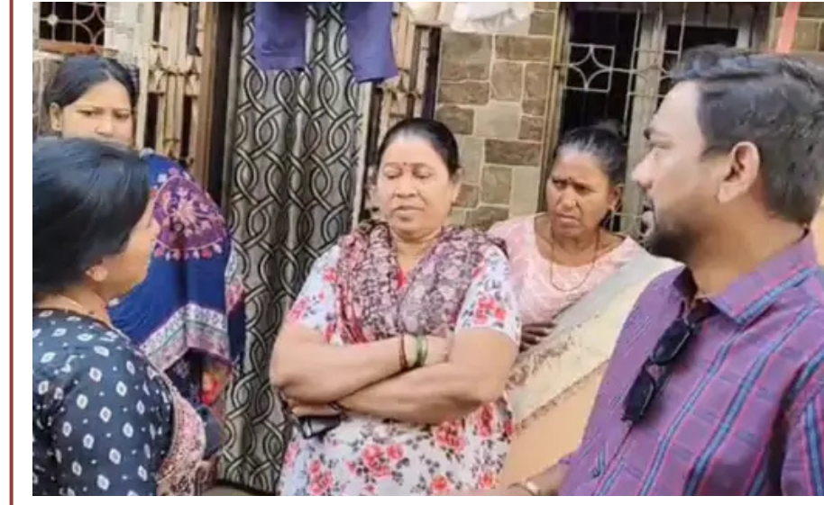
વડોદરામાં ડ્રેનેજ ચેમ્બરમાં યુવાનના મોત બાદ તંત્રમાં ફફડાટ. નવાચાર્ડમાં ૨૦ દિવસથી ખુલ્લા રાખેલા ખાડા ઉતાવળે પૂરી દેવાયા.

ગુજરાત એસ.ટી. નિગમ દ્વારા મુસાફરો માટે 'Food On Bus' સેવાની નવી પહેલ કરવામાં આવી છે. અમદાવાદથી પ્રાયોગિક ધોરણે શરૂ થનારી આ સુવિધા હેઠળ એક્સપ્રેસ બસોમાં મુસાફરો ઓનલાઈન ટિકિટ બુકિંગ વખતે જ પેકડ ફૂડનો ઓર્ડર આપી શકશે. વિમાન અને રેલવેની જેમ હવે મુસાફરોને ચાલુ બસે જ શુદ્ધ અને પૌષ્ટિક આહાર મળી રહેશે, જેનાથી લાંબી મુસાફરી વધુ સુખદ બનશે.