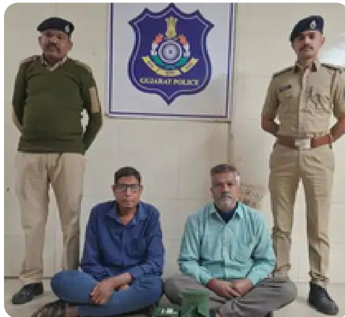
ગુજરાતમાં 'ગોગો પેપર' પર પ્રતિબંધ. સુરત, વડોદરા અને જૂનાગઢમાં પાન પાર્લરો પર કાર્યવાહી શરૂ.

પ્રોડક્ટ્સ હટાવી લેવામાં આવી છે. ગુજરાતને નશામુક્ત બનાવવાના અભિયાનમાં આ પ્રતિબંધ એક સીમાચિહ્નરૂપ સાબિત થશે, કારણ કે આ સાધનોની સરળ ઉપલબ્ધતા જ યુવાનોને નશા તરફ વાળતી હતી.