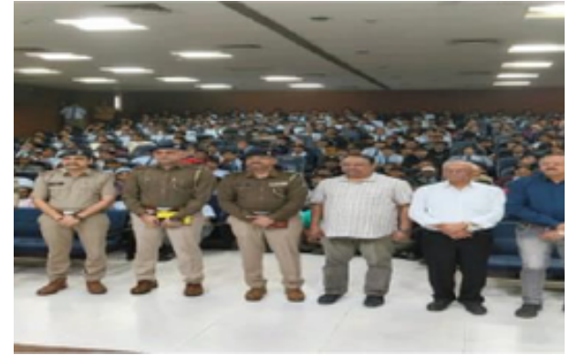
વડોદરા પોલીસનું 'સુરક્ષિત ભવિષ્ય' અભિયાન: રોઝરી સ્કૂલના બાળકોને સાયબર સેફ્ટી અને ડ્રગ્સ મુક્ત જીવનના પાઠ ભણાવ્યા

માટે ૧૧૨ ડાયલ કરવા જણાવાયું હતું. મદદનીશ પોલીસ કમિશનર ડી.જે. ચાવડાની અધ્યક્ષતામાં યોજાયેલા આ કાર્યક્રમે વિદ્યાર્થીઓમાં સુરક્ષા અને સામાજિક જવાબદારીની નવી જ્યોત જગાવી છે. શાળાના સંચાલકોએ પોલીસના આ નવતર અભિગમને બિરદાવ્યો હતો.