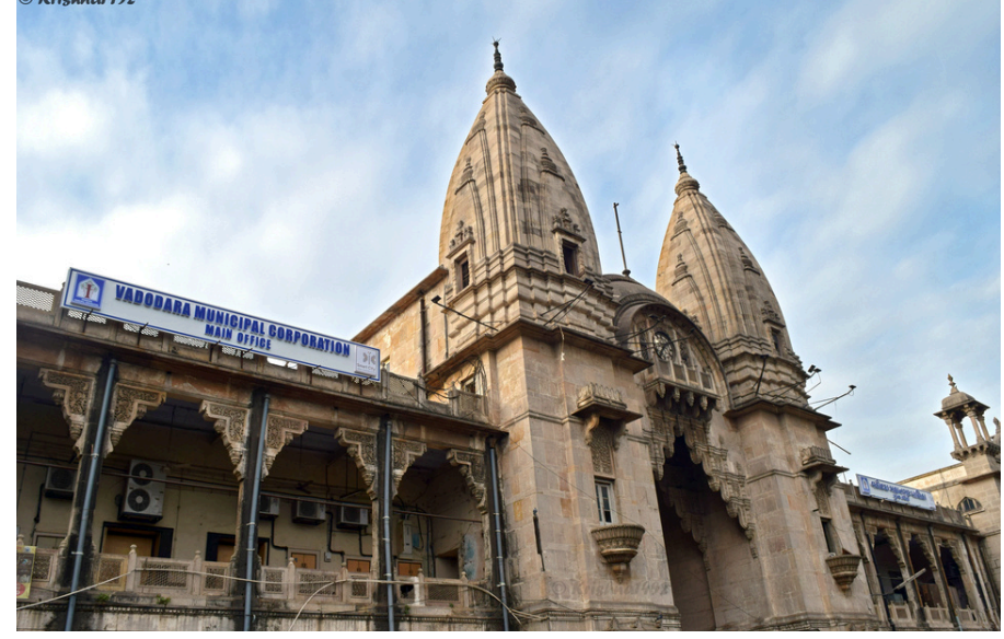
વિકાસકામ મુદ્દે કરજા મોટામાં લોહિયાળ હુમલો