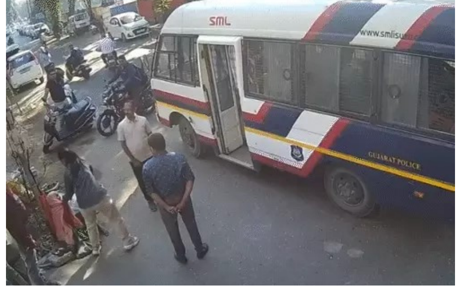
ખેંગારપુરા આયુષ્માન મંદિર બાંધકામમાં ગેરરીતિ

સુરત: ભિક્ષુક ગૃહની મહિલા કર્મચારીનું અમાનવીય વર્તન: વૃદ્ધાના કપડાં ખેંચી રસ્તા પર ઢસડી