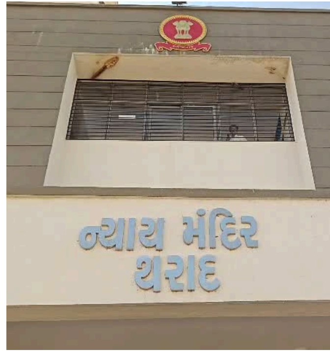
રિપોર્ટ : કિરણ ગોહેલ

કેદની સજા ફટકારી છે. સાથે જ આરોપીઓ પર ₹ ૧.૫ લાખનો દંડ પણ લગાવવામાં આવ્યો છે. કોર્ટે આ દંડમાંથી ₹ ૨ લાખની રકમ મૃતક વેપારીની પત્નીને વળતર તરીકે ચૂકવવાનો આદેશ કર્યો છે.