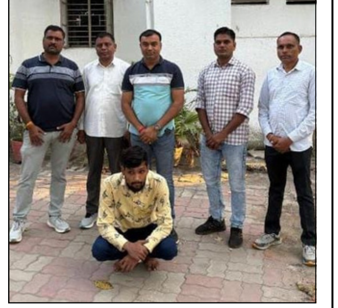
રિપોર્ટ : નરેન્દ્ર સિંહ પરમાર

મહીસાગર પેરોલ ફ્લો સ્કવોડે આ ફરાર આરોપીને ઝડપી પાડવા માટે વિશેષ ટીમની રચના કરી હતી. ટીમે અત્યાધુનિક ટેક્નિકલ સર્વેલન્સ અને ગુપ્ત માહિતીના આધારે સચોટ લોકેશન