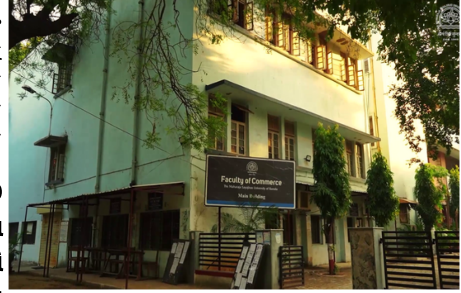
વડોદરામાં NRI મહિલાનો પર્સ ગુમ થયાનો કેસ

એમ.એસ. યુનિવર્સિટીમાં RO પાણીની ગુણવત્તા અને સર્વિસિંગ ન થતી હોવા અંગે વિદ્યાર્થીઓએ ચિંતા વ્યક્ત કરી; તંત્ર દ્વારા પગલાંની રાહ.