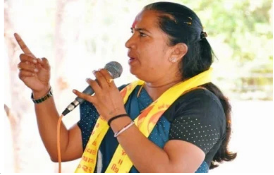
ડાંગર વેચવા ડભોઈના ખેડૂતો સંકટમાં