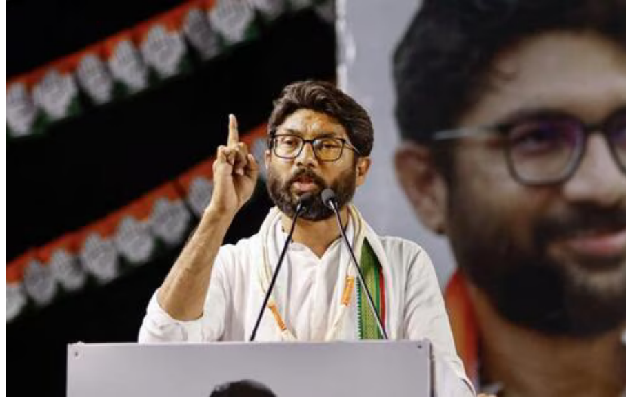
કટારીયા ચોકડી બંધ: બ્રિજનું કામ શરૂ,

લોકો આ નંબર પર દારૂ કે ડ્રગ્સના વેચાણની ગુપ્ત માહિતી આપી શકશે. આ માહિતીના આધારે મહિલા કોંગ્રેસ પોલીસને જાણ કરશે અને જો પોલીસ કાર્યવાહી નહીં કરે તો મહિલા કાર્યકરો જાતે જઈને દારૂના અડા પર રેડ કરશે. બીજી તરફ NSUI રાજ્યના 200 શૈક્ષણિક કેમ્પસમાં વિદ્યાર્થીઓને નશાથી દૂર રહેવા પ્રતિજ્ઞા લેવડાવશે. જોકે, વિરોધ પ્રદર્શનમાં ઉત્સાહી નેતાઓ ટ્રાફિક નિયમો ભૂલ્યા હતા અને હેલ્મેટ વગર બાઈક ચલાવતા કેમેરામાં કેદ થયા હતા.