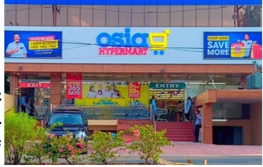
ભાભર મીઠા ગામે ૮૦૬ બોટલ દારૂ ઝડપી

વેન્ડરોના દાવા અનુસાર ઓસિયા હાયપરમાર્કેટમાં ક્રેડિટ પેમેન્ટ વિવાદ તેજ, ચેક રિટર્નની ચર્ચા; કંપનીની સત્તાવાર સ્પષ્ટતા બાકી.