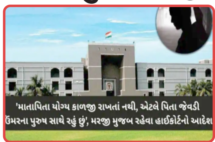
'માતાપિતા યોગ્ય કાળજી રાખતાં નથી, એટલે પિતા જેવડી ઉંમરના પુરુષ સાથે રહે' રહે, મરજી મુજબ રહેવા હાઈકોર્ટેનો આદેશ

મહેસાણા, મહેસાણાની એક ૨૩ વર્ષીય યુવતીના કેસમાં ગુજરાત હાઈકોર્ટે એક મહત્વપૂર્ણ નિર્ણય આપ્યો છે. યુવતી તેના પિતાની ઉંમરના અને એક સંતાનના પિતા સાથે ભાગી જતાં, તેના માતા-પિતાએ દીકરીને ગેરકાયદે ગોંધી રાખવામાં આવી હોવાની રજૂઆત સાથે હાઈકોર્ટેમાં હેબિયસ કોર્પસ અરજ દાખલ કરી હતી. જોકે, તેણે બધાને ચોંકાવી દીધા હતા અને અંતે કોર્ટે યુવતીને તેની મરજી મુજબ જવા આદેશ કર્યો હતો.