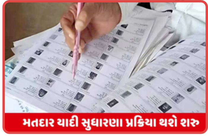
મતદાર યાદી મુદ્દારણા પ્રક્રિયા થશે શરૂ

અમદાવાદ, ઈલેક્શન કમિશનની જાહેરાત બાદ અમદાવાદ સહિત રાજ્યભરમાં સ્પેશ્યલ ઈન્ટેન્સિવ રીવિઝનની એટલે કે મતદાર યાદીના ખાસ વેરિફિકેશન ની કામગીરી શરૂ કરવામાં આવી છે ત્યારે રાજ્યભરના પ્રાથમિક સ્કૂલોના શિક્ષકોને બીએલઓ (બુથ લેવલ ઓફિસર)ની કામગીરીના ઓર્ડર થઈ ગયા છે. પરંતુ જેમાં મીટિંગમાં બીએલઓ તરીકે હાજર ન રહેનાર સામે ધરપકડ વોરન્ટ ઈશ્યુ કરવાના નિયમને લઈને શૈક્ષિક સંઘે ઉગ્ર વિરોધ નોંધાવ્યો છે. શિક્ષકોને બુથ લેવલ ઓફિસર તરીકેની સોંપાયેલી કામગીરીમાં ગેરહાજર રહે તો ધરપકડ વોરન્ટ ઈશ્યુ કરવાના નિયમને લઈને શૈક્ષિક મહાસંઘે ઉગ્ર વિરોધ નોંધાવતા આ મુદ્દે મુખ્યમંત્રીને લેખિત ફરિયાદ પણ કરી છે. શૈક્ષિક સંઘે આ નિયમ દૂર કરવા અથવા અથા બંધ કરવાની માંગ કરીને બીએલઓની