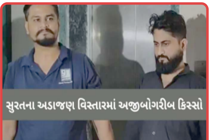
સુરતના અડાજણ વિસ્તારમાં અજીબોગરીબ કિસ્સો

સુરત, સુરત શહેરના પુણાગામ વિસ્તારમાં રહેતી યુવતી થોડા દિવસ અગાઉ જ્યાં નોકરી કરતી હતી, ત્યાં દિવાળી બોનસ લેવા માટે ગઈ હતી. આ સમયે ઓફિસમાં ઘુસી આવેલા કાકાના જમાઈ અને મિત્રોએ કાકાને બળાટકારના કેસમાં ફસાવી દેવાની ધમકી આપી તેમને ચપ્પુ બતાવી બિલ્ડર કાકાની ઓફિસમાં મુકેલા રોકડા રૂપિયા પાંચ લાખ બળજબરીથી લઈ લીધા હતા.