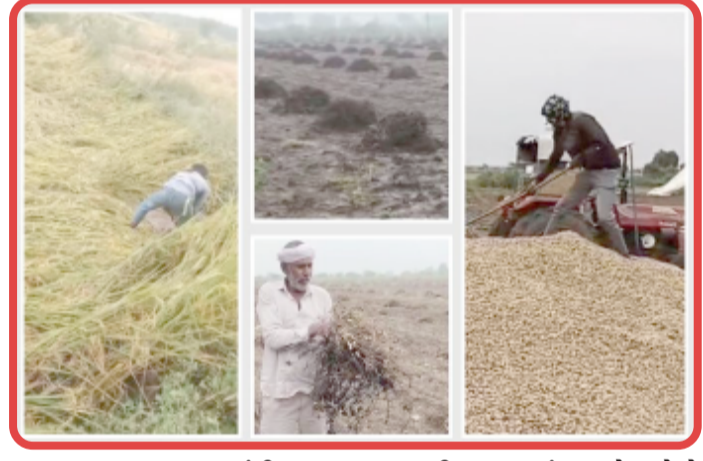
ખેડૂત દીઠ ૧૨૫ મણ પાકની ટેકાના ભાવે કરાશે ખરીદી

ગાંધીનગર, રાજ્યમાં કમોસમી વરસાદ અને મગફળીના પાકને ધ્યાને લઈ સરકાર ૮મી નવેમ્બરથી ટેકાના ભાવે ખરીદી કરશે. રાજ્ય સરકારના પ્રવક્તા મંત્રી અને કૃષિ મંત્રી જીતુ વાઘાણીએ જણાવ્યું કે મુખ્યમંત્રીએ મગફળી, અડદ, મગ અને સોયાબીનની ખરીદી માટે સાર્વજનિક રીતે ટેકાના ભાવની ખરીદીની જાહેરાત કરી હતી. SMSથી