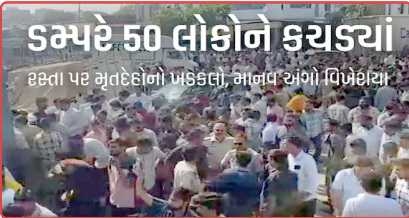
ડમ્પરે ૫૦ લોકોને કચડ્યા હતા પર મૃતદેહોનો ખડકલો માનવ અંગો વિખેરાયા

જયપુર, રાજસ્થાનના જયપુરમાં ડમ્પરે અનેક ગાડીઓને ટક્કર મારતા ૧૪ લોકોના મોત થયા છે જ્યારે ૪૦ ઈજાગ્રસ્ત છે. ઈજાગ્રસ્તોને સારવાર માટે હોસ્પિટલમાં દાખલ કરવામાં આવ્યા છે. ગંભીર ઈજાના કારણે મોતનો આંકડો હજુ પણ વધે તેવી આશંકા છે. સ્થાનિકોનો દાવો છે કે બેફામ ડમ્પર ચાલકે સૌથી પહેલા એક કારને ટક્કર મારી અને પછી અન્ય ગાડીઓને કચડતો ગયો. અકસ્માત એટલો ભીષણ હતો કે ડમ્પરના ૩૦થી ૪૦ ગાડીઓની એક બીજામાં ટક્કર થઈ. ડમ્પરની સામે જે આવ્યું તેને ટક્કર મારી અને આશરે ૫૦ લોકોને કચડી નાંખ્યા. ડ્રાઈવરે ચિક્કાર દાડૂ પીધો હોવાનો પણ દાવો છે.