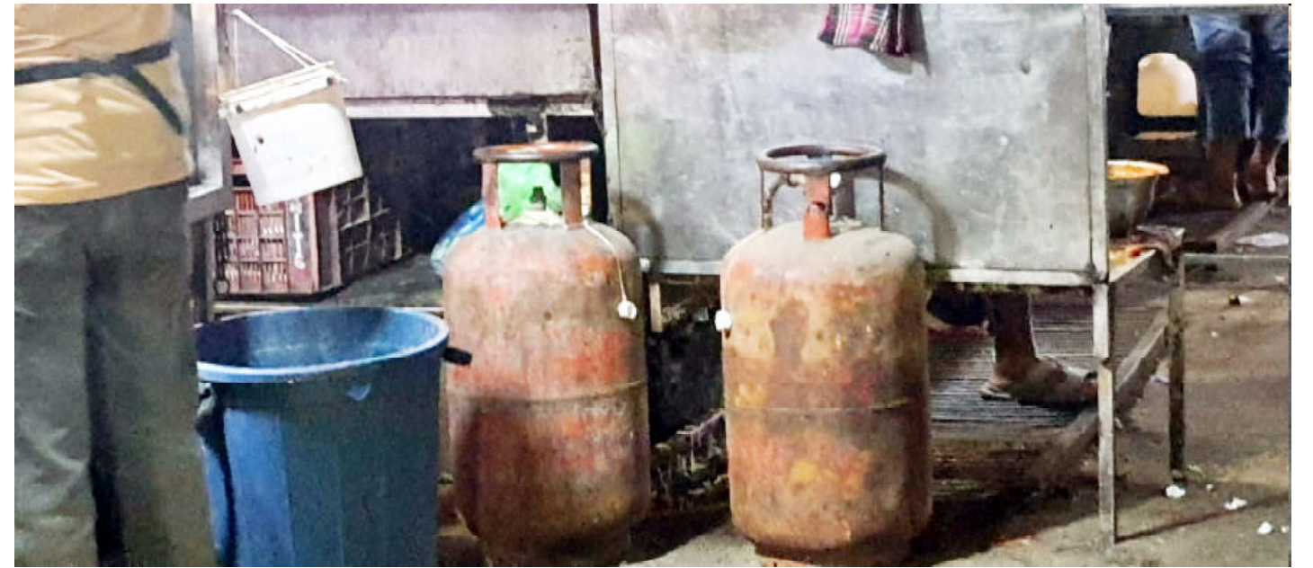
ભભૂકી રહ્યો છે. તેઓ માગ કરી રહ્યા છે કે આ મામલે ઉચ્ચસ્તરીય તપાસ થાય અને દોષિતોને કડકમાં કડક સજા મળે. શહેરમાં ચાલી રહેલો આ ગેસનો કાળોબજાર માત્ર આર્થિક નીતિઓ અને નાગરિકોના ગુનો જ નહીં, પરંતુ સરકારની અધિકારોનું પુણ ઉલ્લંઘન છે.