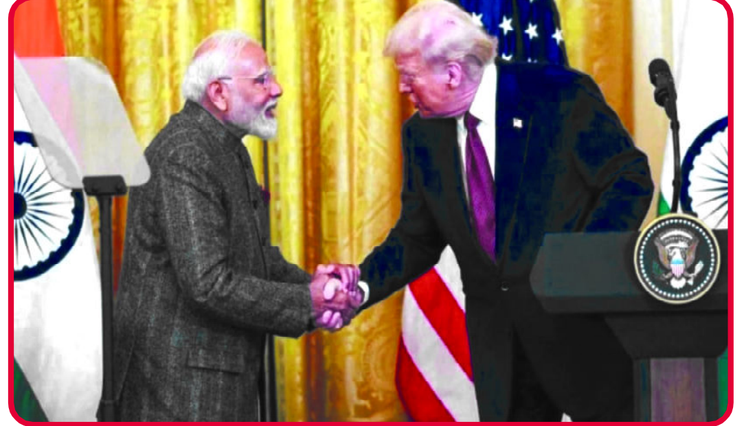
ટેરિફનો સામનો કરશે. આ સિવાય ૬૬ ટકા નિકાસ (કપડાં, ટેક્સટાઇલ, જેમ્સ-જવેલરી, કારપેટ અને ફર્નિચર પર ૫૦ ટકા ટેરિફ લાગુ થશે. જેમાં સ્પર્ધા ઘટશે. વધુમાં સ્થિતિસ્થાપક સેવાઓની નિકાસ અને વધતી જતી વૈશ્વિક વૈવિધ્યતા ટેરિફના નુકસાનમાં ઘટાડો કરી શકે છે. અમેરિકાના ટેરિફના કારણે નુકસાન થયું હોવા છતાં ભારતની એકંદર નિકાસ હજુ પણ FY ૨૬ માં ૨.૩% વધવાનો અંદાજ છે.

માટે યુએસ પર આધાર રાખે છે, જેને નુકસાન થશે. આ સિવાય ચામડું, સિરામિક્સ, કેમિકલ, હસ્તકલા અને કાર્પેટ ઉદ્યોગને પણ માટી અસર થશે. રાહલને ટેરિફના કારણે સંભવિત નુકસાનમાંથી ઉગરવા માટે નિકાસકારોને વિવિધ રાહતો આપવા ભલામણ કરી છે. જેમાં લોન ચૂકવણી પર એક વર્ષનો મોરેટોરિયમ, વ્યાજમાં ઘટાડો સહિત કેડિટ રાહતો