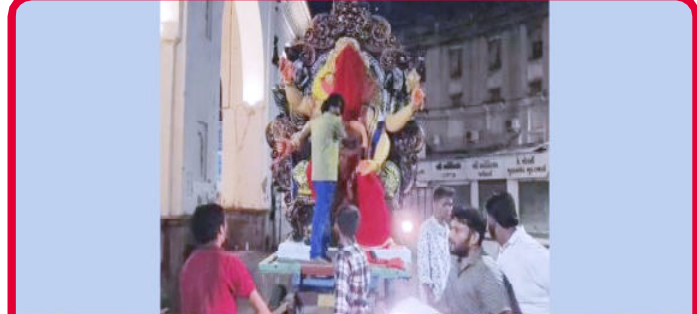
વડોદરામાં શાંતિ ઠહોળવા પ્રયાસ; ગણેશજીની મૂર્તિ પર ઇંડા ફેંકતા ભારે રોષ, ૩ શંકારપદોની અટકાયત

વડોદરા: શહેરના માંડવી વિસ્તારમાં ગણેશજીની આગમન યાત્રા દરમિયાન પ્રતિમા પર ઇંડા ફેંકવાની માંગણી કરી હતી. જોકે, કોર્ટે પોલીસની માંગણી આંશિક રીતે સ્વીકારીને ૩ દિવસના રિમાન્ડ મંજૂર કર્યા છે. આ ઘટનાએ સમગ્ર શહેરમાં તંગદિલીનો માહોલ સર્જ્યો હતો, જેથી પોલીસે તાત્કાલિક ધોરણે પગલાં લઈ આરોપીઓની ધરપકડ કરી હતી. પોલીસનો હેતુ આ ગુના પાછળના કાવતરાનો પર્દાફાશ કરવાનો અને અન્ય કોઈ વ્યક્તિ કે સંગઠનની સંડોવણી છે કે કેમ તે જાણવાનો છે. કોર્ટે દ્વારા ૩ દિવસના રિમાન્ડ મંજૂર થતાં પોલીસ હવે આરોપીઓની વધુ ઊંડાણપૂર્વક પૂછપરછ કરી કાયદેસરની કાર્યવાહી હાથ ધરશે.