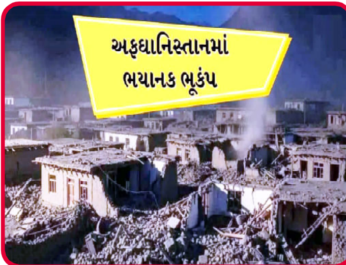
અફઘાનિસ્તાનમાં ભયાનક ભૂકંપ

સરકારની રચના પછી, આંતરરાષ્ટ્રીય સંગઠનોએ અફઘાનિસ્તાનમાં માનવતાવાદી સહાય બંધ કરી દીધી હતી. અફઘાનિસ્તાનમાં ભૂકંપ કંઈ નવું નથી. છેલ્લા કેટલાક વર્ષોમાં આ પ્રદેશમાં ઘણા મોટા ભૂકંપ આવ્યા છે. ૭ ઓક્ટોબર, ૨૦૨૩ ના રોજ, હરાત પ્રાંતમાં ૬.૩ ની તીવ્રતાનો ભૂકંપ આવ્યો હતો, જેમાં ૧,૫૦૦-૪,૦૦૦ લોકો