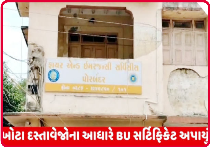
પોટા દસ્તાવેજોના આધારે BU સર્ટિફિકેટ અપાયું