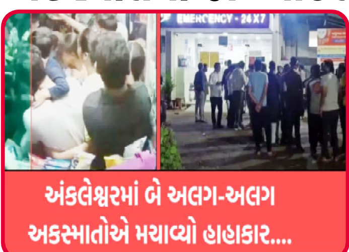
અંકલેશ્વરમાં બે અલગ-અલગ અકસ્માતોએ મર્યાવ્યા હાહાકાર....

અંકલેશ્વર, અંકલેશ્વરમાં બે અલગ અલગ અકસ્માતમાં બે વ્યક્તિઓના મૃત્યુ થયા છે. અંકલેશ્વરના ત્રણ રસ્તા શાકમર્કેટથી શાકભાજી લઈ જતા ઝગડિયાના બે લોકોની બાઈક નેશનલ હાઈવે પર કીચડને લીધે ફસાઈ ગઈ હતી અને સ્લીપ થતાં અકસ્માત થયો. હોટલ ઈન પાસે બનેલા બનાવમાં એકનું મોત થયું અને એક ઘાયલ થયો. જુના હરિપુરા ગામ