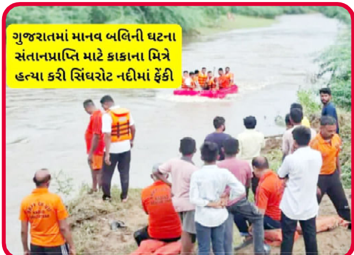
ગુજરાતમાં માનવ બલિનો કિસ્સો