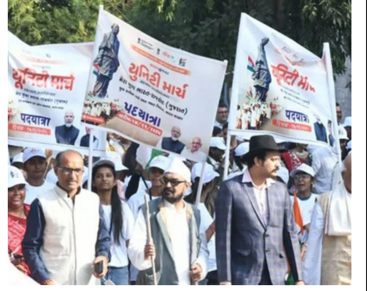
યુવા-રમતગમત વિભાગે મહત્વપૂર્ણ યોગદાન આપ્યું હતું.