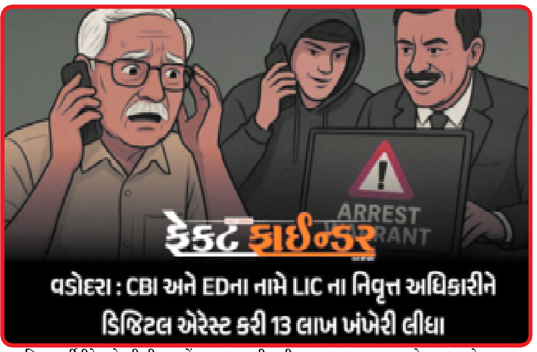
વડોદરા : CBI અને EDના નામે LIC ના નિવૃત્ત અધિકારીને ડિજિટલ એરેસ્ટ કરી 13 લાખ ખંખેરી લીધા