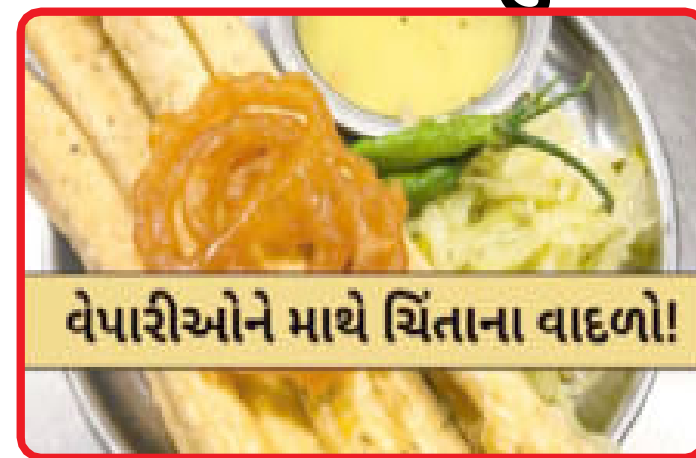
વેપારીઓને માથે ચિંતાના વાદળો!

અમદાવાદ, વિદાય લઈ રહેલા ચોમાસાએ જાણે અમદાવાદના નાગરિકો અને વેપારીઓને છેલ્લી ઘડીએ મોટી મુસીબતમાં મૂકી દીધા છે. સતત વાદળછાંચું અને વરસાદી વાતાવરણ માત્ર નવરાત્રિના ગરબાને જ નહીં, પણ દશેરાના મહત્વના તહેવાર પર પણ ગંભીર અસર કરી રહ્યું છે, ખાસ કરીને ફાફડા-જલેબીના વેપાર પર. અચાનક આવેલા આ વાદળિયાં અને વરસાદી માહોલને કારણે ફાફડા બનાવવાની કામગીરી પડતર રહી છે. વેપારીઓના જણાવ્યા અનુસાર, વાદળછાંચા વાતાવરણમાં ફાફડાની ગુણવત્તા જળવાતી નથી. આવા હવામાનમાં જો ફાફડા બનાવવામાં આવે તો તે ખાવા યોગ્ય રહેતા નથી, કારણ કે તેની સ્વાદ અને ગુણવત્તા પર મોટી અસર થાય છે. પરિણામે, આવતીકાલે દશેરો હોવા છતાં, મોટાભાગના વ્યાપારીઓને ત્યાં ફાફડા માટેની કોઈ જ આગોતરી તૈયારી જોવા મળી રહી નથી. ગત વર્ષોની સરખામણીએ આ વર્ષે વેપારીઓએ આગોતરા મોટા ઓર્ડર કે તૈયારીઓ કરી નથી. બહારથી બોલાવવામાં આવતા ફાફડાના કારીગરો પણ હજી સુધી કામ વગરના