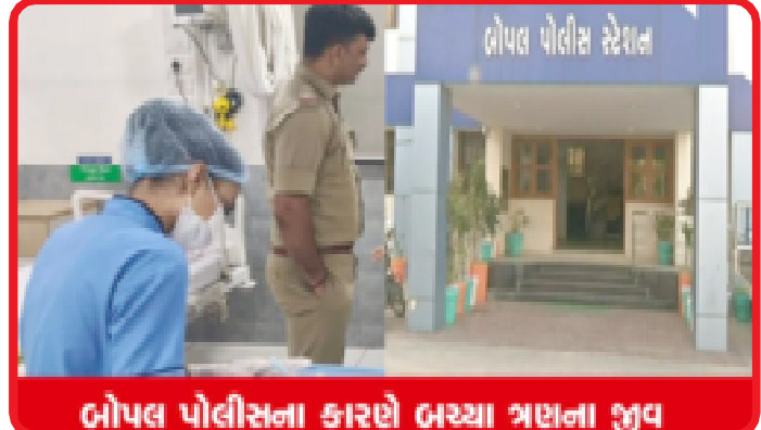
બોપલ પોલીસના કારણે બચ્યા ત્રણના જીવ

અમદાવાદ, અમદાવાદ ગ્રામ્યના બોપલ પોલીસ સ્ટેશન વિસ્તારમાં રાત્રે લગભગ બપોરે ૨ વાગ્યે એક ઘટના બની હતી. દેવદર્શન એપાર્ટમેન્ટ નજીક પેટ્રોલિંગ દરમિયાન બોપલ પોલીસને રસ્તા કિનારે કંઈક અજીબ લાગ્યું હતું. રસ્તા પર એક સ્ત્રી બેસીને આકંઠ કરી રહી હતી. તેની બાજુમાં અંદાજે ૧૧ વર્ષનો દીકરો રડી રહ્યો હતો. તેના ખોળામાં પતિ બેભાન હાલતમાં પડ્યા હતા. દ્રશ્ય અત્યંત કરુણ લાગતું હતું. ભય, નિરાશા અને નિષ્ણાભ લાગણી એકસાથે છલકાતી હતી. આ દ્રશ્ય જોઈને પોલીસ તાત્કાલિક દોડી ગઈ હતી. જાણકારી મળી કે ઘરમાં ઝગડો થતા પતિ-પત્નીએ ઝેર પીધું હતું. બાળક, નાનો હોવાના કારણે કંઈ સમજીતો નહોતો, ફક્ત મદદ માટે વિનંતી કરતો હતો. એક શણ પણ ન ગુમાવતાં પોલીસ તાત્કાલિક કામગીરીએ લાગી. એક અધિકારીએ બેભાન