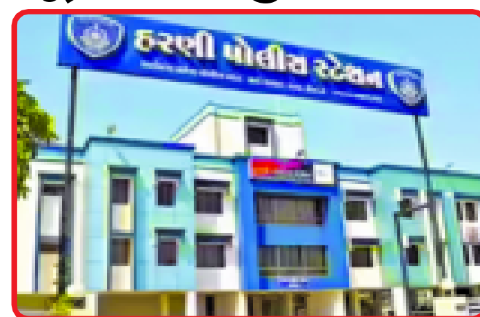
વડોદરા, વડોદરા નજીક દરજીપુરા બ્રિજ પાસે ગઈકાલે પરોઢીયે પાવાગઢના બે દર્શનાર્થીઓને લૂંટી લેવાનું બનાવ બનતા પોલીસે ચાર લૂંટારાની તપાસ હાથ ધરી છે.

પર બેસી જાવ આગળ છોડી દઈશું અને ૫૦ રૂપિયા આપી દેજો તેમ કહ્યું હતું. જેથી અમે બંને તેમની સાથે બેસી ગયા હતા.