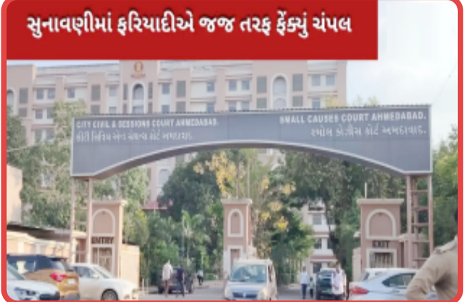
સુનાવણીમાં ફરિયાદીએ જજ તરફ ફેંક્યું ચપ્પલ

ફરિયાદીની સ્થાનિક પોલીસને જાણ કરી અટકાયત કરાઈ