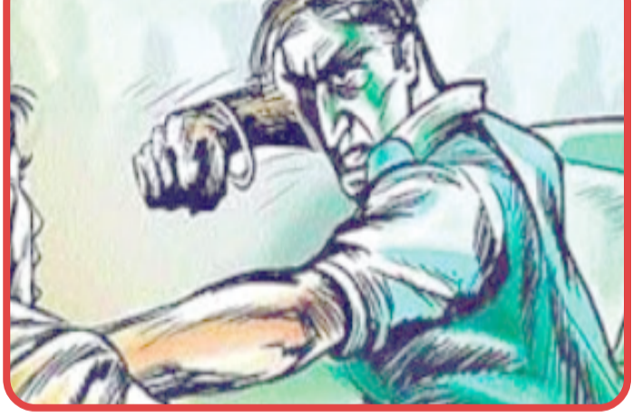
અમદાવાદ, દિવાળી ટાણે શહેરની કાલુપુર, ખાડિયા અને હવેલી પોલીસના નાક નીચે રિક્ષાચાલકના સ્વાંગમાં ફરતા લૂંટારુઓ ફરી એક વાર સક્રિય બન્યા છે. એક આધેડ સેલ્સમેન રિક્ષા સ્ટેન્ડ પર ઊભા હતા ત્યારે એક શપ્તે તેમની પાસે આવ્યો હતો. તેણે આધેડને મોબાઈલથી રિક્ષા શપ્તે કરાવી આપવાનું કહેતા આધેડે મનાઈ કરી હતી. જેથી શપ્તે ઉશ્કેરાઈને આધેડના બિસ્સામાંથી ફોન અને રોકડા લૂંટી લીધા હતા. બાદમાં લાફો મારીને વધુ કંઈ હોય

દિવાળી ટાણે રિક્ષાચાલકના સ્વાંગમાં ફરતા ગઠિયા પોલીસના નાક નીચે સક્રિય - કાલુપુર, ખાડિયા, હવેલી વિસ્તાર ગુનેગારોનો સોફ્ટ ટાર્ગેટ