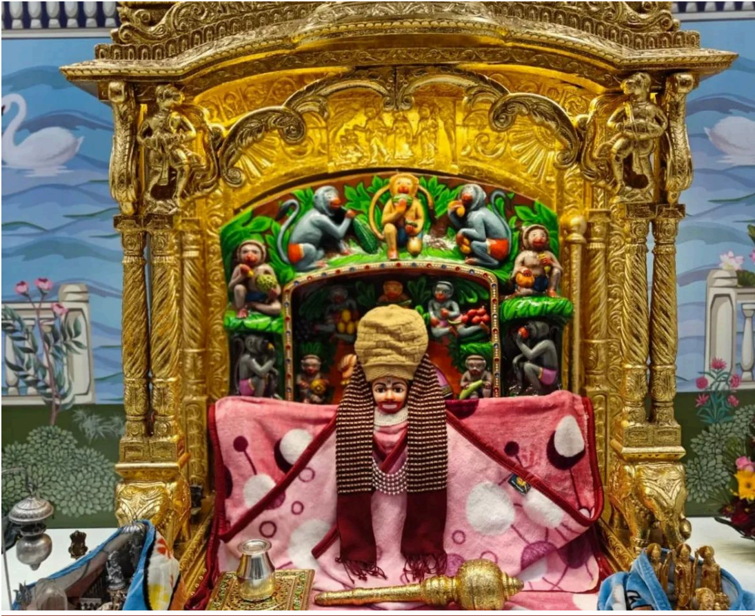
'સબ સુખ લહે તુમહારી સરના, તુમ રક્ષક કાહુ કો ડરના'