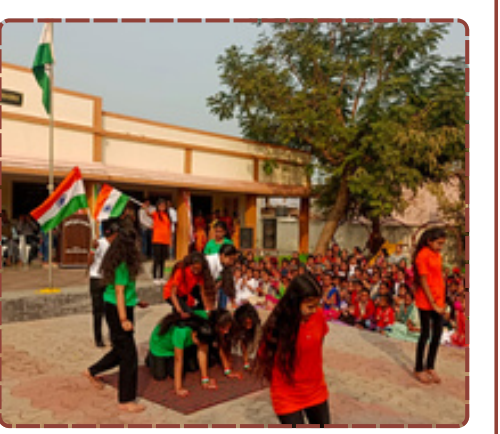
લીમલીમાં માય ભારત અને સ્થાનિક શાળાના સંયુક્ત ઉપક્રમે પ્રજાસત્તાક પર્વની ઉજવણી. ૮૦ બાળકોએ સાંસ્કૃતિક કાર્યક્રમોમાં ભાગ લીધો.

એકબીજાને પ્રજાસત્તાક પર્વની શુભેચ્છાઓ પાઠવી હતી. મોટી સંખ્યામાં ગ્રામજનો અને વાલીઓએ હાજર રહી બાળકોનો ઉત્સાહ વધાર્યો હતો. રિપોર્ટ : ડી.જી.જાડેજા