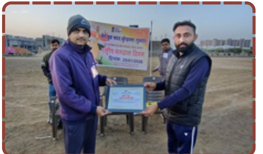
સુરેન્દ્રનગરમાં 'માય ભારત' દ્વારા રાષ્ટ્રીય મતદાતા દિવસની ભવ્ય ઉજવણી કરાઈ હતી. "માય ભારત, મારું મત" સંદેશ સાથે યુવાઓને મતદાન પ્રક્રિયામાં જોડવા પદયાત્રા અને સંવાદ યોજાયા હતા. પ્રથમ વખત મતદાન કરનાર યુવાઓએ ઉત્સાહભરે ભાગ લઈ લોકશાહીના શપથ લીધા હતા.

નાગરિકત્વની ભાવના જગાડવામાં એક સીમાચિહ્ન રૂપ સાબિત થયો હતો. સુરેન્દ્રનગરના યુવાઓએ આ પહેલને બહોળો પ્રતિસાદ આપીને લોકશાહી પ્રત્યેની પોતાની કટિબદ્ધતા દર્શાવી હતી. ડી.જી.જાડેજા