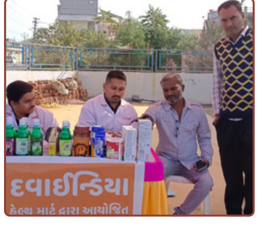
હેલ્થ માર્ટ દ્વારા આયોજિત