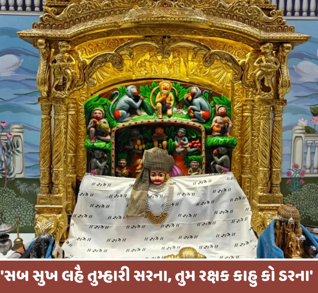
'સબ સુખ લહે તુમહારી સરના, તુમ રક્ષક કાહુ કો ડરના'