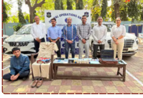
વડોદરાના તાંદલજામાં નકલી PSI મોબીન સોદાગર ઝડપાયો. ખાખી વર્દી, એરગન અને સરકારી સિક્કાઓનો ઉપયોગ કરી કરતો હતો લાખોની ઠગાઈ.

કરી રહી છે કે અત્યાર સુધી તેણે કેટલા લોકોને પોતાનો શિકાર બનાવ્યા છે અને તેની પાસે આટલા બધા લોકોના ઓરિજિનલ દસ્તાવેજો ક્યાંથી આવ્યા.