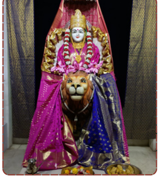
ભરૂચમાં ૩૧ જાન્યુઆરીએ મા મોઢેશ્વરીનો રફમો પાટોત્સવ ઉજવાશે. આનંદનો ગરબો, ભવ્ય શોભાયાત્રા અને મહાપ્રસાદનું વિશેષ આયોજન કરાયું છે.

તમામ માઈભક્તોને આ દિવ્ય અવસરમાં ઉમટી પડવા ખાસ અનુરોધ કરવામાં આવ્યો છે. રિપોર્ટ : કેતન મહેતા