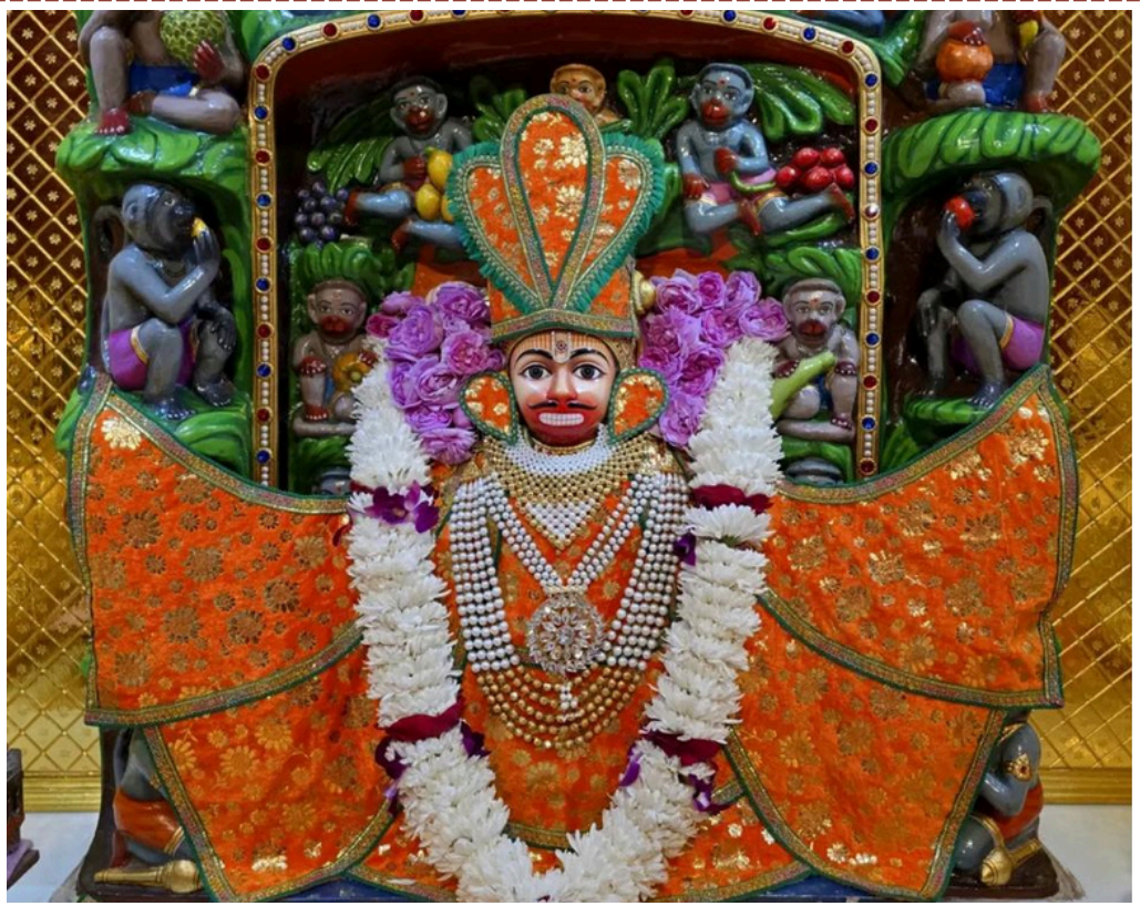
'સબ સુખ લહે તુમ્હારી સરના, તુમ રક્ષક કાહુ કો કરના'

નથી. અધિકારીઓએ જણાવ્યું કે આ દુકાન છેલ્લા ત્રણ મહિનાથી લાયસન્સ વિના કાર્યરત હતી. નિયમ મુજબ ખાદ્ય ચીજવસ્તુઓના વેચાણ માટે લાયસન્સ અનિવાર્ય છે, જેનો અહીં અભાવ જણાતા દુકાન બંધ કરાવવામાં આવી છે. તંત્રએ સ્પષ્ટ કર્યું છે કે જ્યાં સુધી દુકાનધારક લાયસન્સ મેળવીને ફૂડ સેફ્ટીના તમામ નિયમોનું પાલન નહીં કરે ત્યાં સુધી દુકાન બંધ જ રહેશે.