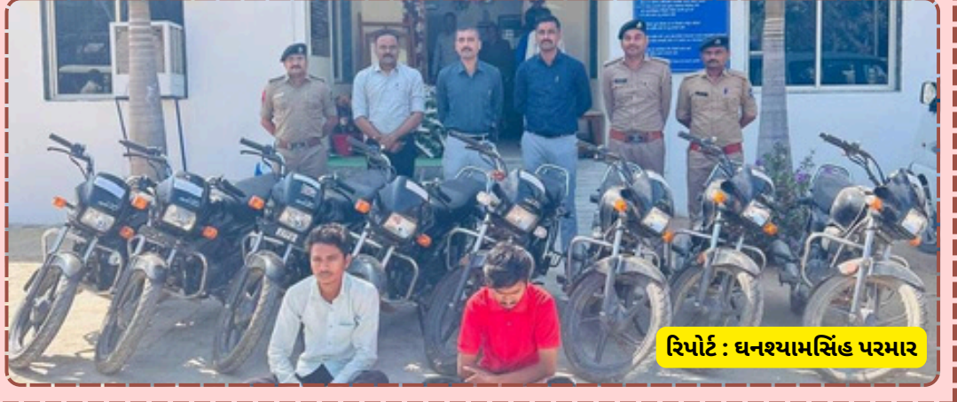
રિપોર્ટ : ધનશ્યામસિંહ પરમાર

સાબરકાંઠા એસઓજીએ ઇડર બાયપાસ રોડ પર ઇલોલ ચોકડી પાસેથી એક ઈકો કાર અટકાવી હાઇબ્રિડ ગાંજો અને ચરસ સહિતનો નશીલો પદાર્થ ઝડપી પાડ્યો છે. પોલીસે કુલ ₹5.74 લાખનો મુદ્દામાલ જપ્ત કરી બે શખ્સોની ધરપકડ કરી છે, જ્યારે વિજાપુરનો એક શખ્સ વોન્ટેડ જાહેર કરાયો છે.