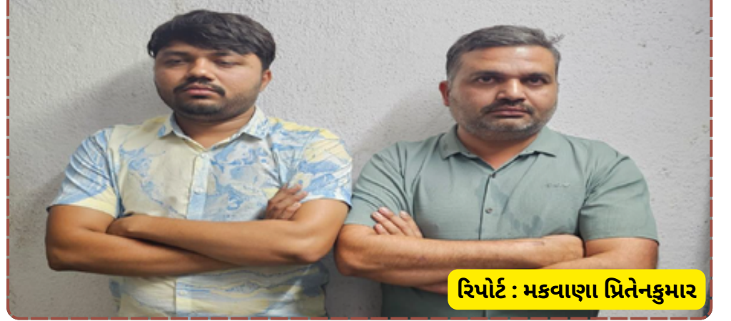
રિપોર્ટ : મકવાણા પ્રિતેનકુમાર

અલગ-અલગ ગુના નોંધી વધુ તપાસ શરૂ કરી છે. આરોગ્ય સાથે સંકળાયેલી સંસ્થામાં આ પ્રકારની ગેરકાયદે પ્રવૃત્તિ પકડાતા ચક્ર્યાર મચી ગઈ છે.