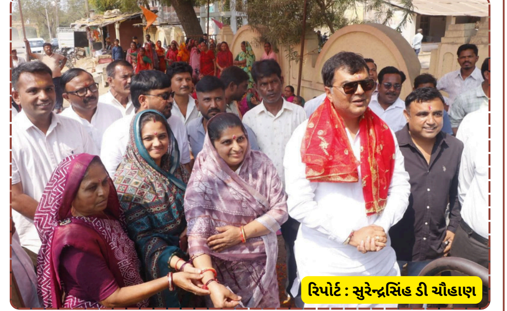
રિપોર્ટ : સુરેન્દ્રસિંહ ડી ચૌહાણ

ગ્રામ પંચાયતના સભ્યો અને મોટી સંખ્યામાં ગ્રામજનો હાજર રહ્યા હતા. નવીન ડામર રસ્તાની કામગીરી ટૂંક સમયમાં શરૂ કરવામાં આવશે, જે પૂર્ણ થતાં વાહનવ્યવહાર સુગમ અને સલામત બનશે. ગ્રામજનોએ આ વિકાસ કાર્યને વધાવ્યું હતું.