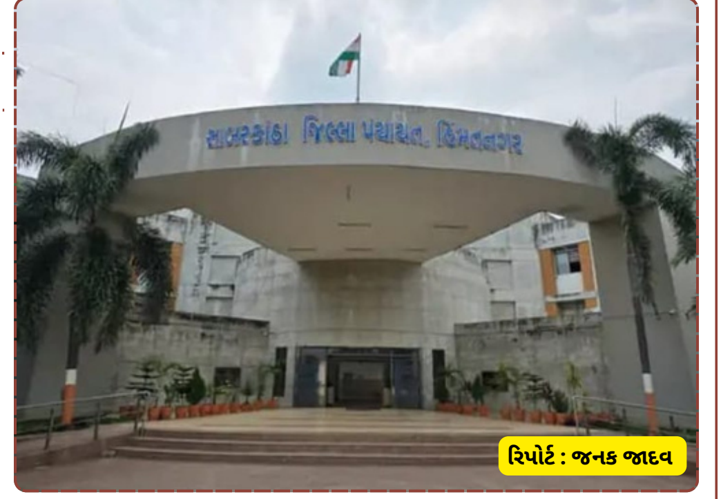
રિપોર્ટ : જનક જાદવ

યોજનાઓમાં વિલંબ ન થાય તે માટે આ ફેરફારો કરવામાં આવ્યા છે. આગામી દિવસોમાં નવા નિમણૂક પામેલા અધિકારીઓ પોતાનો પદભાર સંભાળશે. સાબરકાંઠા જિલ્લા પંચાયત હસ્તકની આ ત્રણેય તાલુકા પંચાયતોમાં હવે નવા વહીવટી વડાઓ આવવાથી સ્થાનિક સ્તરે અટવાયેલા પ્રશ્નોનો નિકાલ આવશે તેવી આશા ગ્રામજનો સેવી રહ્યા છે. સરકારે તમામ બદલી પામેલા અધિકારીઓને સત્વરે પોતાની નવી ફરજ પર હાજર થવા કડક સૂચના આપી છે.