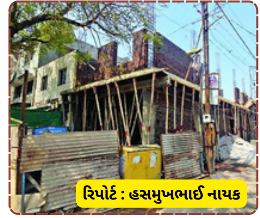
રિપોર્ટ : હસમુખભાઈ નાયક

બાંધકામ ભાજપની 'ઝીરો ટોલરન્સ' નીતિના લીરેલીરા ઉડાવી રહ્યું છે. આ કૌભાંડ સામે આવતા હવે ભાજપ હાઈકમાન્ડ મેયર સામે શું કાર્યવાહી કરે છે તેના પર સૌની મીટ મંડાયેલી