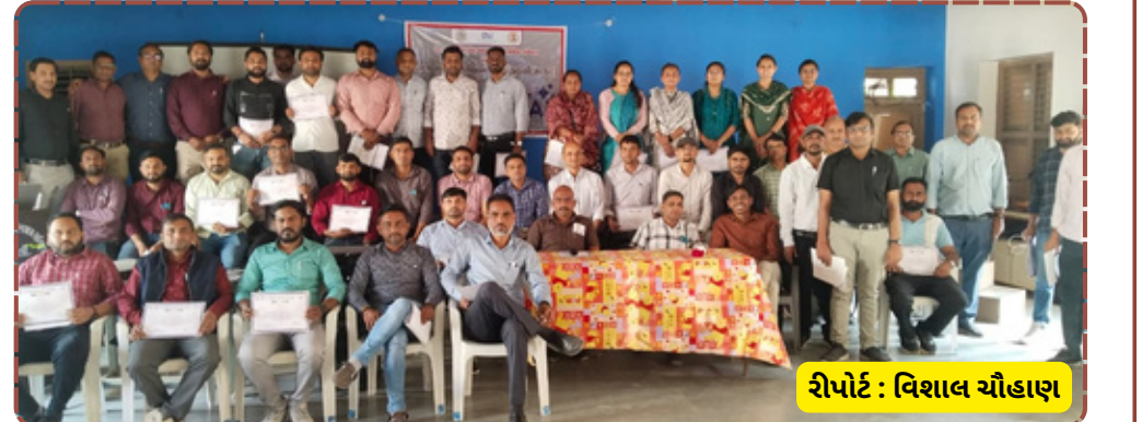
રિપોર્ટ : વિશાલ ચૌહાણ

જિલ્લાના શિક્ષકો ટેકનોલોજીના માધ્યમથી વિદ્યાર્થીઓને વધુ સારી રીતે શિક્ષણ આપી શકશે. કાર્યક્રમના સમાપન સમયે સહભાગીઓને પ્રમાણપત્રો આપી પ્રોત્સાહિત કરવામાં આવ્યા હતા.