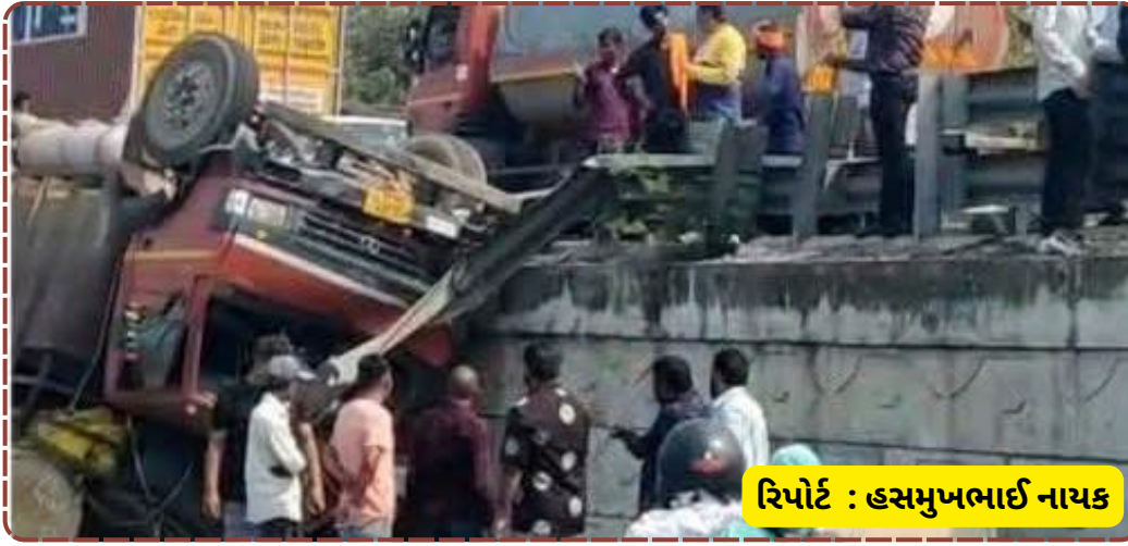
રિપોર્ટ : હસમુખભાઈ નાયક

મદદથી ટ્રકને ખસેડવાની અને વધુ તપાસ કરવાની તજવીજ હાથ ધરી રહી છે. સદનસીબે, કોઈ મોટી જાનહાનિના સમાચાર હજુ સુધી પ્રાપ્ત થયા નથી, જે મોટી રાહતની વાત છે.