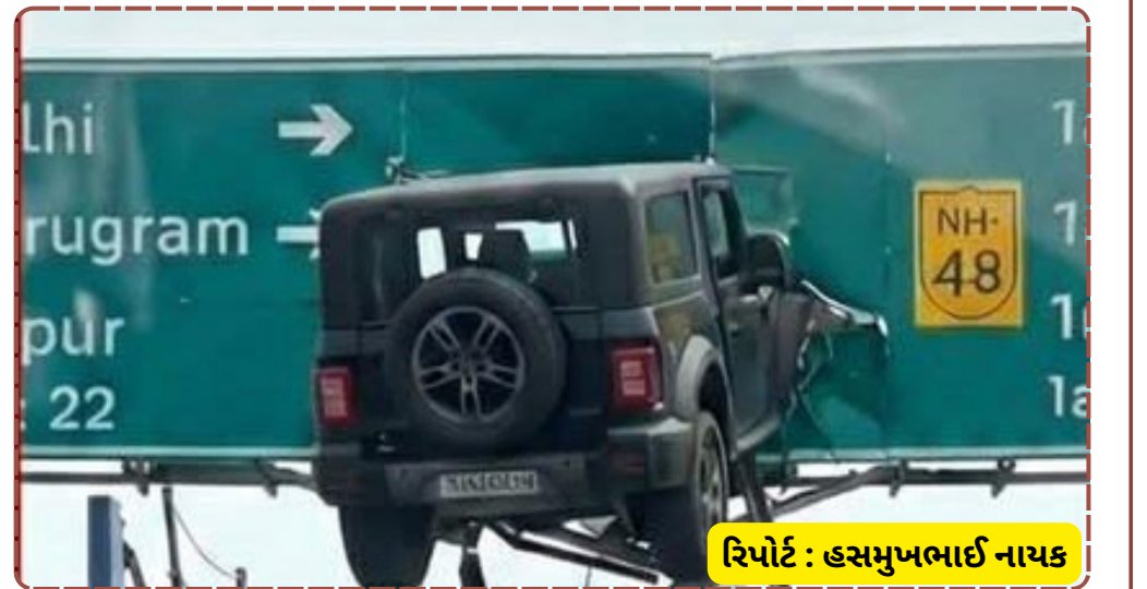
રિપોર્ટ : હસમુખભાઈ નાયક

લોકો આ ઘટનાના ફોટા અને વીડિયો સોશિયલ મીડિયા પર શેર કરી રહ્યા છે. હાઈવે પર વધુ પડતી ઝડપ કેવી રીતે જોખમી બની શકે છે અને અણધાર્યા અકસ્માતો સર્જી શકે છે તેનું આ એક જીવંત ઉદાહરણ છે.