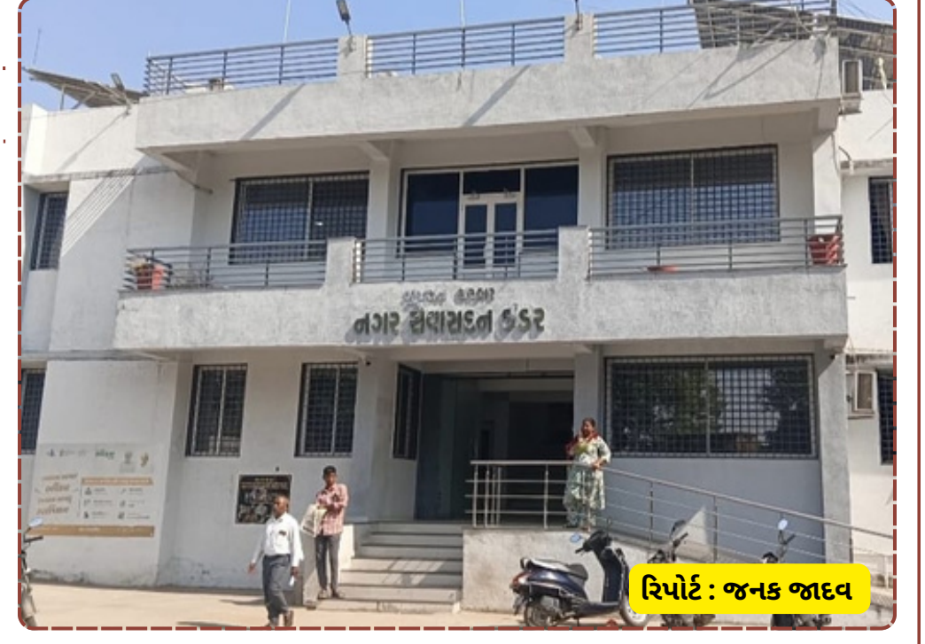
રિપોર્ટ : જનક જાદવ

નગરપાલિકા તંત્ર દ્વારા ઇડર શહેર તેમજ તાલુકાના તમામ નાગરિકોને આ સ્વદેશી મેળામાં પધારવા અને સ્થાનિક કલાકારોને પ્રોત્સાહિત કરવા અપીલ કરવામાં આવી છે. આ મેળાથી માત્ર વેપાર જ નહીં, પરંતુ આપણી પરંપરાગત કળાઓને પણ જીવંત રાખવામાં મદદ મળશે. 10 દિવસ સુધી ચાલનારા આ શોપિંગ ફેસ્ટિવલમાં ખાણી-પીણીના સ્ટોલ અને બાળકો માટે મનોરંજનના સાધનો પણ ઉપલબ્ધ રહે તેવી શક્યતા છે, જેનાથી સમગ્ર વાતાવરણ ઉત્સવમય બની રહેશે.