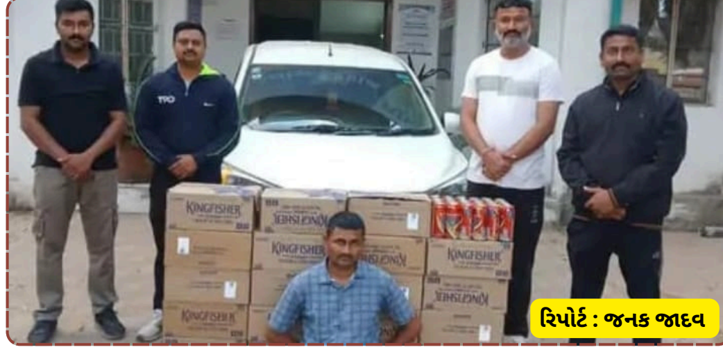
રિપોર્ટ : જનક જાદવ

પ્રોહિબિશન એક્ટ હેઠળ ગુનો દાખલ કરવામાં આવ્યો છે. પોલીસ હવે એ દિશામાં તપાસ કરી રહી છે કે આ નેટવર્કમાં અન્ય કયા મોટા માથાઓ સંડોવાયેલા છે. હાઈવે પર પેટ્રોલિંગ વધારીને આવી ગેરકાયદેસર પ્રવૃત્તિઓ ડામવા માટે તંત્ર સજ્જ બન્યું છે.