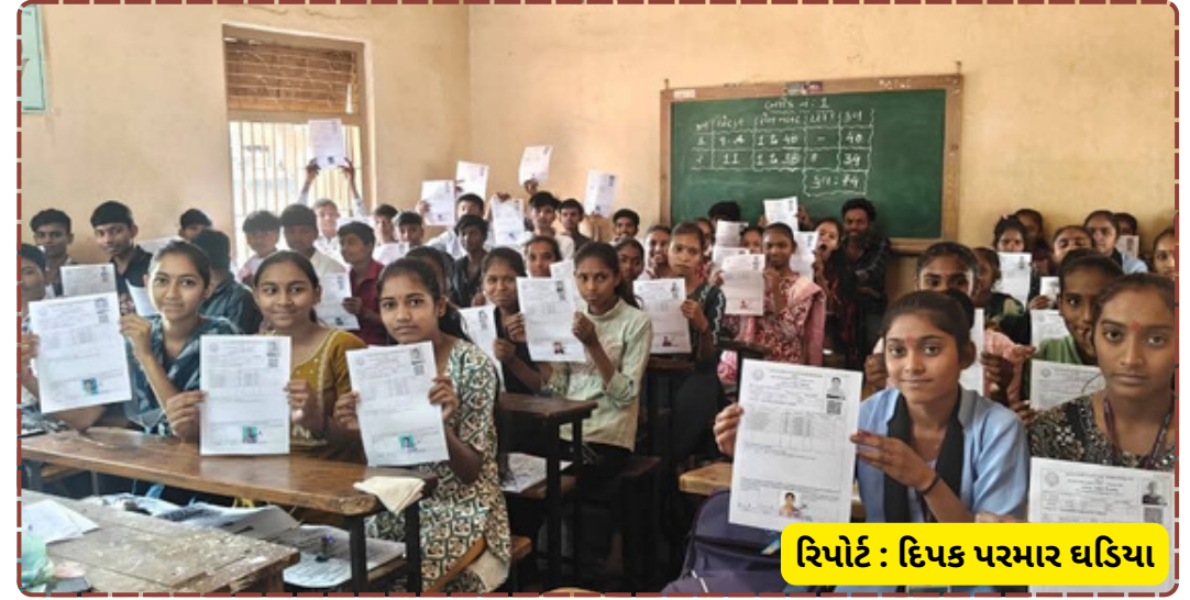
રિપોર્ટ : દિપક પરમાર ઘડિયા

દૈનિક પલ્સ સમાચાર: કપડવંજ તાલુકાના ઘડિયા ગામની શૈક્ષણિક સંસ્થા શ્રી વહાણવટી હાઈસ્કુલમાં આજે બોર્ડના વિદ્યાર્થીઓ માટે એક યાદગાર વિદાય સમારંભ યોજાયો હતો. ધોરણ 10 અને ધોરણ 12ના વિદ્યાર્થીઓ જેમના માટે આગામી 26 ફેબ્રુઆરીથી બોર્ડની પરીક્ષાઓ શરૂ થવા જઈ રહી છે, તેમને પ્રોત્સાહન પૂરું પાડવા અને શુભેચ્છાઓ આપવા માટે આ વિશેષ કાર્યક્રમનું આયોજન કરવામાં આવ્યું હતું. કાર્યક્રમની શરૂઆતમાં શાળાના શિક્ષકોએ વિદ્યાર્થીઓને પરીક્ષામાં કેવી રીતે લખવું, પ્રશ્નપત્રને કેવી રીતે સમજવું અને સમય મર્યાદામાં ઉત્તરો કેવી રીતે પૂર્ણ કરવા તે અંગે વિસ્તૃત માર્ગદર્શન આપ્યું હતું. શાળાના આચાર્યએ પોતાના ઉદબોધનમાં જણાવ્યું હતું કે, વિદ્યાર્થીઓએ વર્ષ દરમિયાન જે મહેનત કરી છે, તેને હવે કાગળ પર ઉતારવાનો સમય આવી ગયો છે. તેમણે દરેક વિદ્યાર્થીને શાંત રહીને પોતાનું સર્વોત્તમ પ્રદર્શન કરવા અપીલ કરી હતી. આ પ્રસંગે વિદ્યાર્થીઓએ પણ પોતાના અનુભવો શેર કર્યા હતા અને શાળાના શિક્ષકો દ્વારા મળેલા જ્ઞાન બદલ આભાર વ્યક્ત કર્યો હતો. શાળા પરિવાર દ્વારા વિદ્યાર્થીઓને બોર્ડની પરીક્ષામાં ઝળહળતું પરિણામ લાવવા અને કારકિર્દીના નવા શિખરો સર કરવા માટે હૃદયપૂર્વકના આશીર્વાદ આપવામાં આવ્યા હતા. સમગ્ર કાર્યક્રમ દરમિયાન વાતાવરણમાં એક તરફ વિદાયની ગમગીની હતી, તો બીજી તરફ સફળતા મેળવવાની પ્રબળ ઈચ્છાશક્તિ દેખાતી હતી. અંતમાં, દરેક વિદ્યાર્થીને શુભેચ્છા કીટ અને મીઠું મોઢું કરાવી શાળામાંથી વિદાય આપવામાં આવી હતી. શ્રી વહાણવટી હાઈસ્કુલના આ સુંદર પ્રયાસથી વિદ્યાર્થીઓનો આત્મવિશ્વાસ બમણો થયો છે અને તેઓ હવે પૂરા જોશ સાથે બોર્ડની પરીક્ષા આપવા માટે સજ્જ થયા છે. આ કાર્યક્રમની સફળતા પાછળ શાળાના સમગ્ર સ્ટાફ અને સંચાલક મંડળનો મહત્વનો ફાળો રહ્યો હતો.