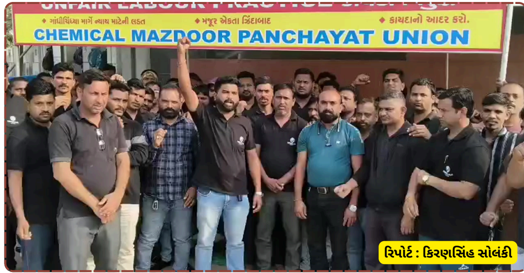
રિપોર્ટ : કિરણસિંહ સાંબલી

સમજાવટ શરૂ કરી છે, પરંતુ ન્યાય ન મળે ત્યાં સુધી કામદારો હટવા તૈયાર નથી. શું તંત્ર આ મનસ્વી કંપની સામે કોઈ કડક પગલાં લેશે કે પછી શ્રમિકોનું શોષણ ચાલુ જ રહેશે?