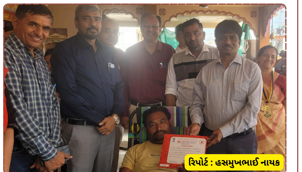
રિપોર્ટ : હસમુખભાઈ નાયક

વિભાગ દ્વારા સ્વૈચ્છિક સંગઠનોના સહયોગથી ગામેગામ આવા કેમ્પોનું આયોજન થઈ રહ્યું છે. રક્તદાનના આ ભગીરથ કાર્યમાં જિલ્લાના યુવાનો અને જાગૃત નાગરિકોનો સહયોગ સતત વધી રહ્યો છે.