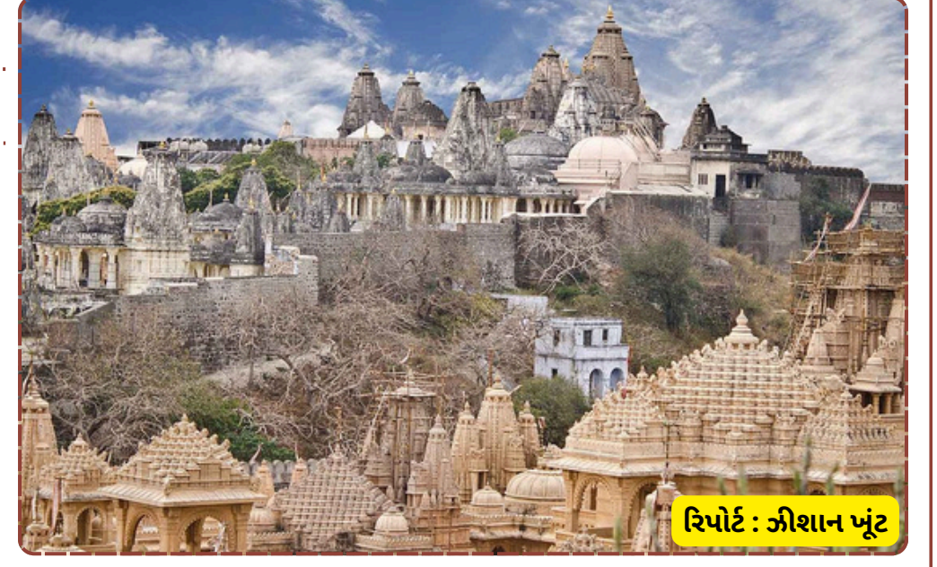
રિપોર્ટ : જીશાન ખંટ

સલોતે જણાવ્યું છે કે બહારગામથી આવતા અને સ્થાનિક તમામ યાત્રિકો માટે સલોત ભવન ખાતે રહેવા તથા ભોજનની સુંદર વ્યવસ્થા કરવામાં આવી છે. આ યાત્રામાં જોડાવવા ઈચ્છતા શ્રદ્ધાળુઓ વધુ માહિતી કે રજીસ્ટ્રેશન માટે ફોન નંબર 93203 87227 પર સંપર્ક કરી શકે છે. ફાગણ મહિનાની આ પવિત્ર યાત્રામાં હજારો જૈન શ્રાવક-શ્રાવિકાઓ ઉમટી પડશે તેવી શક્યતા છે, જેને પગલે તીર્થધામ પાલીતાણામાં ભક્તિમય માહોલ સર્જાશે.