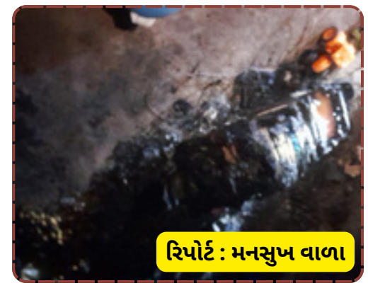
રિપોર્ટ : મનસુખ વાળા

વેઠવાનો વારો આવ્યો છે. પત્રકારત્વના નજરે જોઈએ તો, વીજ કંપનીઓના નબળા મેન્ટેનન્સ અને જર્જરિત વાયરિંગને કારણે સામાન્ય જનતાએ પોતાના ઘર ગુમાવવાનો વારો આવે છે. લગ્નની ખુશીઓ વચ્ચે શામજીભાઈના પરિવાર પર દુ:ખના પહાડ તૂટી પડ્યા છે. શું તંત્ર આ ગરીબ પરિવારને થયેલા નુકસાનનું વળતર આપશે કે પછી માત્ર તપાસના નામે ફાઈલો દબાવી દેવામાં આવશે?