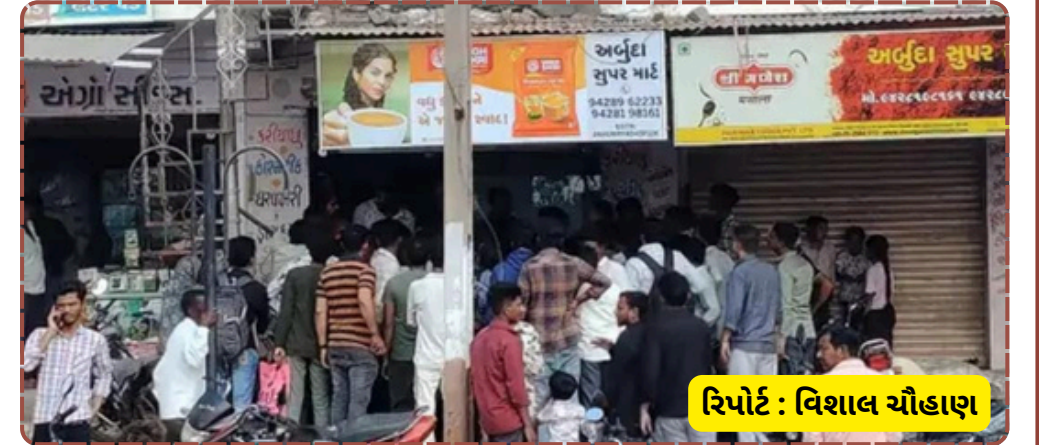
રિપોર્ટ : વિશાલ ચૌહાણ

અભાવ આશ્ચર્ય જન્માવે છે. શું વડાલીમાં દીકરીઓ પોતાની નોકરીના સ્થળે પણ સુરક્ષિત નથી? આ મામલે હવે લોકો કડક કાર્યવાહીની આતુરતાથી રાહ જોઈ રહ્યા છે.