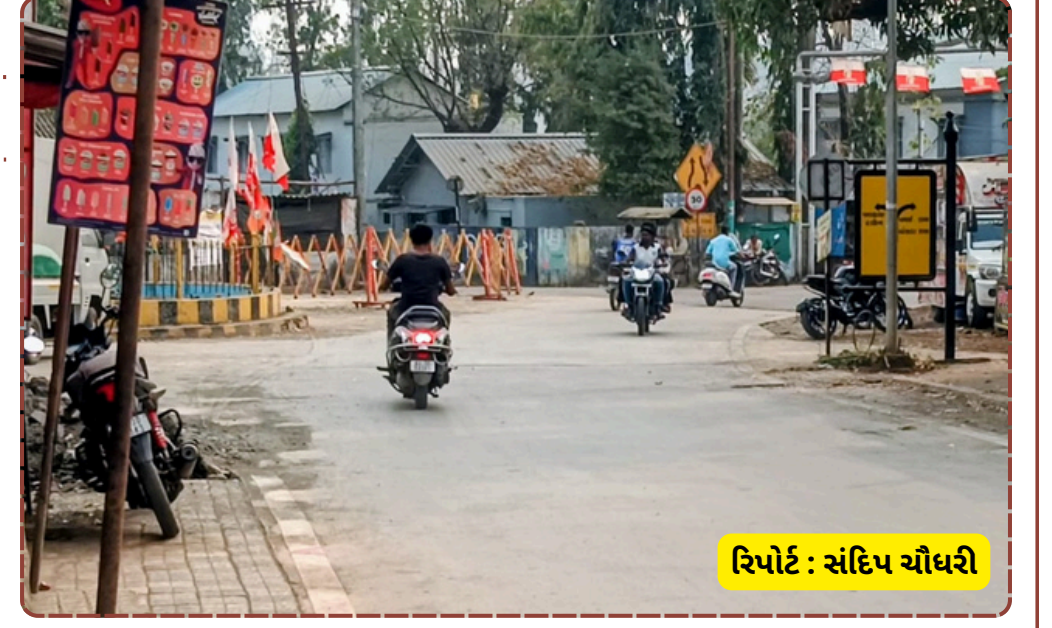
રિપોર્ટ : સંદિપ ચૌધરી

નાગરિકોએ હવે સોશિયલ મીડિયા અને પત્રો દ્વારા તંત્રને જગાડવાનો પ્રયાસ કર્યો છે. પ્રજાની માંગ છે કે પ્લોટને અન્યત્ર ખસેડી રસ્તો ખુલ્લો રાખવામાં આવે અને ટ્રાફિક નિયમન માટે વૈકલ્પિક આયોજન કરવામાં આવે. હવે જોવાનું એ રહેશે કે લોકશાહીમાં તંત્ર પ્રજાના અવાજને સાંભળે છે કે પછી પોતાની જિદ પર અડી રહીને કોઈ મોટી દુર્ઘટનાને નિમંત્રણ આપે છે. ડાંગ દરબારની ગરિમા અને માનવીય મૂલ્યો વચ્ચે હવે વહીવટી તંત્રની કસોટી થવાની છે.