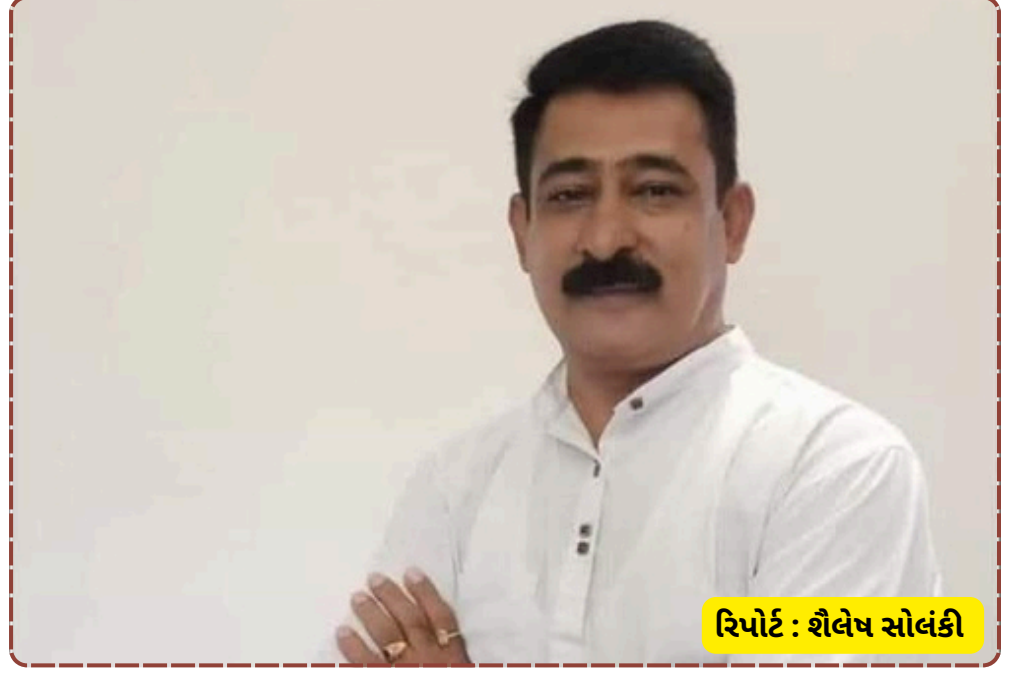
રિપોર્ટ : શૈલેષ સોલંકી

છે, વાસ્તવમાં આ લડાઈ વર્ચસ્વની છે. જે રીતે પક્ષના વફાદાર કાર્યકરનો અવાજ દબાવી દેવામાં આવ્યો છે, તેનાથી ભરૂચ કોંગ્રેસમાં મોટું ગાબડું પડવાની શક્યતા છે. સસ્પેન્શનની આ હિલચાલ બાદ દિનેશ અડવાણી આગામી દિવસોમાં શું સ્ટેન્ડ લે છે અને હાઈકમાન્ડ આ મામલે મધ્યસ્થી કરે છે કે નહીં તે જોવું રહ્યું. હાલ તો ભરૂચ કોંગ્રેસમાં 'બોલે તેના બોર વેચાય' નહીં પણ 'બોલે તેને જેલ (સસ્પેન્શન) થાય' જેવી સ્થિતિ સર્જાઈ છે.