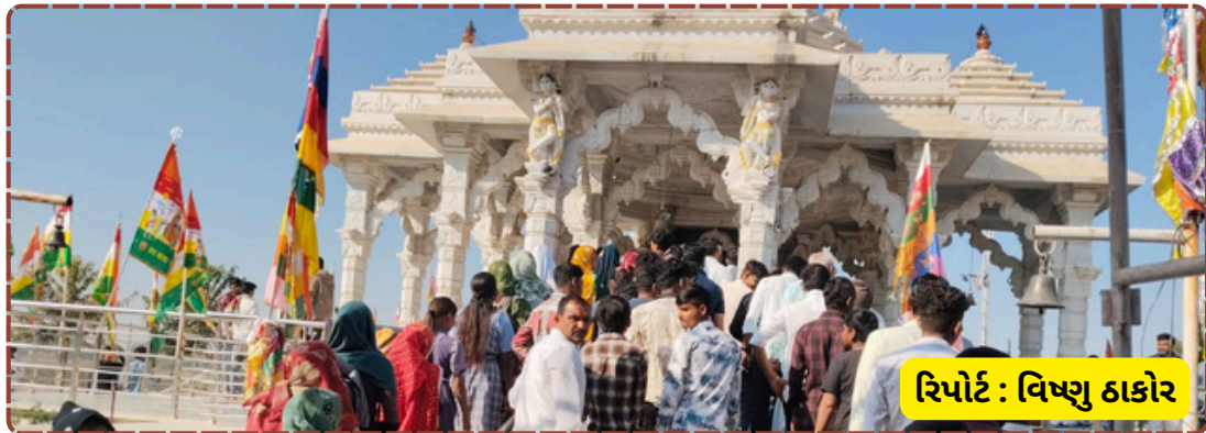
રિપોર્ટ : વિષ્ણુ ઠાકોર