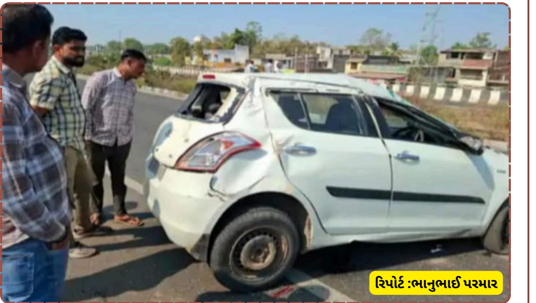
રિપોર્ટ : ભાનુભાઈ પરમાર

દૈનિક પલ્સ સમાચાર: બનાસકાંઠા જિલ્લામાંથી પસાર થતા પાલનપુર-રાધનપુર નેશનલ હાઈવે પર શિકોરી ઓવરબ્રિજ પાસે આજે વહેલી સવારે એક ભયાનક અકસ્માત સર્જાયો હતો. એક કાર્યાલક પોતાનું વાહન લઈને હાઈવે પરથી પસાર થઈ રહ્યો હતો, ત્યારે અચાનક કોઈ કારણોસર તેણે સ્ટીયરિંગ પરનો કાબૂ ગુમાવી દીધો હતો. બેકાબૂ બનેલી કાર સૌપ્રથમ રોડના ડિવાઈડર સાથે ઘડાકાભેર અથડાઈ હતી અને ત્યારબાદ બ્રિજની લોખંડની રેલિંગ તોડીને સીધી નીચે પટકાઈ હતી. આ અકસ્માત એટલો જોરદાર હતો કે કારને મોટું નુકસાન પહોંચ્યું હતું. જોકે, કુદરતી રીતે મોટી જાનહાનિ ટળી હતી કારણ કે જે સમયે કાર બ્રિજ પરથી નીચે પડી તે સમયે નીચેના ભાગે કોઈ પણ રાહદારી કે અન્ય વાહન ઉપસ્થિત નહોતું. જો નીચે ટ્રાફિક હોત તો આ દુર્ઘટના અત્યંત ગંભીર સ્વરૂપ ધારણ કરી શકી હોત.