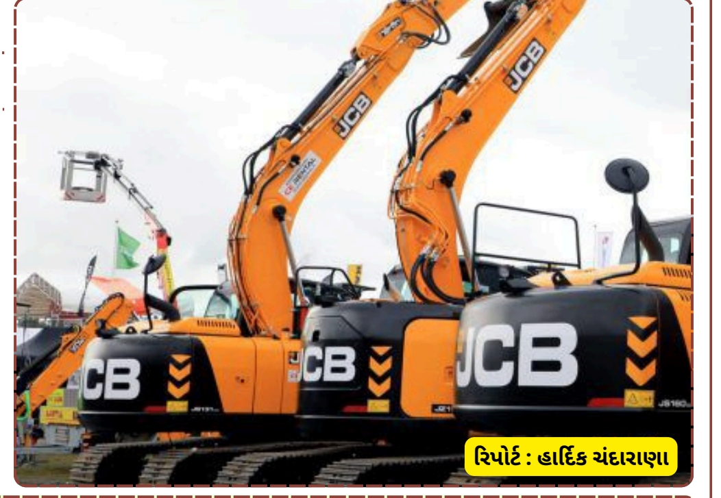
રિપોર્ટ : હાર્દિક ચંદારાણા

બાકીના તમામ ગેરકાયદે બાંધકામો તોડી પાડવાની દિશામાં આગળ વધી રહી છે. આ ઉપરાંત, રાધાકૃષ્ણનગરમાં આવેલા વેલનાથજી મંદિરને પણ દબાણ ગણાવીને તંત્ર દ્વારા તોડી પાડવાની નોટિસ ફટકારવામાં આવી છે. આ ડિમોલિશન ઝુંબેશથી જંગલેશ્વર અને આસપાસના વિસ્તારોમાં ગેરકાયદે બાંધકામ કરનારા તત્વોમાં ભારે ફફડાટ વ્યાપી ગયો છે. તંત્રનો ઉદ્દેશ્ય જાહેર માર્ગો અને નદીના પટને ખુલ્લા કરી શહેરના સુવ્યવસ્થિત વિકાસમાં અવરોધરૂપ દબાણોને દૂર કરવાનો છે.