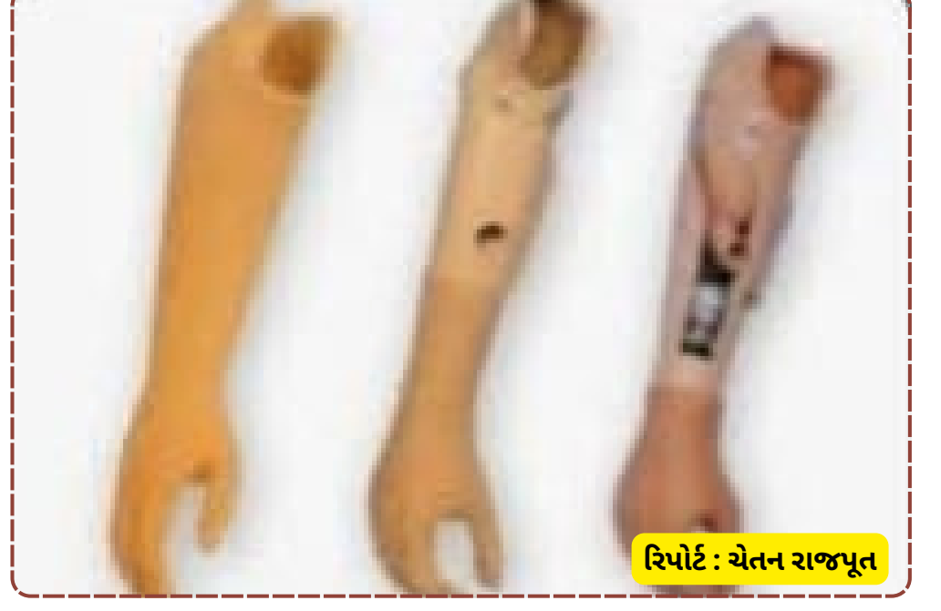
રિપોર્ટ: ચેતન રાજપૂત

શકાય છે. રજીસ્ટ્રેશનની છેલ્લી તારીખ ૧૨ માર્ચ, ૨૦૨૬ છે. આ સેવાનો લાભ લઈને દિવ્યાંગો ફરી એકવાર આત્મનિર્ભર બની સમાજમાં ગૌરવભરે આગળ વધી શકશે.