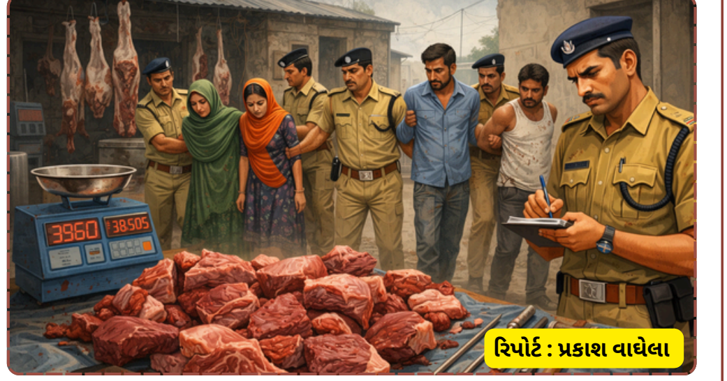
રિપોર્ટ : પ્રકાશ વાઘેલા

દેસાઈ અને સબ-ઇન્સ્પેક્ટર એસ.જી. જાલાની આગેવાનીમાં એએસઆઈ મહેન્દ્ર એકનાથ, ચંદ્રસિંહ અને મૈત્રીબેન સહિતના જવાનોએ મહત્વની ભૂમિકા ભજવી હતી. નડિયાદમાં બનેલી આ ઘટનાએ ગેરકાયદે માંસના વેચાણ અંગે શહેરમાં ચર્ચા જગાવી છે.