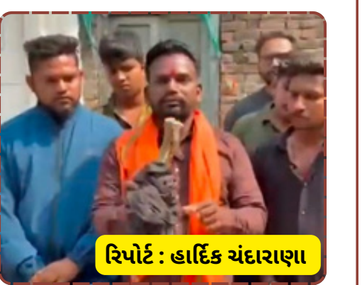
રિપોર્ટ : હાર્દિક ચંદારાણા

બાદ જ માંસના પ્રકાર અંગેની સત્તાવાર પુષ્ટિ થશે. હાલ પૂરતું, બજરેગ દળના કાર્યકરોએ શાંતિ જાળવી રાખીને જવાબદાર તત્વો સામે દાખલારૂપ કાર્યવાહી કરવાની માંગ કરી છે. નરોડા વિસ્તારમાં આ ઘટનાને પગલે ચર્ચાઓ જાગી છે અને વહીવટી તંત્ર દ્વારા પણ સતર્કતા રાખવામાં આવી રહી છે જેથી કોઈ અનિચ્છનીય બનાવ ન બને.