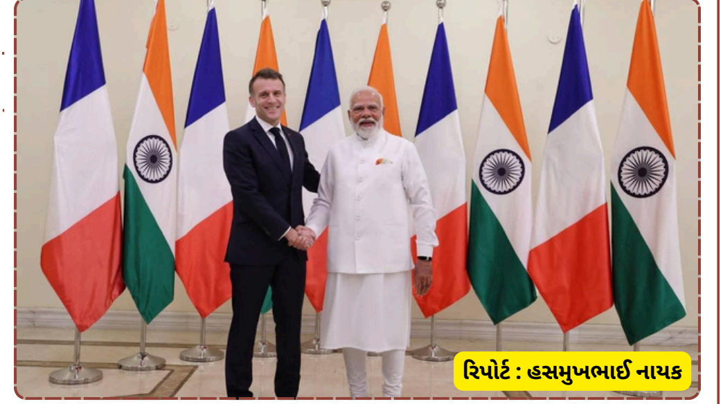
રિપોર્ટ : હસમુખભાઈ નાયક

સ્ટાર્ટઅપ્સ અને આઈટી ક્ષેત્ર માટે નવી તકોના દ્વારા ખોલશે. ભારત અને ફ્રાન્સ હંમેશા મુશ્કેલ સમયમાં એકબીજાની સાથે ઉભા રહ્યા છે. રાષ્ટ્રપતિ મેકોનની આ મુલાકાત માત્ર એક ઔપચારિક પ્રવાસ નથી, પરંતુ તે બંને લોકશાહી દેશો વચ્ચેના અતૂટ વિશ્વાસનું પ્રતીક છે. આ મુલાકાતથી ભારત-ફ્રાન્સ વ્યૂહાત્મક ભાગીદારી ૨૦૨૬ના વર્ષમાં નવી ઊંચાઈઓ હાંસલ કરશે તે નિશ્ચિત છે.