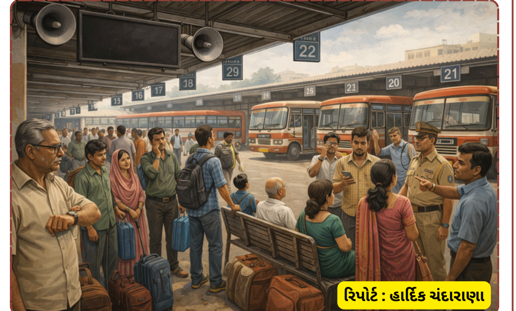
રિપોર્ટ : હાર્દિક ચંદારાણા

અટકાવી રાખનાર અધિકારીઓ સામે માત્ર તપાસ જ નહીં, પણ નિયમાનુસાર દંડનીય પગલાં ભરી દાખલો બેસાડવામાં આવે જેથી ભવિષ્યમાં મુસાફરોને આવી લાપરવાહીનો ભોગ ન બનવું પડે.