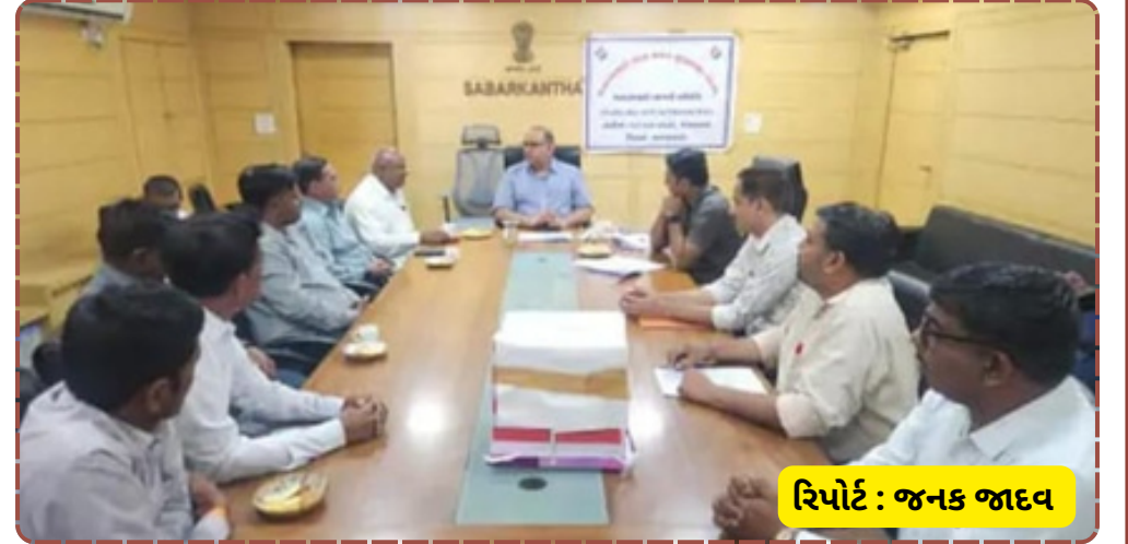
રિપોર્ટ : જનક જાદવ

આવી છે. હવે ટૂંક સમયમાં જ રાજ્ય ચૂંટણી આયોગ દ્વારા ચૂંટણીનું જાહેરનામું પ્રસિદ્ધ કરવામાં આવશે, જે માટે વહીવટી તંત્ર સજ્જ છે.