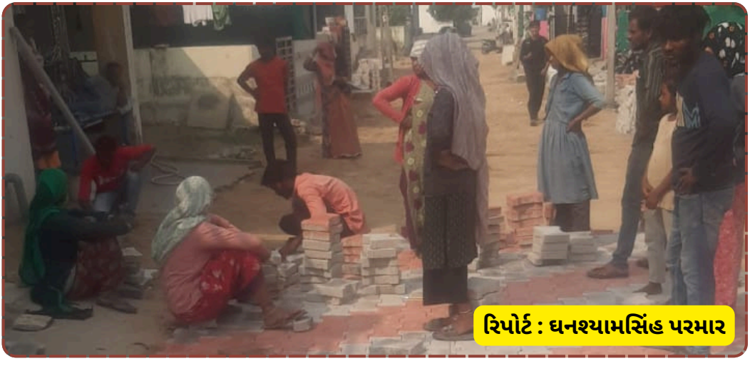
રિપોર્ટ : ધનશ્યામસિંહ પરમાર

કોન્ટ્રાક્ટરને કામ પહોંચાડવા માટે સૂચના આપવામાં આવે. રહીશો ઈચ્છે છે કે ટેન્ડરની શરતો મુજબ અને ટેકનિકલ માપદંડો જળવાય તે રીતે જ કામ આગળ વધવું જોઈએ જેથી ભવિષ્યમાં કોઈ હાલાકી ન ભોગવવી પડે.