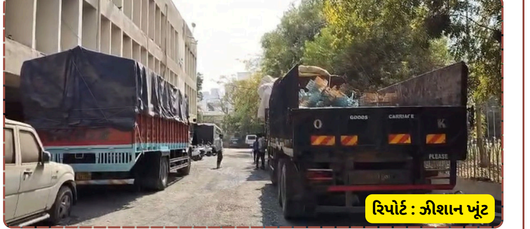
રિપોર્ટ : જીશાન ખંટ

જોવા મળી રહ્યો છે. જીએસટી વિભાગે સ્પષ્ટ કર્યું છે કે આગામી દિવસોમાં પણ આ પ્રકારનું ચેકિંગ ચાલુ રહેશે અને જે પણ શંકાસ્પદ વ્યવહાર જણાશે તેની સામે કડક કાયદાકીય પગલાં લેવામાં આવશે.