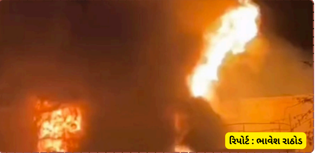
રિપોર્ટ : ભાવેશ રાહોડ

દૈનિક પલ્સ સમાચાર: શહેરના પીપળજ ઇન્ડસ્ટ્રીયલ એરિયામાં આજે એક કેમિકલ ફેક્ટરીમાં લાગેલી ભીષણ આગે રૌદ્ર સ્વરૂપ ધારણ કર્યું છે. આગ એટલી વિકરાળ છે કે અમદાવાદ ફાયર બ્રિગેડે તેને કાબુમાં લેવા માટે 'મેજર કોલ' જાહેર કરવો પડ્યો છે. કેમિકલના સંગ્રહના કારણે આગની જ્વાળાઓ દૂર-દૂર સુધી દેખાઈ રહી છે અને આખું આકાશ કાળા ધુમાડાથી ભરાઈ ગયું છે. પીપળજ પાસે આવેલી કેમિકલ બનાવતી કંપનીના પ્લાન્ટમાં અચાનક આગ લાગતા અકસ્માતફરી મચી ગઈ હતી. કેમિકલ હોવાને કારણે આગ ખૂબ જ ઝડપથી ફેલાઈ અને જોતજોતામાં આખી ફેક્ટરીને પોતાની ઝપેટમાં લઈ લીધી હતી. ફેક્ટરીની અંદરથી કેમિકલના ડ્રમ ફાટવાના પ્રચંડ અવાજો આવી રહ્યા છે, જેણે આસપાસના રહીશોને ફાળ પાડી છે. આગ પર કાબુ મેળવવા માટે શહેરના જમાલપુર, નવરંગપુરા અને મણિનગર સહિતના સ્ટેશનોથી ૨૦ થી વધુ ફાયર ફાઈટરની ગાડીઓ ઘટનાસ્થળે તૈનાત કરવામાં આવી છે. ફાયર ઓફિસરો અને જવાનોની મોટી ફોજ અત્યારે ચારેય દિશામાંથી પાણીનો મારો ચલાવી રહી છે. કેમિકલની આગ હોવાથી પાણીની સાથે સાથે ખાસ 'ફોમ' (Foam) નો પણ ઉપયોગ કરવામાં આવી રહ્યો છે જેથી કેમિકલની સપાટી પર ઓક્સિજન કટ-ઓફ થઈ શકે અને આગ વધુ ન ભડકે. આગના પગલે આસપાસના એકમોમાં પણ વીજ પુરવઠો સાવચેતીના ભાગરૂપે કાપી નાખવામાં આવ્યો છે. હાલમાં મુખ્ય ધ્યાન આગને નજીકના અન્ય ઔદ્યોગિક એકમોમાં ફેલાતી અટકાવવા પર છે. ફેક્ટરીમાં કોઈ કામદાર ફસાયેલ છે કે કેમ તે અંગે અત્યારે કોઈ સત્તાવાર પુષ્ટિ મળી નથી. પરંતુ આગનું કદ જોતા ફેક્ટરીના માલિકને કરોડો રૂપિયાનું આર્થિક નુકસાન થવાનો અંદાજ છે. એફએસએલ (FSL) ની ટીમ પણ બોલાવવામાં આવી છે જે આગ બુઝાયા પછી શોર્ટ સર્કિટ કે અન્ય કોઈ કારણ છે તેની તપાસ કરશે.