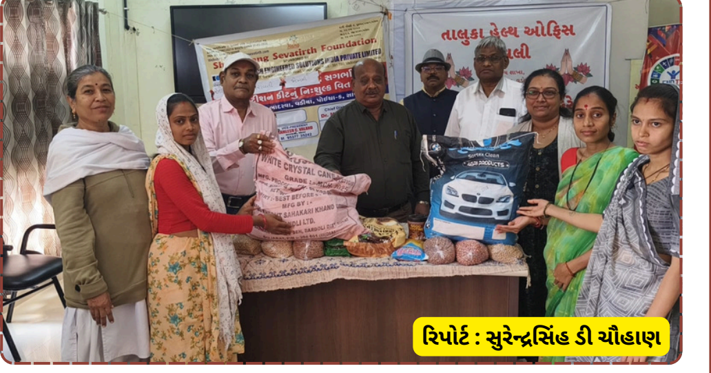
રિપોર્ટ : સુરેન્દ્રસિંહ ડી ચૌહાણ

કંપનીઓ અને સામાજિક સંસ્થાઓ જ્યારે સરકાર સાથે મળીને કામ કરે છે ત્યારે સમાજના અંતિમ છેડા સુધી લાભ પહોંચાડી શકાય છે. આ પહેલથી સ્થાનિક સ્તરે કુપોષણ સામેની લડતને વધુ બળ મળશે.