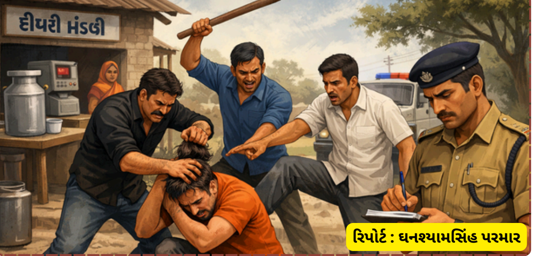
રિપોર્ટ : ધનશ્યામસિંહ પરમાર