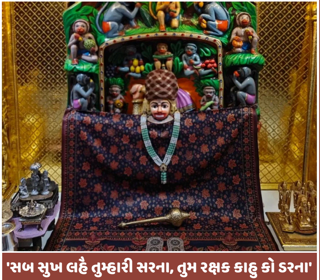
'સબ સુખ લહે તુમ્હારી સરના, તુમ રક્ષક કાહુ કો કરના'