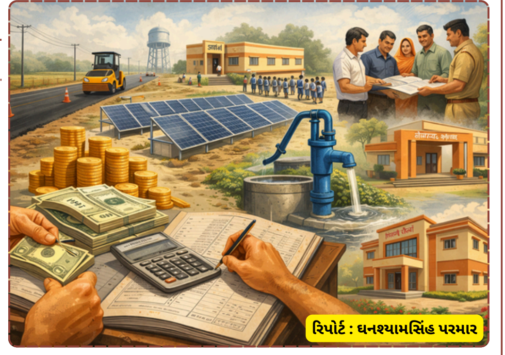
રિપોર્ટ : ધનશ્યામસિંહ પરમાર

જળ સંચય અને પાણી બચાવવાની ઝુંબેશને વેગ આપવા માટે જિલ્લા પંચાયતે એક કરોડ રૂપિયાનું અનામત ભંડોળ રાખ્યું છે. જિલ્લા પંચાયતના સત્તાધીશોએ વિશ્વાસ વ્યક્ત કર્યો છે કે આ બજેટના અમલીકરણથી જિલ્લાના અંતરિયાળ વિસ્તારો સુધી વિકાસના ફળ પહોંચશે અને તમામ નિયત કામો સમયમર્યાદામાં પૂર્ણ કરવામાં આવશે. આ બજેટ સાબરકાંઠાના ઉજ્જવળ ભવિષ્ય અને માળખાગત સુવિધાઓના સુધારા માટે સીમાચિહ્નરૂપ સાબિત થશે.