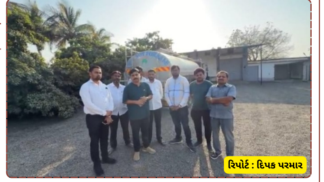
રિપોર્ટ : દિપક પરમાર

આ કૌભાંડમાં મંડળીના મંત્રીઓથી લઈને ડેરીના પદાધિકારીઓની મિલીભગત હોવાની પ્રબળ આશંકા છે. ચેરમેનના ગામની મંડળીમાં પણ આ દૂધ જતું હોવાથી શંકાની સોય ઉચ્ચ સ્તર સુધી પહોંચી છે. પશુપાલકો અને ગ્રાહકોના હિતમાં આ નેટવર્કની તટસ્થ તપાસ થવી જોઈએ કે આખરે આ 'પશુ વિનાનું દૂધ' કયા કારખાનામાં બને છે અને કોના ખિસ્સા ભરે છે.