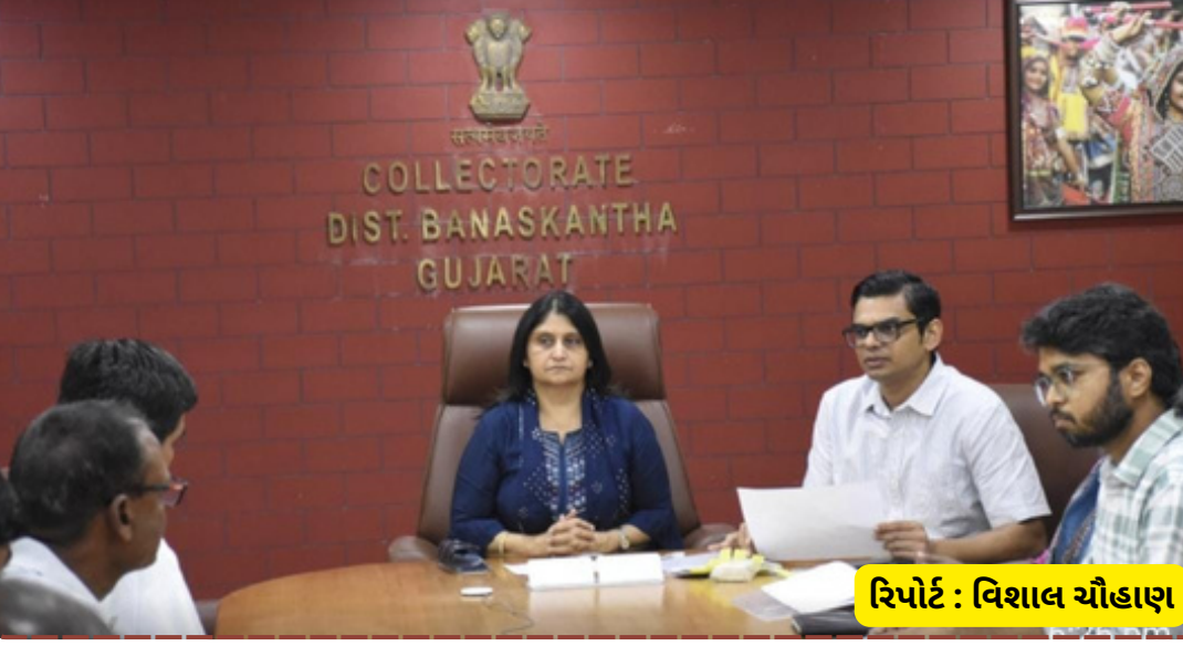
રિપોર્ટ : વિશાલ ચૌહાણ