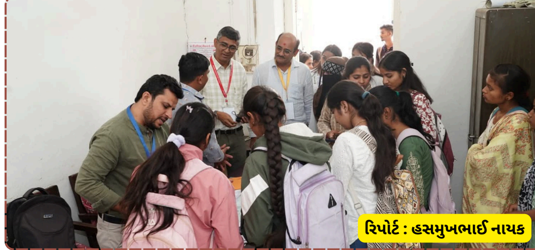
રિપોર્ટ : હસમુખભાઈ નાયક