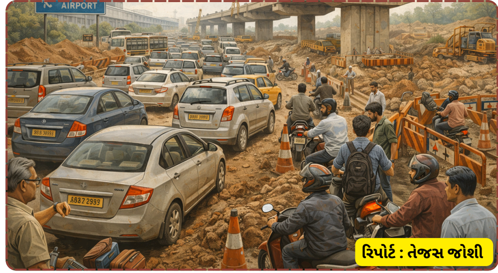
રિપોર્ટ: તેજસ જાશી

રજૂઆત કરે છે ત્યારે માત્ર આશ્વાસનો મળે છે. શહેરજનો હવે થાકીને કહી રહ્યા છે કે સાહેબ, જો વિકાસ કરવો હોય તો કરો, પણ પાયાની વૈકલ્પિક વ્યવસ્થા તો પૂરી પાડો. આ સ્થિતિ ક્યાં સુધી ચાલશે તે મોટો પ્રશ્ન છે