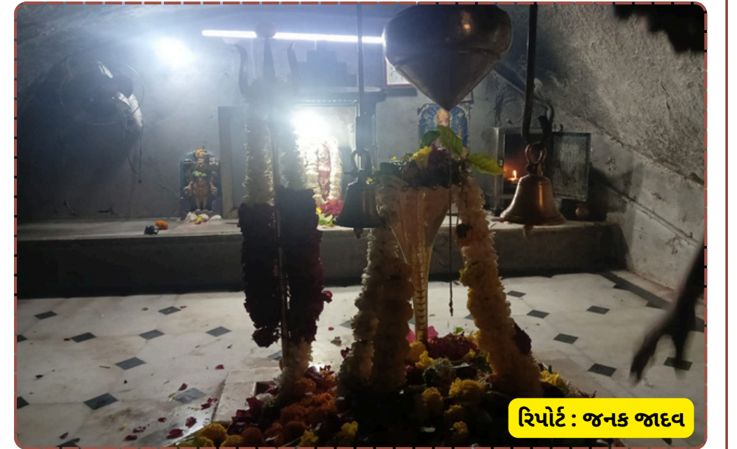
રિપોર્ટ : જનક જાદવ

અને દૂધ અર્પણ કરી પરિવારની સુખ-શાંતિ માટે પ્રાર્થના કરી હતી. સમગ્ર ઉત્તર ગુજરાતમાં શિવરાત્રીના પર્વ આરંભ અને ઉત્સાહનો ત્રિવેણી સંગમ જોવા મળ્યો હતો.