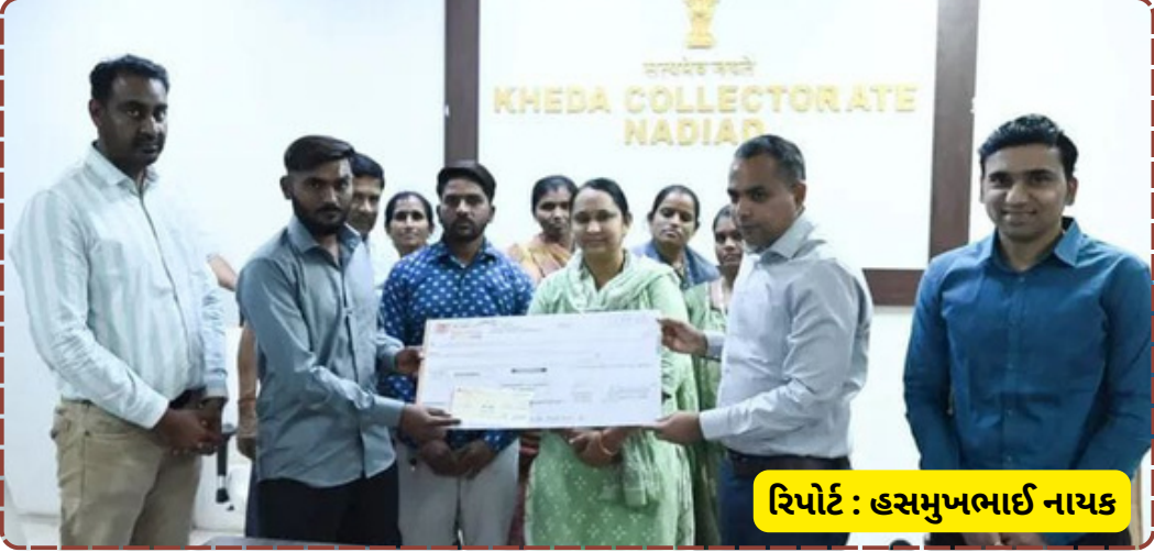
રિપોર્ટ : હસમુખભાઈ નાયક

ફેલાવવામાં આવે. ગ્રામીણ સ્તરે પાણીના ટેક્સની વસુલાત સમયસર થાય તે માટે પણ તેમણે ભાર મૂક્યો હતો. આ સિદ્ધિથી ખેડા જિલ્લો હવે જળ વ્યવસ્થાપન મોડેલ તરીકે ઉભરી રહ્યો છે, જે અન્ય જિલ્લાઓ માટે પ્રેરણારૂપ બનશે.