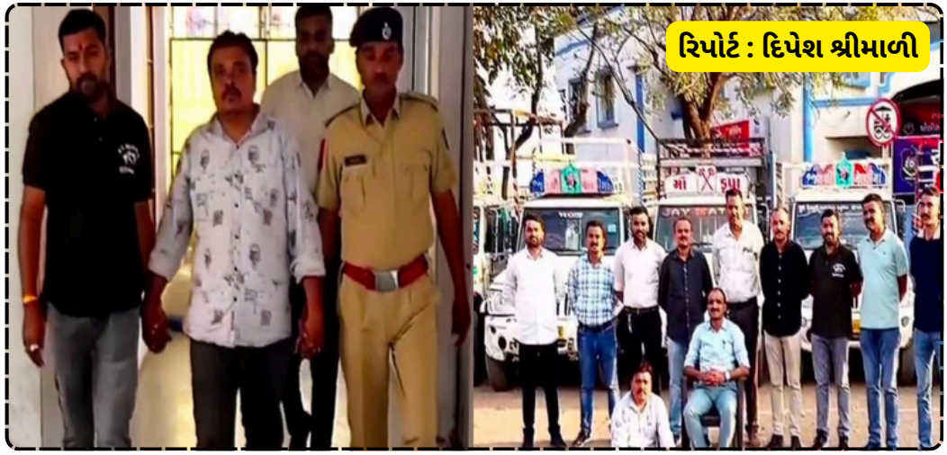
રિપોર્ટ : દિપેશ શ્રીમાળી

૧૪ વાહનો રિકવર કરવામાં સફળ રહી છે, જેની કિંમત લાખોમાં થાય છે. આ કૌભાંડમાં કોઈ અન્ય ગેંગ સક્રિય છે કે કેમ તે જાણવા માટે પોલીસે આરોપીના રિમાન્ડ મેળવવાની તજવીજ હાથ ધરી છે.