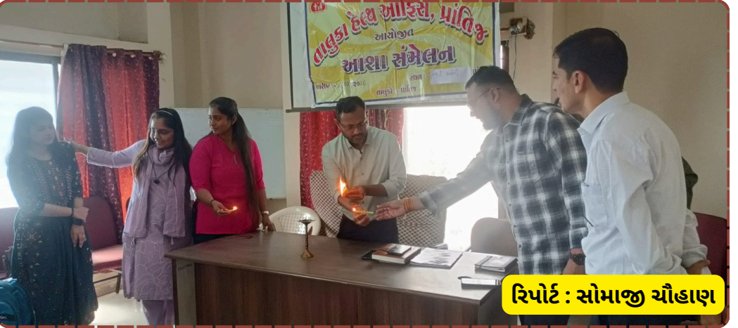
રિપોર્ટ : સોમાજી ચૌહાણ

વધારો કરવાનો અને ભવિષ્યમાં વધુ સારી સેવાઓ માટે પ્રેરિત કરવાનો હતો. આ સંમેલનથી આરોગ્ય કર્મચારીઓ વચ્ચેના સંકલનમાં વધારો થશે અને તાલુકાના આરોગ્ય સ્તરમાં સુધારો જોવા મળશે તેવી અપેક્ષા રાખવામાં આવી છે.