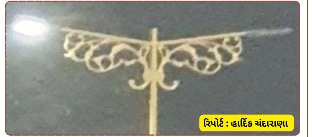
રિપોર્ટ : હાર્દિક ચંદારાણા

ભવ્ય બનાવવાની સાથે તેની જાળવણી પણ એટલી જ જરૂરી છે તેવી માંગણી પ્રબળ બની છે.