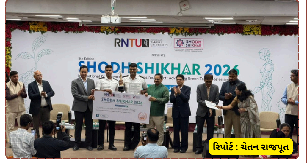
રિપોર્ટ : ચેતન રાજપૂત

સત્તાધીશોએ જણાવ્યું કે વિદ્યાર્થીઓના સંશોધનોમાં રહેલી મૌલિકતા અને સામાજિક ઉપયોગિતા આ સફળતાનું મુખ્ય કારણ છે. ભોપાલની ટાગોર યુનિવર્સિટીએ પણ ગણપત યુનિવર્સિટીની સંશોધન ક્ષેત્રે રહેલી પ્રતિબદ્ધતાની ભારે પ્રશંસા કરી હતી. આ સિદ્ધિથી યુનિવર્સિટીના શૈક્ષણિક વાતાવરણમાં ઉત્સાહનો માહોલ છે.