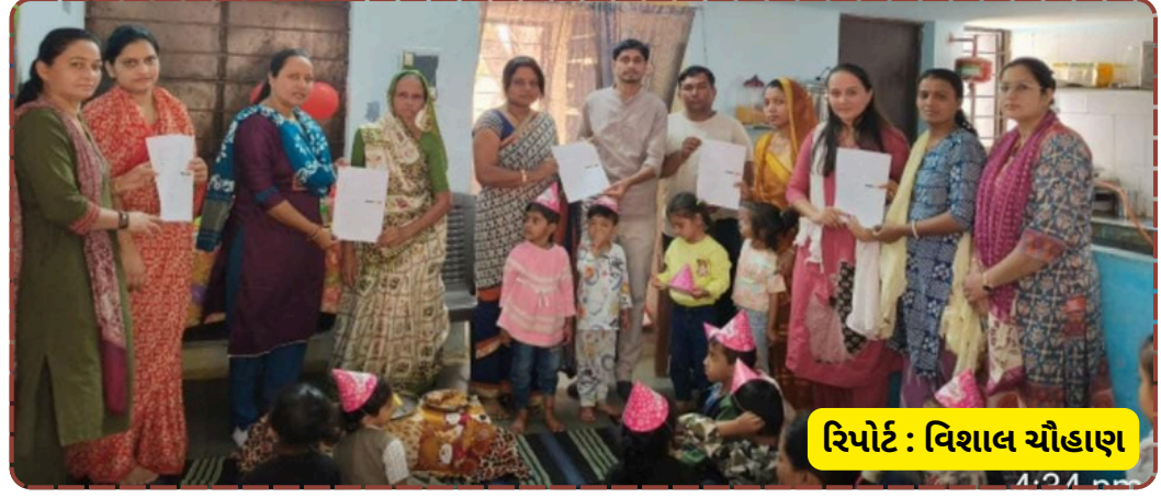
રિપોર્ટ : વિશાલ ચૌહાણ

વણકર સહિતના અધિકારીઓએ ઉપસ્થિત રહી કાર્યકરો અને વાલીઓનો ઉત્સાહ વધાર્યો હતો. વાલીઓએ પણ આંગણવાડીની આ પ્રવૃત્તિને બિરદાવી હતી. આ પ્રકારના આયોજનથી બાળકોના પાયાના શિક્ષણને વધુ મજબૂતી મળશે અને વાલીઓમાં જાગૃતિ આવશે તેવી આશા વ્યક્ત કરવામાં આવી હતી