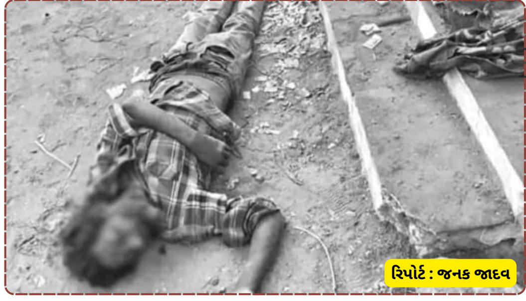
રિપોર્ટ : જનક જાદવ

પોલીસે અકસ્માત મોતની નોંધ કરી આગળની તપાસ હાથ ધરી છે. મૃતકની ઓળખ માટે રેલવે પોલીસ દ્વારા સોશિયલ મીડિયા અને અન્ય પોલીસ સ્ટેશનમાં જાણ કરવામાં આવી.