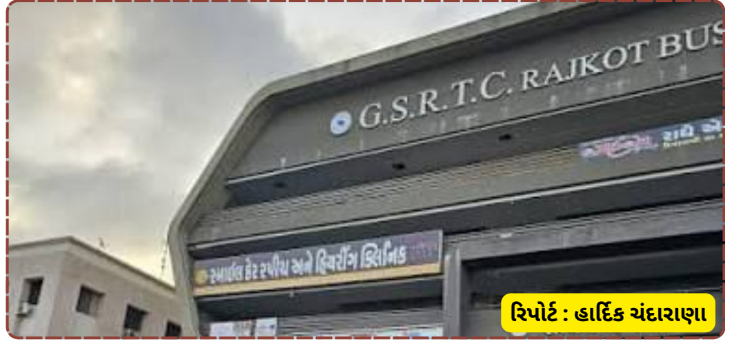
રિપોર્ટ : હાર્દિક ચંદારાણા

પણ ₹77,000 જેટલો ઘટાડો નોંધાયો છે. તેમ છતાં, એસટી દ્વારા કરવામાં આવેલા આ સંચાલનને કારણે શ્રદ્ધાળુઓને પરિવહન ક્ષેત્રે મોટી રાહત મળી હતી અને ભીડનું વ્યવસ્થિત સંચાલન કરી શકાયું હતું.