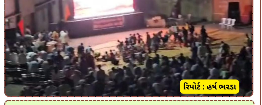
રિપોર્ટ : હર્ષ ભરડા

જનમેદનીએ રાષ્ટ્રપ્રેમ, એકતા અને ભારતીય સંસ્કૃતિના મૂલ્યોને મજબૂત બનાવવાનો સામૂહિક સંકલ્પ લીધો હતો. આવા કાર્યક્રમો સમાજમાં નવી ચેતના અને દેશભક્તિની જ્યોત પ્રગટાવતા રહેશે તેવી આશા વ્યક્ત કરવામાં આવી હતી.