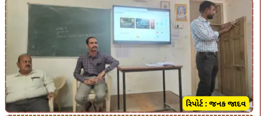
રિપોર્ટ : જનક જાદવ

મુકાઈ રહ્યો છે. શિક્ષણ વિભાગના જણાવ્યા મુજબ, આ પ્રકારની તાલીમથી જિલ્લામાં શૈક્ષણિક સ્તર ઊંચું આવશે અને શિક્ષકો વિદ્યાર્થીઓને વધુ સારી રીતે માર્ગદર્શન આપી શકશે.