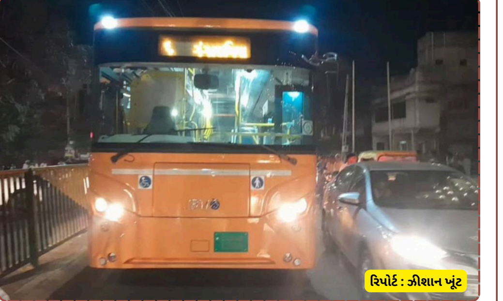
રિપોર્ટ : જીશાન ખંટ

પૂરતી તાલીમ આપવામાં આવી છે કે કેમ તે ચર્ચાનો વિષય બન્યો છે. હાલમાં ભારતીયેનની સ્થિતિ નાજુક હોવાનું જાણવા મળ્યું છે અને હોસ્પિટલમાં તેમની સારવાર ચાલી રહી છે.