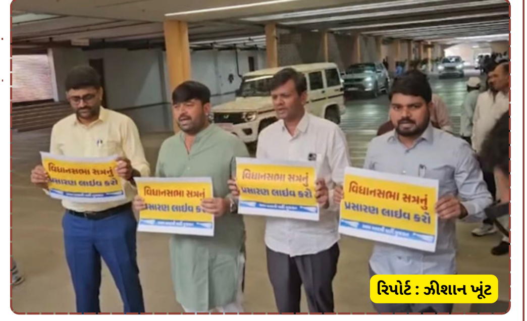
રિપોર્ટ : જીશાન ખંટ

નેતાઓએ જણાવ્યું કે, "અમે જનતાના સેવકો છીએ અને અમારી દરેક હિલચાલ પ્રજા સમક્ષ હોવી જોઈએ." બીજી તરફ, શાસક પક્ષે આ વિરોધને માત્ર પ્રચાર મેળવવાનો સ્ટેટ ગણાવ્યો હતો. આ હંગામોને કારણે બીજા દિવસની પ્રશ્નોત્તરી કાળમાં પણ અસર જોવા મળી હતી. વિધાનસભામાં થયેલા આ વિરોધ પ્રદર્શને રાજ્યના રાજકારણમાં ફરી એકવાર 'પારદર્શકતા' ના મુદ્દે ચર્ચા જગાવી છે.