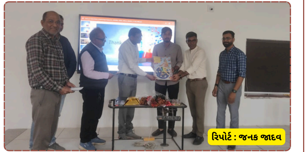
રિપોર્ટ : જનક જાદવ

શક્તિ ખીલે છે અને તેમને ભવિષ્યમાં વ્યવસાયિક કારકિર્દીમાં ખૂબ મદદ મળે છે. કાર્યક્રમમાં મોટી સંખ્યામાં વિદ્યાર્થીઓએ હાજરી આપી સહપાઠીઓને પ્રોત્સાહિત કર્યા હતા. અંતે તમામ સ્ટાફ અને વિદ્યાર્થીઓએ વિજેતાઓને અભિનંદન પાઠવ્યા હતા.