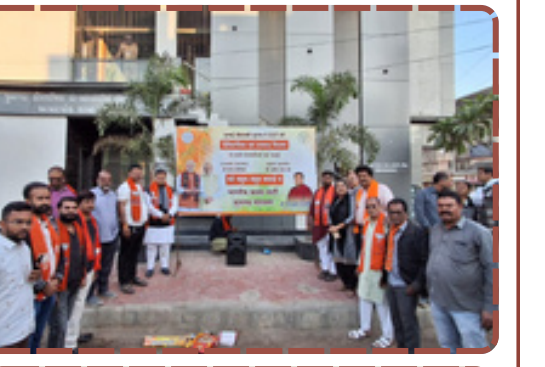
મહારાષ્ટ્રમાં મહાયુતિના પ્રચંડ વિજયને જૂનાગઢ ભાજપે આઝાદ ચોક ખાતે ફટાકડા ફોડી અને મોં મીઠું કરાવી હર્ષોલ્લાસ સાથે વધાવ્યો.

ભાજપના કાર્યકરો માટે કોઈ પણ રાજ્યનો વિજય એ રાષ્ટ્રીય ગૌરવની બાબત છે. સમગ્ર કાર્યક્રમનું સંચાલન અને સંકલન મીડિયા વિભાગ દ્વારા સુચારુ રીતે કરવામાં આવ્યું હતું. રિપોર્ટ : રવિન્દ્ર કંસારા