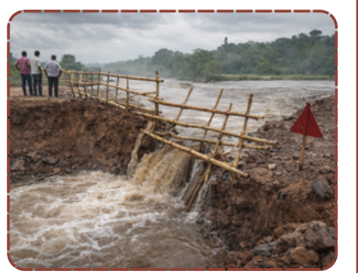
પાવીજેતપુરની ભરાજ નદી પર ભ્રષ્ટાચારના ગાબડાં જોવા મળ્યા છે. 6 કરોડના ડાયવર્સન પાણીમાં વહી ગયા બાદ, હવે નવા ડાયવર્સન પર લોખંડની રેલિંગને બદલે વાંસના બંબુ બાંધી જનતાના જીવ જોખમમાં મૂકાયા છે. તંત્ર અને કોન્ટ્રાક્ટરની મિલીભગત ખુલ્લી પડી છે.

હજારો વાહનોનો ટ્રાફિક પસાર થાય છે. ધૂળના વાદળો વચ્ચે વાંસના આ નબળા ટેકા કોઈ વાહનને નદીમાં પડતા કેવી રીતે બચાવી શકશે તે વિચારવું પણ કંપારી છૂટી જાય તેવું છે. સૌથી મોટો ભ્રષ્ટાચાર પાઈપોના નિકાલમાં જણાય છે. જ્યાં પાણીના પ્રવાહ માટે 140 પાઈપની જરૂરિયાત સામે માત્ર 6 પાઈપ નાખી માટીનું લીપણ કરી દેવાયું છે. સ્થાનિક રહીશો અને વાહનચાલકો પૂછી રહ્યા છે કે શું આ ભ્રષ્ટાચારની ભાગબટાઈ ઉપર સુધી છે? અધિકારીઓના વાહનો અહીંથી પસાર થાય છે છતાં કોઈને આ જોખમ દેખાતું નથી. જનતાના 6 કરોડ રૂપિયા પાણીમાં પધરાવ્યા બાદ પણ જો વાંસના બંબુના સહારે મુસાફરી કરવાની હોય, તો આ તંત્રની સૌથી મોટી નિષ્ફળતા છે. લોકો હવે માંગ કરી રહ્યા છે કે આ કામગીરીની ઉચ્ચસ્તરીય તપાસ થાય અને જવાબદાર કોન્ટ્રાક્ટર તેમજ અધિકારીઓ સામે કડક પગલાં લેવામાં આવે.