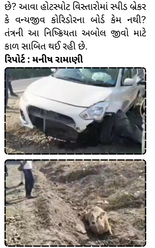
રિપોર્ટ: મનીષ રામાણી

દૈનિક પલ્સ સમાચાર: બાબરા પંથકમાં માર્ગ અકસ્માતોની વણજાર વચ્ચે આજે વધુ એક અરેરાટીભરી ઘટના સામે આવી છે. મોટા દેવળીયાથી દડવા રોડ પર કુલગર પાટીયા પાસે કાર અને નીલગાય વચ્ચે સર્જાયેલા અકસ્માતે વહીવટી તંત્રની પોકળ સુરક્ષા વ્યવસ્થાને ખુલ્લી પાડી દીધી છે. રાત્રિના સમયે અથવા પૂરપાટ ઝડપે દોડતા વાહનો સામે વન્યજીવો અસુરક્ષિત બન્યા છે. આ ઘટનામાં નીલગાય રોડ ક્રોસ કરી રહી હતી ત્યારે અચાનક આવેલી ફોરવીલ કાર તેની સાથે ઘડાકાભેર અથડાઈ હતી. ટક્કર એટલી જોરદાર હતી કે નીલગાયને શરીરે ગંભીર ઈજાઓ પહોંચી છે અને તે તરફડિયા મારી રહી હતી. અકસ્માત બાદ માર્ગ પર વાહનોની લાઈનો લાગી હતી અને ભયનો માહોલ ફેલાયો હતો. જોકે, કાર સવારનો આબાદ બચાવ થયો છે, પણ સવાલ એ છે કે વન વિભાગ કેમ ઉઠી રહ્યો