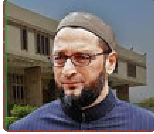
મહારાષ્ટ્ર મ્યુનિસિપલ ચૂંટણીમાં AIMIM ની જીતને DYFI એ છેતરપિંડી ગણાવી. ભાજપ સાથેના ગુપ્ત જોડાણ અંગે યુવાનોને કર્યાં સતર્ક.