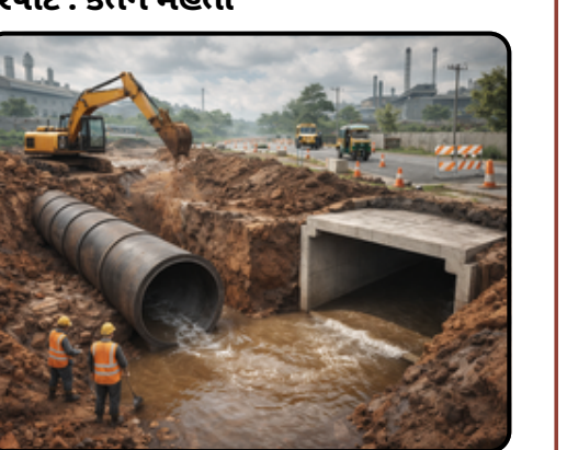
અંકલેશ્વર GIDCમાં ₹૪.૫ કરોડના ખર્ચે નવી ગટર લાઇન અને બોક્સ કલ્વર્ટ બનશે. વરસાદી પાણી ભરાવાની સમસ્યાનો આવશે કાયમી અંત.

અંકલેશ્વર GIDC ના લોકપ્રશ્નોનો સુખદ અંત આવશે. જનતાના પરસેવાના નાણાંનો સદુપયોગ કરીને એક ટકાઉ અને આધુનિક ડ્રેનેજ સિસ્ટમ ઉભી કરવામાં આવશે, જે આગામી અનેક દાયકાઓ સુધી શહેરની સુખાકારીમાં વધારો કરશે. રિપોર્ટ : કેતન મહેતા