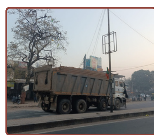
અમદાવાદના ધોળકામાં રેતી માફિયાઓ બેફામ બન્યા છે. કલીકુંડ સર્કલથી પાર્શ્વનાથ હોસ્પિટલ વચ્ચે ઓવરલોડ ડમ્પરો ખુલ્લેઆમ દોડી રહ્યા છે. તંત્ર કે પોલીસનો કોઈ ડર રહ્યો નથી. શું તંત્ર કોઈ મોટી હોનારતની રાહ જોઈ રહ્યું છે? જનતામાં ભારે રોષ છે.

જ્યારે આ ડમ્પરો હોસ્પિટલ જેવા સંવેદનશીલ વિસ્તારમાંથી પસાર થાય છે, ત્યારે ઇમરજન્સી એમ્બ્યુલન્સ અને દર્દીઓ માટે પણ જોખમ ઊભું થાય છે. તેમ છતાં, ખાણ-ખનિજ વિભાગ અને સ્થાનિક પોલીસ ઘોર નિદ્રામાં હોય તેમ જણાય છે. કોઈ પણ કાયદેસરની કાર્યવાહી ન થવી એ ભ્રષ્ટાચારની ચાડી ખાય છે. જનતાના સવાલ સીધા છે: શું કાયદો માત્ર સામાન્ય માણસ માટે જ છે? માફિયાઓને કોનું રક્ષણ મળી રહ્યું છે? હપ્તાખોરીના નશામાં ચૂર અધિકારીઓએ યાદ રાખવું જોઈએ કે જો કોઈ અનહોની થઈ, તો જનતા તેમને માફ નહીં કરે. ધોળકાના જાગૃત નાગરિકો હવે માંગ કરી રહ્યા છે કે આ ઓવરલોડિંગ બંધ કરાવવામાં આવે અને ભ્રષ્ટ અધિકારીઓ સામે તપાસ બેસાડવામાં આવે. નહીંતર, આ માફિયા આતંક ધોળકાની શાંતિ અને સલામતીને ભરખી જશે. રિપોર્ટ : ભાવેશ રાઠોડ