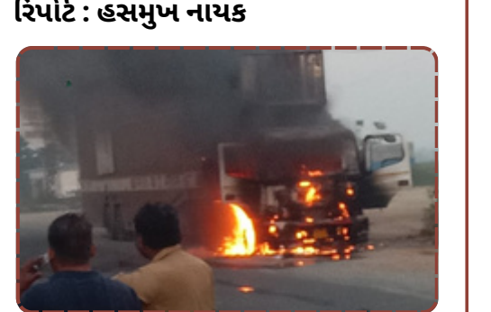
રિપોર્ટ : હસમુખ નાયક

આગની જાણ થતા જ આસપાસના વિસ્તારમાંથી ફાયર ફાઈટરો બોલાવવામાં આવ્યા હતા. ફાયરની ટીમે સતત પાણીનો મારો ચલાવી આગ પર કાબૂ મેળવ્યો હતો, પરંતુ કમનસીબે કન્ટેનર અને તેમાં રહેલી તમામ 8 કાર સંપૂર્ણપણે બળીને ખાખ થઈ ગઈ હતી. હાઈવે પર બનેલી આ ઘટનાને જોવા માટે લોકોના ટોળેટોળા ઉમટી પડ્યા હતા. હાલમાં આગ લાગવાનું ચોક્કસ કારણ જાણી શકાયું નથી, પરંતુ આ અકસ્માતે ભારે આર્થિક નુકસાન સર્જ્યું છે.