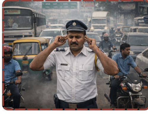
નવસારીમાં વાહનોના ધસારા વચ્ચે ટ્રાફિક પોલીસની કપરી હાલત. પ્રદૂષણ અને ઘોંઘાટમાં ફરજ છતાં નાગરિકોના સહકારનો અભાવ.

ચાલો, આ પાયાના રક્ષકોનું સન્માન કરીએ અને નિયમોનું પાલન કરી નવસારીને સુરક્ષિત બનાવીએ.