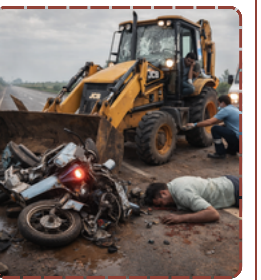
ભરૂચના સામલોદ પાસે અજાણ્યા વાહને મોપેડને ટક્કર મારી. અકસ્માતમાં એકનું મોત, જેસીબી ચાલક ઘાયલ. વાહન ચાલક ફરાર.