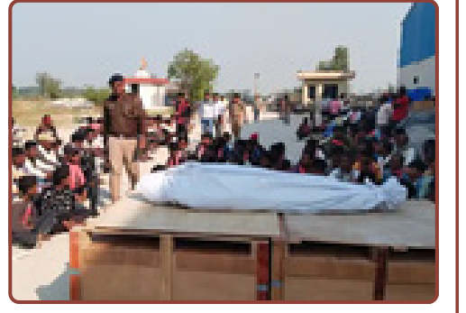
જંબુસરની કિષ્ના સિરામિક કંપનીમાં ગુણો નીચે દબાઈ જવાથી શ્રમિકનું મોત. પરિવારે વળતર માટે કંપનીના દ્વારે ધરણા કર્યા.

પછી કંપનીના મળતિયા બનીને મામલો રફેંદે કરશે? કલાકો વીતવા છતાં મૂતદેહ કંપનીના દરવાજે રાખી રહ્યો છે, જે લોકશાહી અને માનવતા માટે શરમજનક છે. ઉદ્યોગોના નફાની પાછળ શ્રમિકોના જીવનું બલિદાન ક્યાં સુધી અપાતું રહેશે તે મોટો પ્રશ્ન છે. રિપોર્ટ : કેતન મહેતા