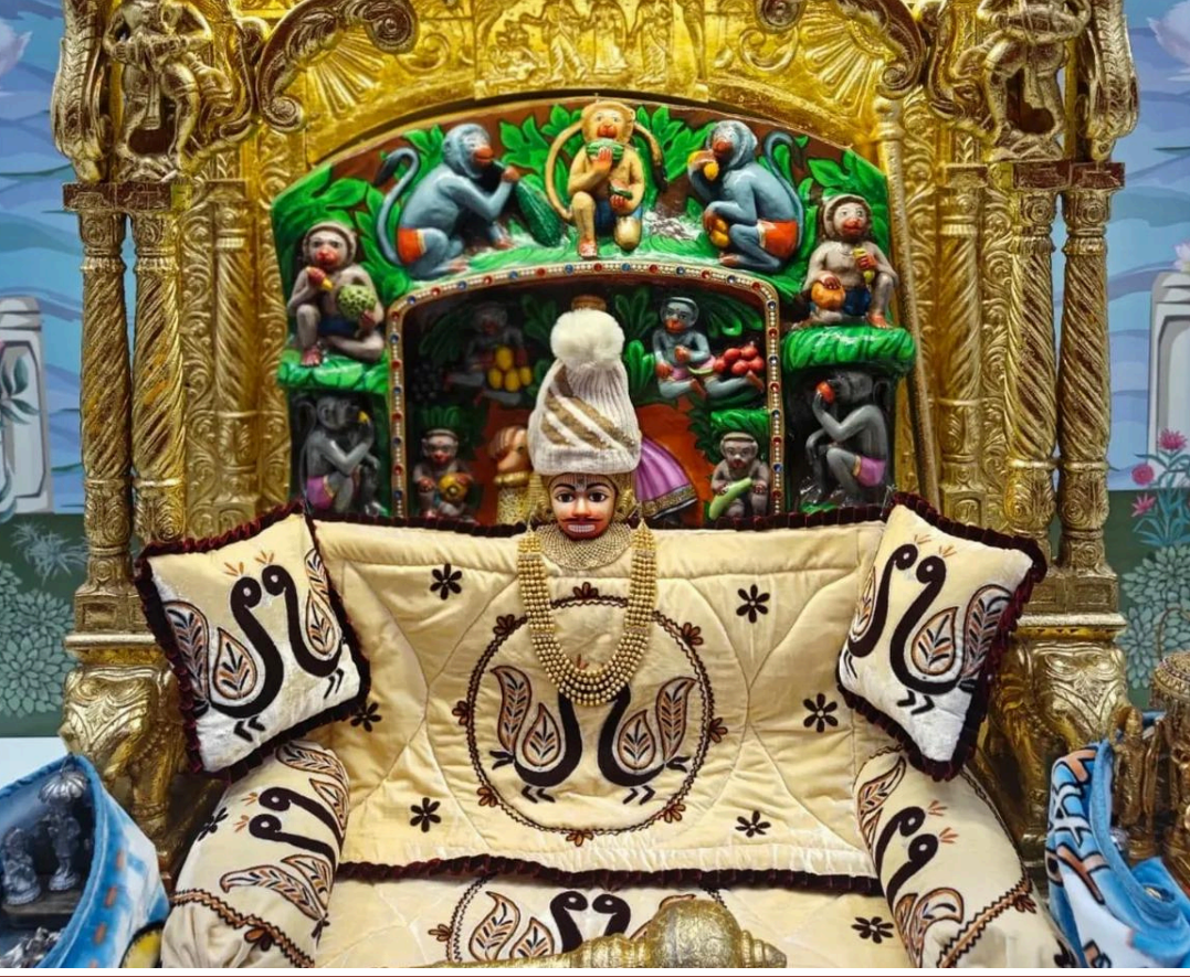
'સબ સુખ લહે તુમ્હારી સરના, તુમ રક્ષક કાહુ કો ડરના'