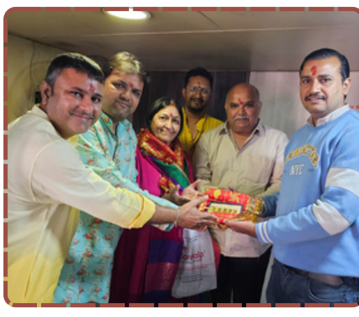
યાત્રાધામ અંબાજી ખાતે શ્રદ્ધાળુનું પૂર ઉમટ્યું છે. અમદાવાદના એક માઈભક્તે માતાજીના ચરણોમાં અંદાજે ₹72 લાખની કિંમતનું 500 ગ્રામ સોનું અર્પણ કર્યું છે. આ ગુપ્ત દાનનો ઉપયોગ મંદિરના શિખરને સુવર્ણમય બનાવવાની પવિત્ર કામગીરીમાં કરવામાં આવશે.

આગળ વધી રહી છે. આ દાનથી માત્ર સુવર્ણ ભંડાર જ નથી વધ્યો, પરંતુ અન્ય શ્રદ્ધાળુઓ માટે પણ આ એક પ્રેરણાપૂર્ણ કિસ્સો બન્યો છે. રિપોર્ટ : વિશાલ ચૌહાણ