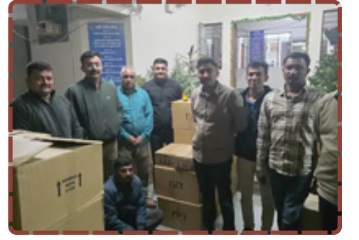
વડોદરાના છાણીમાં ગોડાઉનમાંથી ₹71 લાખનો વિદેશી દારૂ જપ્ત. બિશ્રોઈ ગંગના બે સાગરીતો વોન્ટેડ. પોલીસે તપાસ તેજ કરી.