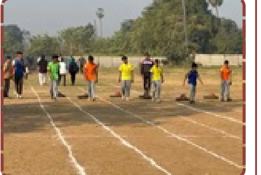
કલેશ્વરની સ્વામી વિવેકાનંદ સ્કૂલમાં વાર્ષિક રમતોત્સવ યોજાયો. ૪૧૫ વિદ્યાર્થીઓએ ૨૮ સ્પર્ધાઓમાં ભાગ લીધો. વિજેતાઓ સન્માનિત.

કાર્યક્રમમાં શિસ્ત અને એકતાના દર્શન થયા હતા. શિક્ષણની સાથે રમતગમતનું મહત્વ સમજાવતા આ આયોજનને વાલીઓ અને વિદ્યાર્થીઓમાં ભારે ઉત્સાહ જગાડ્યો હતો. રિપોર્ટ : કેતન મહેતા