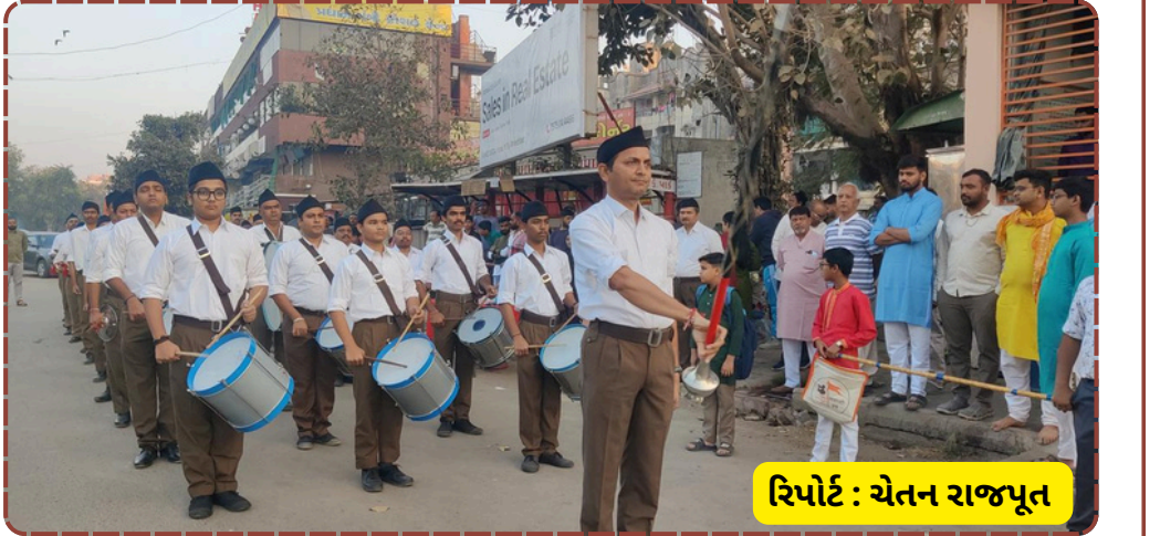
રિપોર્ટ : ચેતન રાજપૂત

પ્રસ્તુતિએ ભક્તોમાં પણ એક નવી ઉર્જાનો સંચાર કર્યો હતો. કાર્યક્રમના અંતે સૌએ શાંતિપૂર્ણ રીતે ભક્તિમય માહોલમાં શિવ આરાધના કરી હતી.