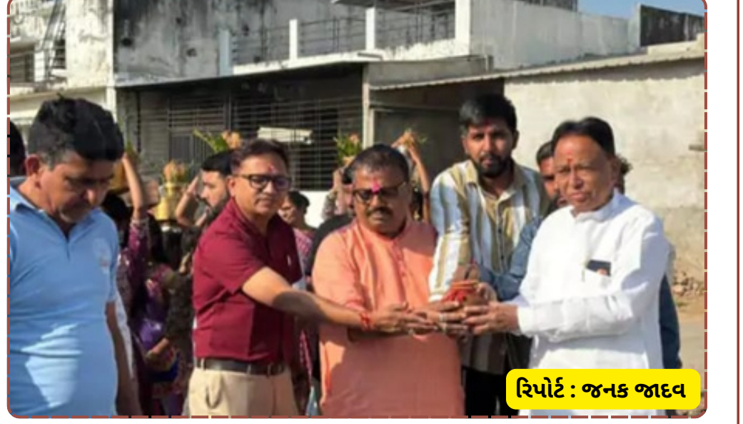
રિપોર્ટ : જનક જાદવ

આ વિકાસ કાર્યને વધાવ્યું હતું. આધુનિક સુવિધા સાથેનું આ ભવન ટૂંક સમયમાં તૈયાર થઈ જશે, જેનાથી ગ્રામજનોને પંચાયતલક્ષી કામો માટે આધુનિક પ્લેટફોર્મ મળશે.