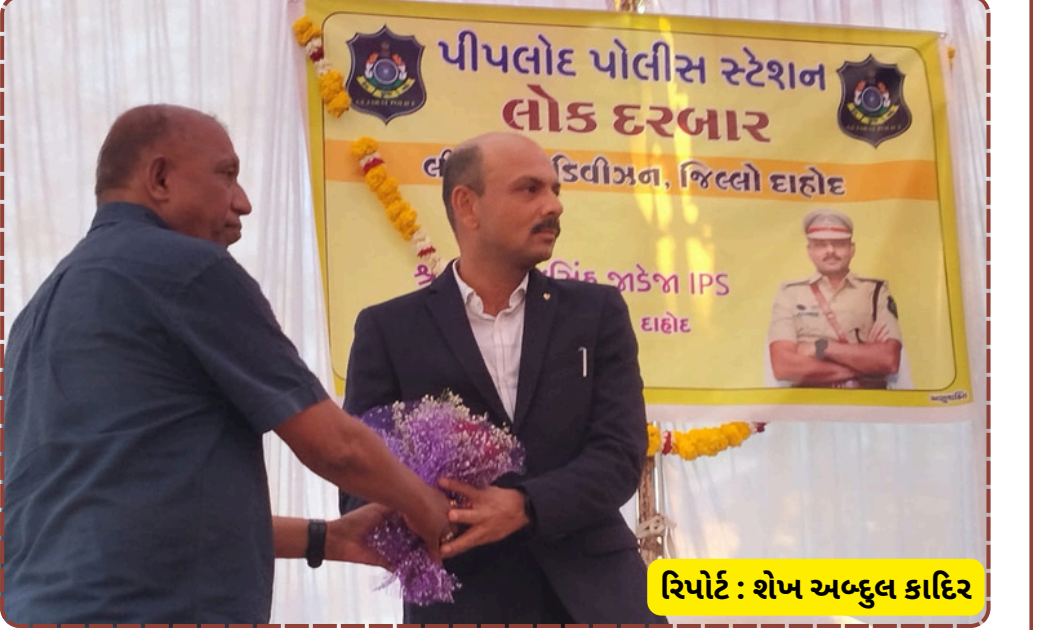
રિપોર્ટ : શેખ અબ્દુલ કાદિર

આપી હતી. વેપારી સંગઠનોએ પણ પોલીસની કામગીરીમાં સહકાર આપવાની પ્રતિબદ્ધતા દર્શાવી હતી. લોક દરબારના સફળ આયોજનથી સ્થાનિકોમાં પોલીસ પ્રત્યે વિશ્વાસ વધ્યો છે.