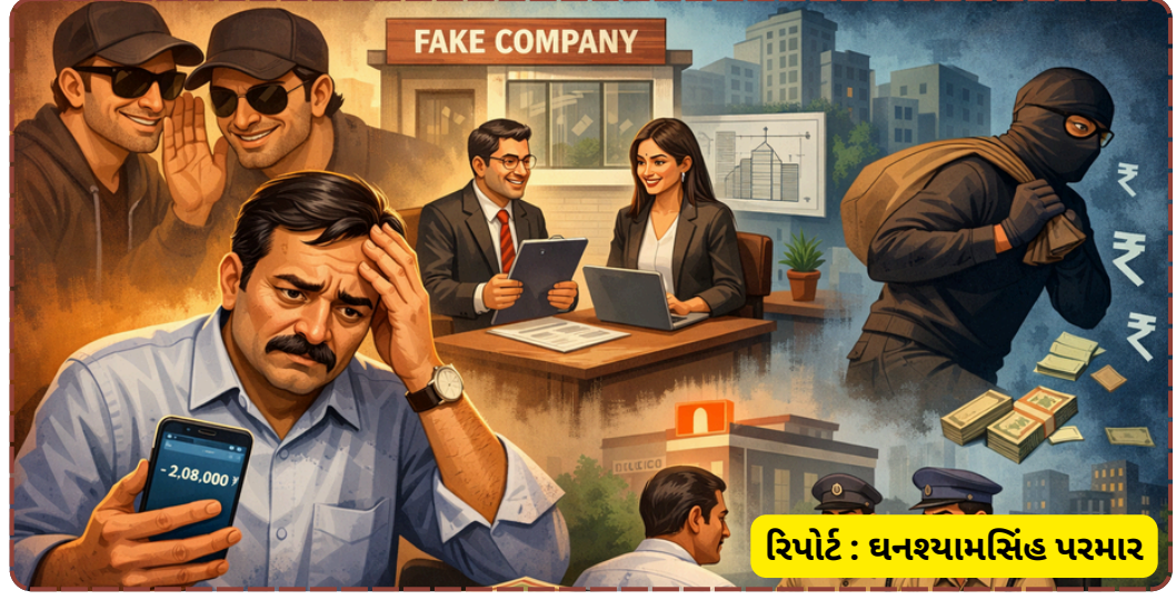
રિપોર્ટ : ધનશ્યામસિંહ પરમાર

છેતરપિંડી અને વિશ્વાસઘાતની ફરિયાદ નોંધાવી છે. પોલીસે BNS-2023 ની વિવિધ કલમો હેઠળ ગુનો નોંધી તપાસના ચક્રો ગતિમાન કર્યા છે.