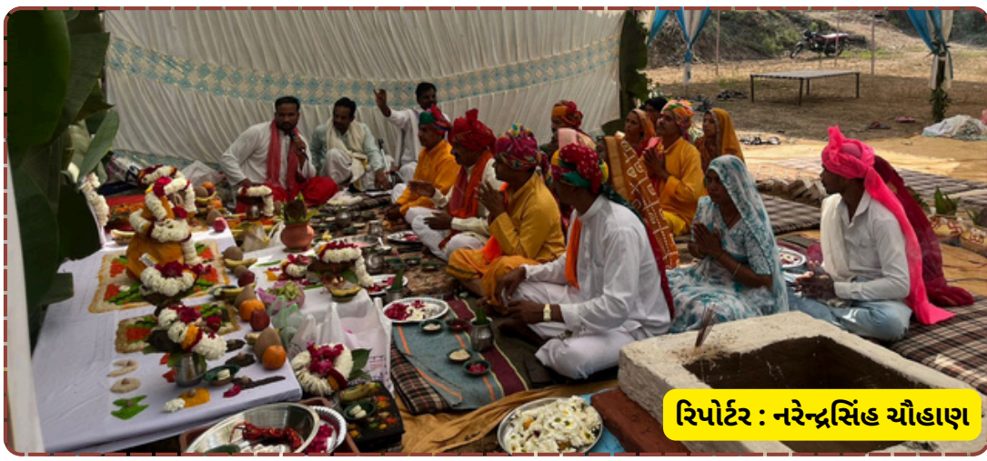
રિપોર્ટર : નરેન્દ્રસિંહ ચૌહાણ

વિધિ પૂર્ણ કરવામાં આવી હતી. રાત્રિના સમયે યોજાયેલા દીપ યજ્ઞમાં સેંકડો દીવાઓ પ્રગટાવવામાં આવતા આખું મંદિર પરિસર જગમગી ઉઠ્યું હતું. ભક્તિ અને આધ્યાત્મિકતાના સંગમ સમાન આ પ્રસંગે માતાજીનો વિશેષ કાર્યક્રમ અને ભજન-સત્સંગ પણ યોજાયા હતા. અંતમાં મહાપ્રસાદનું વિતરણ કરાયું હતું. આ મહોત્સવમાં આસપાસના વિસ્તારના ભક્તો અને સામાજિક આગેવાનો મોટી સંખ્યામાં હાજર રહ્યા હતા.