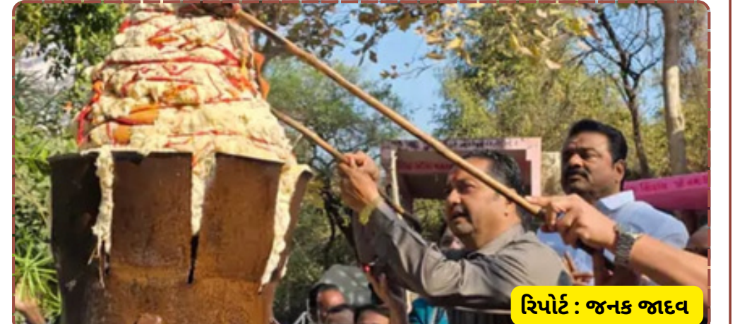
રિપોર્ટ : જનક જાદવ

સમિતિ દ્વારા ભક્તો માટે સુંદર વ્યવસ્થા કરવામાં આવી હતી, જેના કારણે સમગ્ર આયોજન ખૂબ જ શાંતિપૂર્ણ અને ભક્તિભાવ પૂર્વક સંપન્ન થયું હતું.