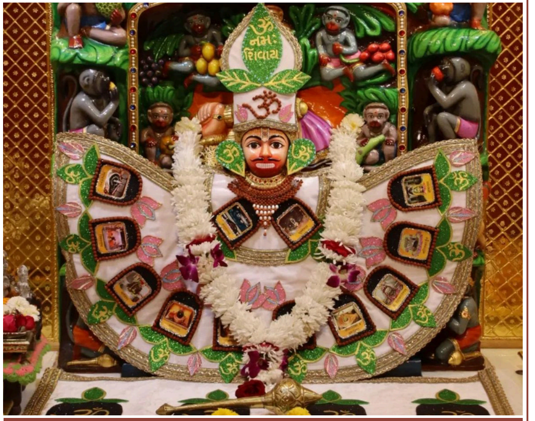
'સબ સુખ લહે તુમ્હારી સરના, તુમ રક્ષક કાહુ કો કરના'