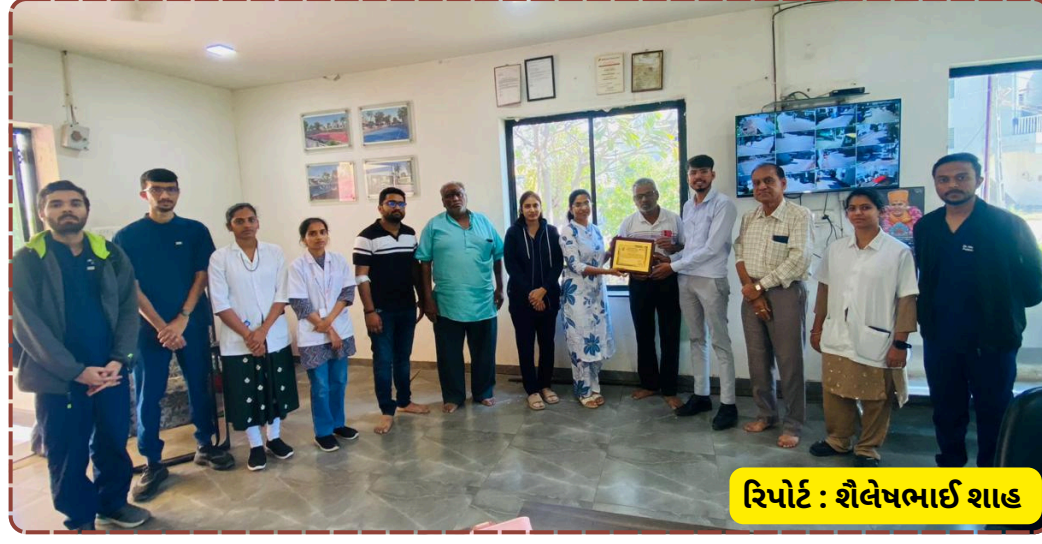
રિપોર્ટ : શૈલેષભાઈ શાહ

નહીં પરંતુ સમાજમાં સ્વાસ્થ્ય પ્રત્યે જાગૃતિ લાવવા માટે પણ કટિબદ્ધ છે. સોસાયટીના હોદ્દેદારોએ હોસ્પિટલની આ પહેલને બિરદાવી હતી અને રક્તદાતાઓને પ્રમાણપત્ર આપી પ્રોત્સાહિત કર્યાં હતા.