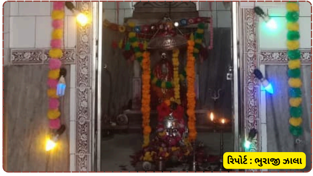
રિપોર્ટ : ભુરાજી ઝાલા

પ્રસાદી રૂપે ભાંગ ગ્રહણ કરી હતી. શ્રદ્ધાળુઓની આસ્થા અને ભક્તિને કારણે સાપાવાડાના નીલકંઠેશ્વર મહાદેવ મંદિરે અનેરો દિવ્ય માહોલ સર્જાયો હતો.