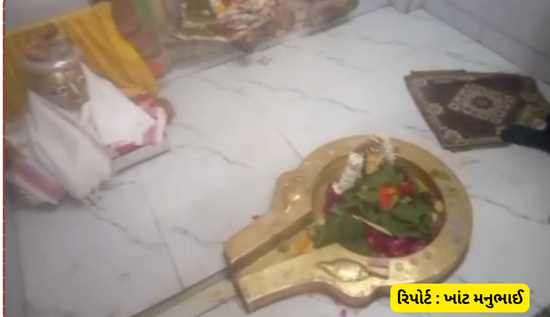
રિપોર્ટ : ખાંડ મનુભાઈ

મહેસાણા તાલુકાના ગ્રામ્ય વિસ્તારોમાં 'માનવ સેવા એ જ પ્રભુ સેવા' સંસ્થા દ્વારા દર મહિનાની જેમ આ મહિને પણ જરૂરિયાતમંદ પરિવારોને રાશન કીટ આપવામાં આવી હતી. સંસ્થા દ્વારા દર મહિને નિયમિતપણે 82 પરિવારોને રસોડાની જીવનજરૂરી ચીજવસ્તુઓ પૂરી પાડવામાં આવે છે.