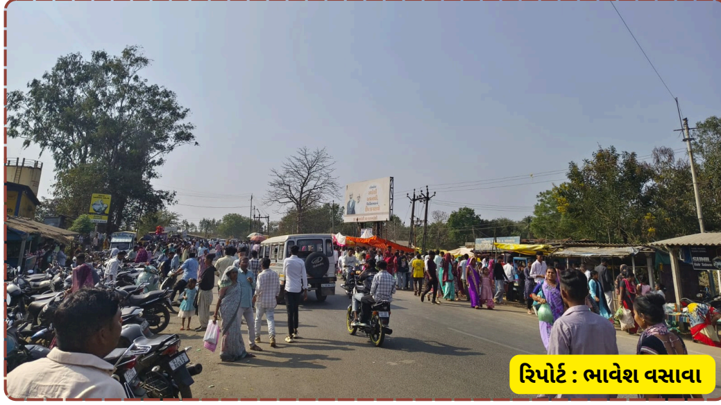
રિપોર્ટ : ભાવેશ વસાવા

શ્રદ્ધાળુઓએ શિવજીના દર્શન કરી સુખ-શાંતિની પ્રાર્થના કરી હતી. આ રીતે નેત્રંગ તાલુકામાં મહાશિવરાત્રીનું પર્વ ખૂબ જ હર્ષોલ્લાસ સાથે સંપન્ન થયું હતું.