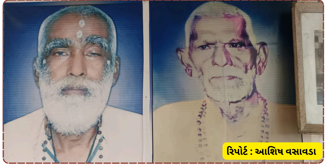
રિપોર્ટ: આશિષ વસાવડા

શિવ આરાધનાથી વાતાવરણ પવિત્ર બની ગયું હતું. બિલખાના ગ્રામજનો અને ટ્રસ્ટ દ્વારા ભક્તો માટે પીવાના પાણી અને દર્શનની સુચારૂ વ્યવસ્થા કરવામાં આવી હતી.