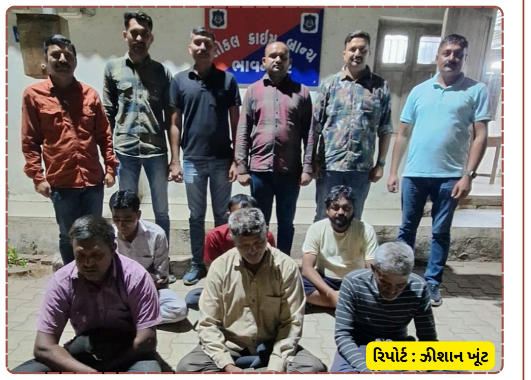
રિપોર્ટ : જીશાન ખૂંટ

આવ્યો છે. પોલીસની આ સક્રિયતાને કારણે શહેરના જુગારી તત્વોમાં ભારે ફફડાટ વ્યાપી ગયો છે.