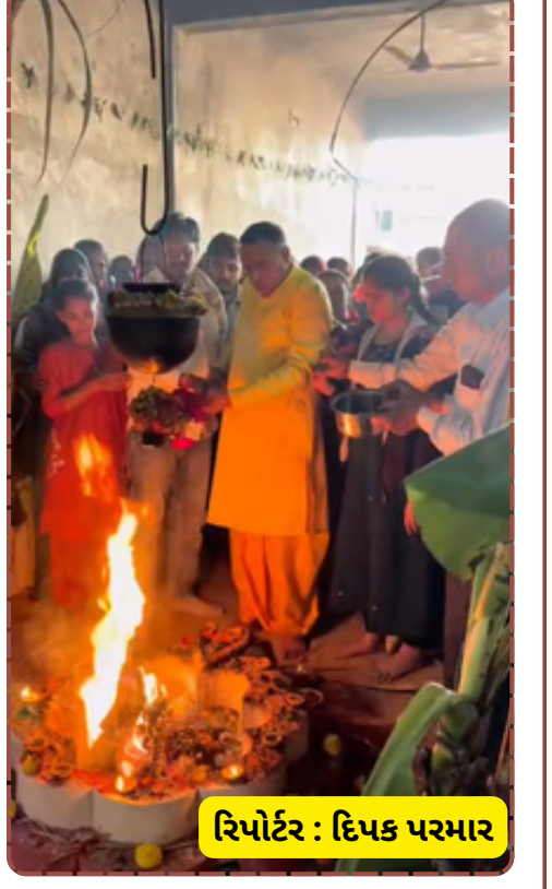
રિપોર્ટ : દિપક પરમાર

પણ સમગ્ર તાલુકાની આસ્થાનું કેન્દ્ર બની ગયું છે.