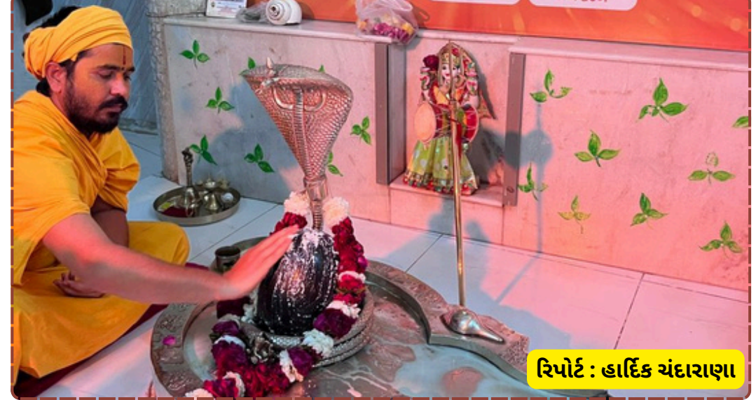
રિપોર્ટ : હાર્દિક ચંદ્રારાણા

માળીયા હાટીનામાં બ્રહ્માકુમારીઝ દ્વારા શિવધ્વજારોહણ અને મહાઆરતી સાથે ૯૦મી ત્રિમૂર્તિ શિવજયંતીની આધ્યાત્મિક ઉજવણી કરવામાં આવી.