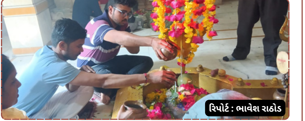
રિપોર્ટ: ભાવેશ રાઠોડ

કરવામાં આવ્યું હતું, જે રાત્રિના સમયે વધુ ભવ્ય જણાતું હતું. શિવ ભક્તોમાં પર્વને લઈ ભારે ઉત્સાહ હતો અને વડીલોથી લઈને બાળકો સુધી સૌ કોઈ શિવ ભક્તિમાં લીન જોવા મળ્યા હતા. વહીવટી તંત્ર અને મંદિર સમિતિના સહયોગથી ભક્તોને સરળતાથી દર્શન થાય તેવી વ્યવસ્થા ગોઠવવામાં આવી હતી. સાંજે મહા આરતી અને મહાદેવના શણગારના દર્શન કરી શ્રદ્ધાળુઓએ ધન્યતા અનુભવી હતી.