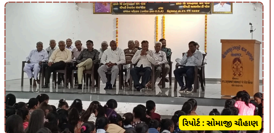
રિપોર્ટ : સોમાજી ચૌહાણ

માર્ગદર્શન પૂરું પાડ્યું હતું. શાળાના તમામ શિક્ષકગણે દિવસ-રાત મહેનત કરી આ કાર્યક્રમને આયોજનબદ્ધ રીતે સફળ બનાવ્યો હતો. આ સમારંભે વિદ્યાર્થીઓમાં નવો ઉત્સાહ અને આત્મવિશ્વાસ ભર્યો હતો.