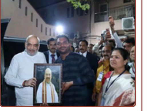
કેન્દ્રીય ગૃહ મંત્રી અમિત શાહે નડિયાદ સંતરામ મંદિરમાં અખંડ જ્યોતના દર્શન કર્યા. રોકસ્ટાર ચેરીટેબલ ટ્રસ્ટ દ્વારા તેમનું સન્માન કરાયું.