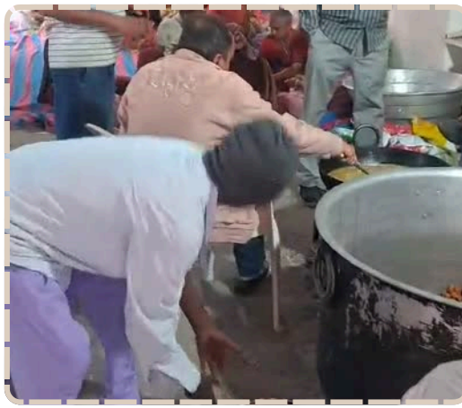
સર્વોદય હનુમાન મિત્ર મંડળ દ્વારા માત્ર રૂ. 90માં 3500 કિલો ઊંઘિયાનું વિતરણ. 12 વર્ષથી "ના નફો-ના નુકસાન"ના ધોરણે સેવા.

છે. સર્વોદય હનુમાન મિત્ર મંડળનું આ પ્રેરણાદાયી કાર્ય સમાજમાં એકતા અને સેવાભાવનાનો સંદેશ ફેલાવી રહ્યું છે. જનસમુદાયમાં પણ આ સસ્તી અને શુદ્ધ પ્રસાદીને લઈને ભારે ઉત્સાહ જોવા મળ્યો હતો. રિપોર્ટ : જયેશભાઈ મોરી