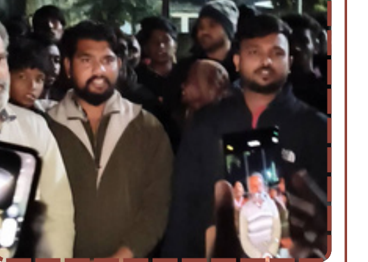
માતરના ગરમાળામાં હિન્દુ યુવાન પર છરીથી હુમલો કરનાર આરોપીની ધરપકડ. સમાજે લુખ્ખા તત્ત્વોનો જાહેરમાં વરઘોડો કાઢવા કરી માંગ.

આવા ગુનેગારોનો જાહેરમાં વરઘોડો કાઢવામાં આવે, જેથી ભવિષ્યમાં કોઈ આવી હિંમત ન કરે. રિપોર્ટ : હસમુખ નાયક