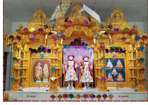
વડાલી BAPS મંદિરમાં મકરસંક્રાંતિ નિમિત્તે પતંગ-ફિરકીનો શણગાર અને તલ-સીંગની ચીકીનો અત્રકૂટ ધરાવાયો. દર્શનાર્થે ઉમટ્યા ભક્તો.

'સ્વામિનારાયણ' ના નાદથી ગુંજી ઉઠ્યું હતું. વડાલીમાં આ શીતે પતંગ-ઉત્સવની ઉજવણી ભક્તિ અને આનંદના સમન્વય તરીકે યાદગાર બની રહી હતી. રિપોર્ટ : વિશાલ ચૌહાણ