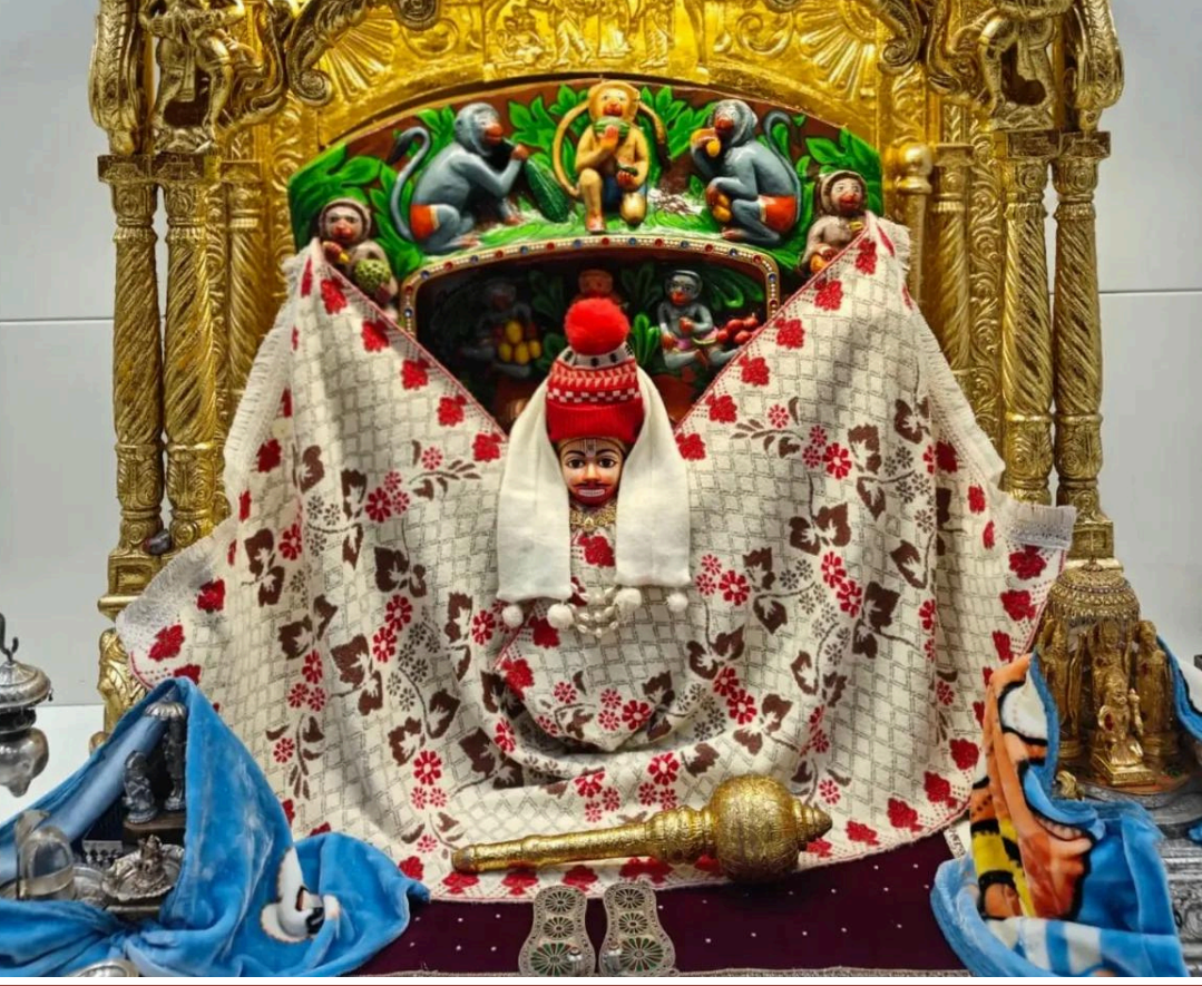
'સબ સુખ લહે તુમહારી સરના, તુમ રક્ષક કાહુ કો ડરના'