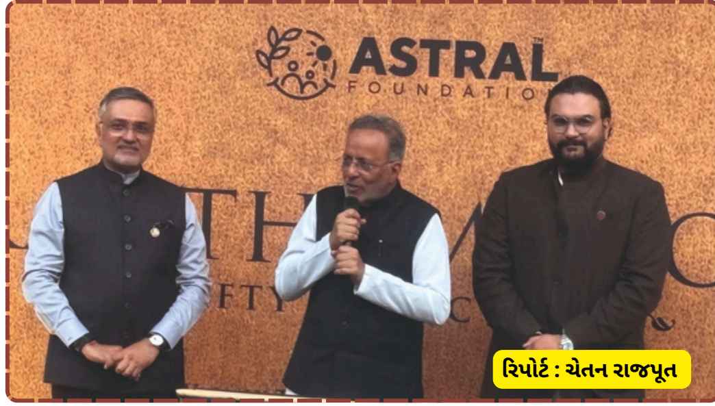
રિપોર્ટ : ચેતન રાજપૂત

વન્યજીવનના જતનનો સંદેશ પ્રસારિત કરવામાં આવ્યો હતો. અંતમાં શાળા પરિવાર, પ્રકૃતિ પ્રેમીઓ અને આમંત્રિત મહેમાનોએ લેખકને આ સિદ્ધિ બદલ અભિનંદન પાઠવ્યા હતા.