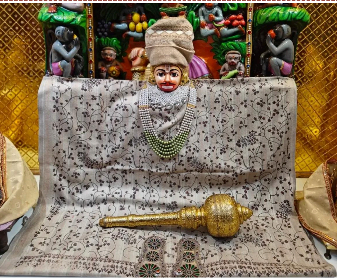
'સબ સુખ લહે તુમહારી સરના, તુમ રક્ષક કાહુ કો ડરના'