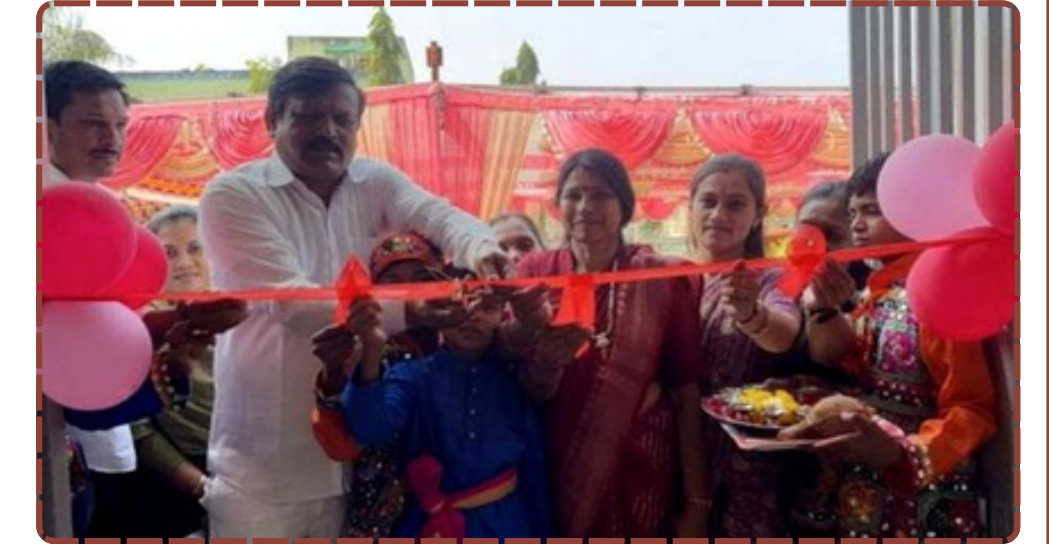
રિપોર્ટ : ભાવેશ વસાવા

હતો. અંતમાં શાળાના આચાર્ય અને સ્ટાફે ધારાસભ્ય સહિતના તમામ મહાનુભાવોનો આભાર માન્યો હતો. આ સુવિધાથી ગાંધી બજાર અને આસપાસના વિસ્તારના મધ્યમ અને ગરીબ વર્ગના બાળકોને શ્રેષ્ઠ શિક્ષણ મેળવવામાં સરળતા રહેશે.