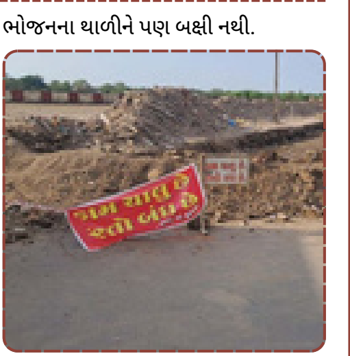
રાજકોટમાં 75 કરોડના સાંઢિયા પુલનું કામ રેલવે મંજૂરીના અભાવે અટક્યું. રેલનગર અને બજરંગવાડીના લાખો લોકો ટ્રાફિકમાં પીસાયા.

અત્યંત ગંભીર બની જાય છે. હોર્નનો અવાજ અને વાહનોના ધુમાડાથી સ્થાનિકોના આરોગ્ય સામે પણ ખતરો ઊભો થયો છે. કોંગ્રેસના પૂર્વ મહામંત્રી કલ્પેશ કુંડલીયા અને અશોકસિંહ વાઘેલાએ તંત્રને આડે હાથ લેતા આક્ષેપ કર્યો છે કે, વહીવટી પ્રક્રિયામાં સમયસર તત્પરતા ન બતાવતા ડિસેમ્બરમાં પુલ શરૂ કરવાનું શાસકોનું વચન પોકળ સાબિત થયું છે. હવે સ્થિતિ એવી છે કે રેલવેની મંજૂરી ક્યારે મળશે અને કામ ક્યારે આગળ વધશે તેની કોઈ સ્પષ્ટતા નથી. માર્ચ-2026ની જે મર્યાદા નક્કી કરાઈ હતી તે પણ હવે પૂર્ણ થવી અશક્ય જણાય છે. તંત્રની આ આળસને કારણે જનતાના 75 કરોડ રૂપિયા તો ખર્ચાયા પણ સુવિધા હજુ જોજનો દૂર છે. વિપક્ષે માંગ કરી છે કે ત્વરિત મંજૂરી મેળવી યુદ્ધના ધોરણે કામ પૂર્ણ કરવામાં આવે, અન્યથા જનતાના આક્રોશનો સામનો કરવા તંત્ર તૈયાર રહે.