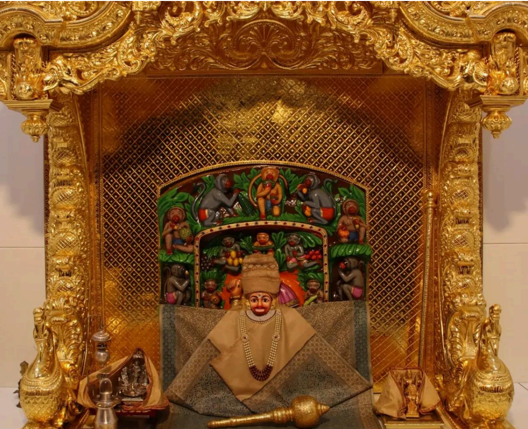
'સબ સુખ લહે તુમહારી સરના, તુમ રક્ષક કાહુ કો ડરના'