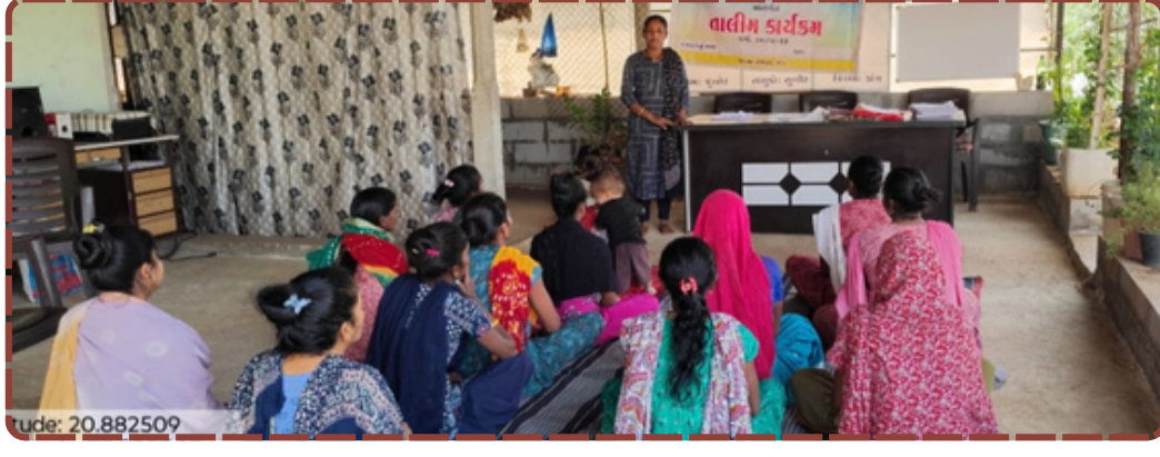
ડાંગ જિલ્લાના સુબીર તાલુકાના જુનેર ગામે પ્રાકૃતિક કૃષિ તાલીમ યોજાઈ હતી. જેમાં કૃષિ સપ્લીઓએ ખેડૂતોને જીવામૃત અને ઘન જીવામૃત બનાવવાની રીત સમજાવી ઝેરમુક્ત ખેતી કરવા પ્રોત્સાહિત કર્યા હતા. આ પહેલનો હેતુ જમીનની ફળદ્રુપતા અને ઉત્પાદન વધારવાનો છે.

જિલ્લો બનાવવાના લક્ષ્યાંક સાથે આ તાલીમ અત્યંત મહત્વપૂર્ણ સાબિત થશે. ખેડૂતોએ પણ ઉત્સાહપૂર્વક આ નવીન ખેતી પદ્ધતિ શીખવામાં રસ દાખવ્યો હતો. રિપોર્ટ : સચિન પવાર