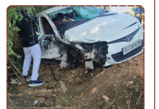
હાલાકી ભોગવવી પડી હતી. રિપોર્ટ : વિશાલ ચૌહાણ

અંદાજે ૩૦ મિનિટની ભારે જહેમત બાદ રાજભાઈને સુરક્ષિત રીતે બહાર કાઢવામાં આવ્યા હતા. ઘટનાની જાણ થતા જ ૧૦૮ એમ્બ્યુલન્સની ટીમ ઘટનાસ્થળે પહોંચી હતી અને ઈજાગ્રસ્ત યુવાનને પ્રાથમિક સારવાર આપી સારવાર અર્થે હોસ્પિટલમાં ખસેડવામાં આવ્યો હતો. લોકોની સમયસૂચકતાને કારણે એક આશાસ્પદ યુવાનનો જીવ બચી ગયો હતો. અકસ્માતને કારણે રોડ પર બંને તરફ વાહનોની લાંબી કતારો જોવા મળી હતી, જેનાથી મુસાફરોને