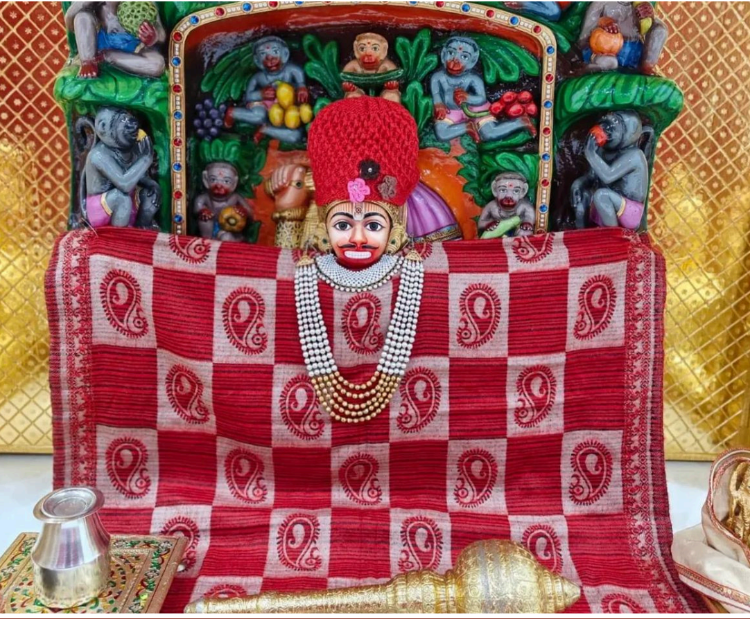
'સબ સુખ લહે તુમ્હારી સરના, તુમ રક્ષક કાહુ કો ડરના'