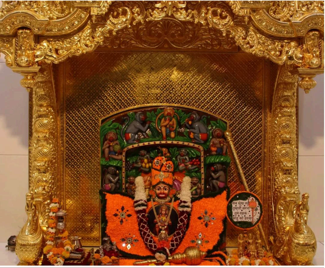
'સબ સુખ લહે તુમહારી સરના, તુમ રક્ષક કાહુ કો ડરના'